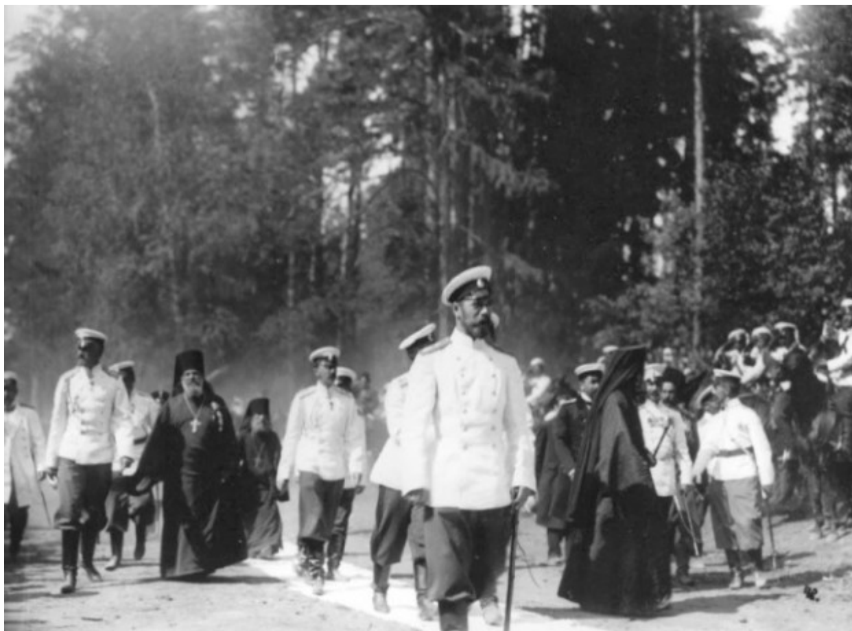
Ο Τσάρος Νικόλαος Β΄ με μέλη της οικογένειάς του πηγαίνοντας προς το αγίασμα του Οσίου Σεραφείμ του Σαρώφ.