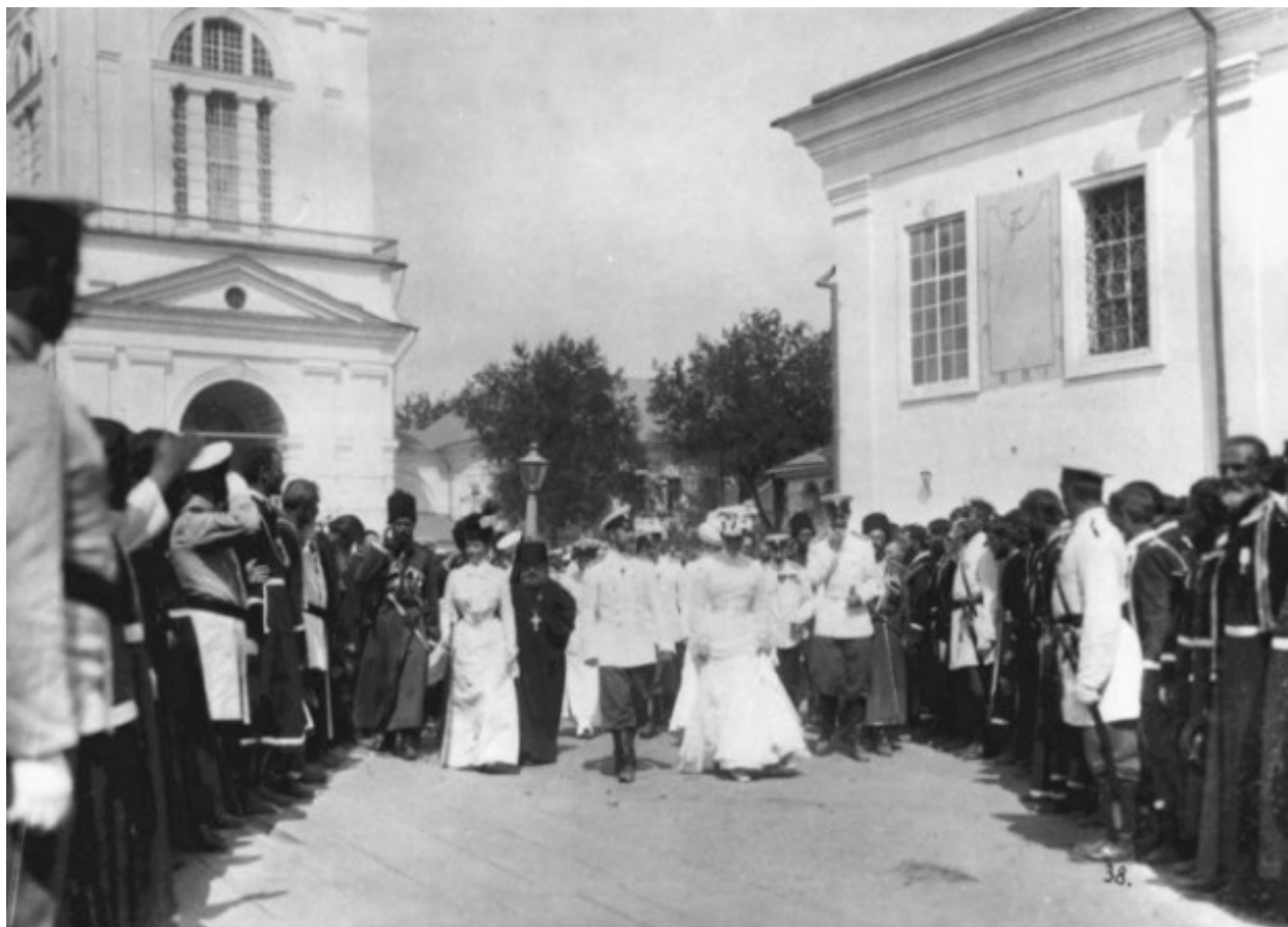
Η υποδοχή της τσαρικής οικογένειας από τον λαό.