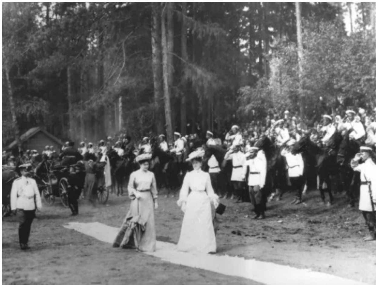
Η Τσαρίνα Αλεξάνδρα Φεοντόροβνα με την αδελφή της Μεγάλη Δούκισσα Φεοντόροβνα Ελισάβετ.