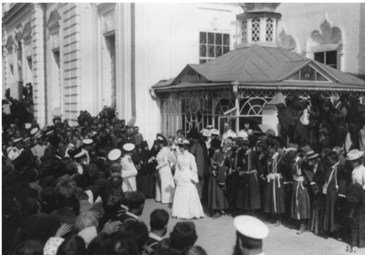
Οι μοναχές της Ιεράς Μονής της Αγίας Τριάδος στο Ντιβέγιεβο χαιρετούν την βασιλομήτρωρα Μαρία