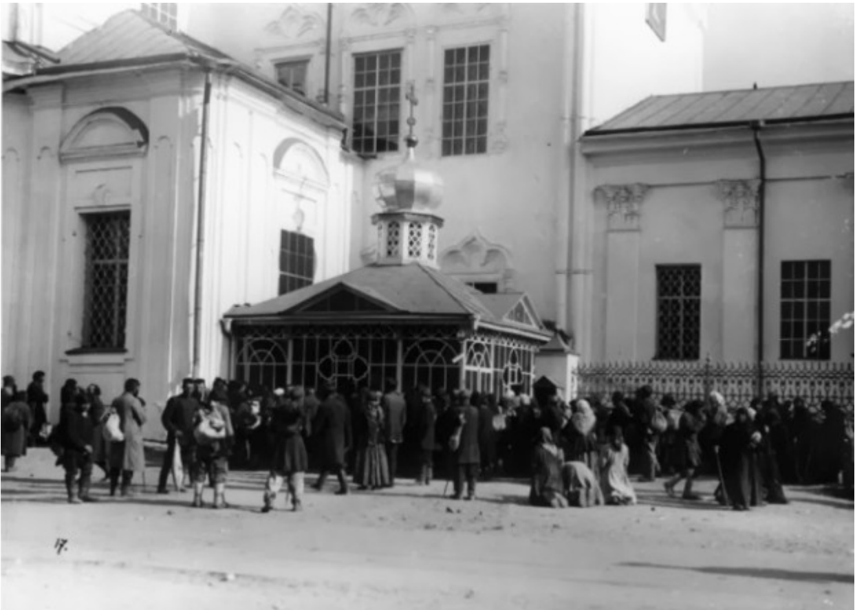
Στο παρεκκλήσι που έγινε πάνω από τον τάφο του Οσίου Σεραφείμ του Σαρώφ.