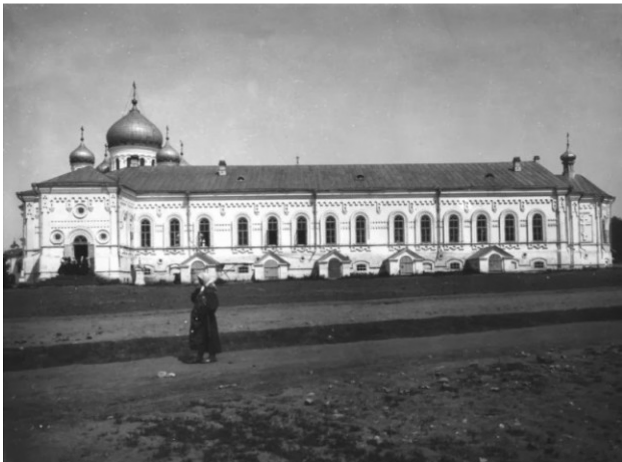
Το κτίριο της μοναστηριακής Τράπεζας.