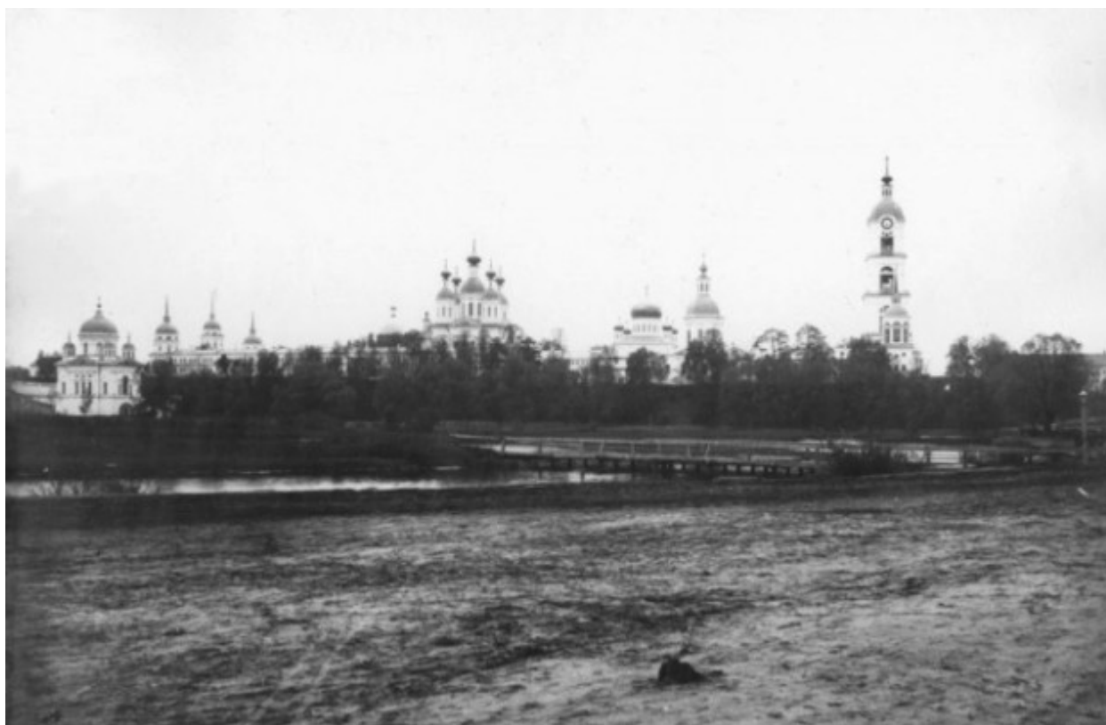
Η Ιερά Μονή της Αγίας Τριάδος στο Ντιβέγιεβο (στα ρωσικά: Свято-Троицкий Серафимо-Дивеевский Монастырь) από τη πλευρά του ποταμού Σαρώφκα.