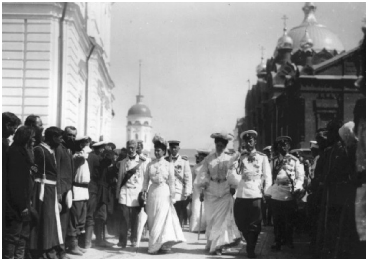
Η υποδοχή της τσαρικής οικογένειας από τον λαό.