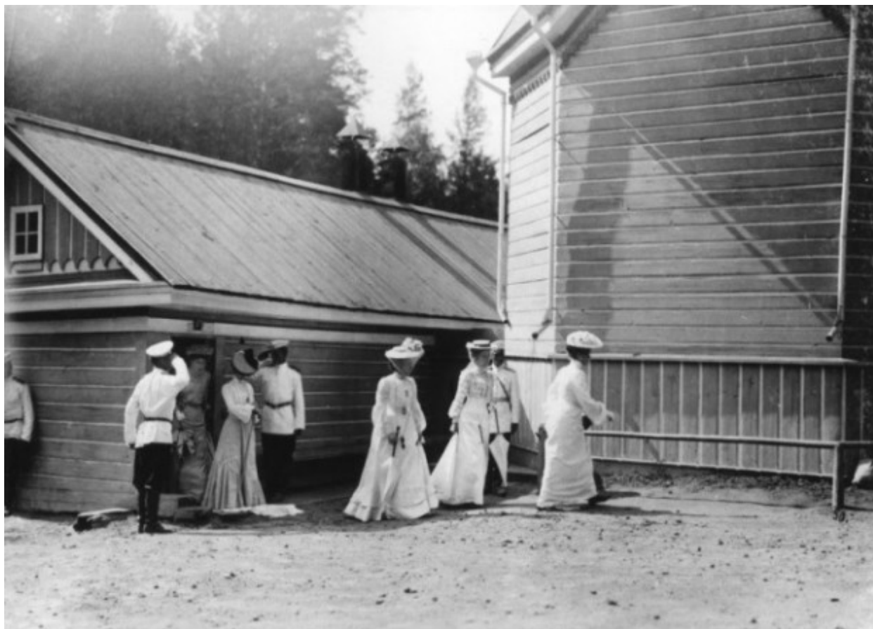
Αποχώρηση μετά από την επίσκεψη στο αγίασμα του Οσίου Σεραφείμ του Σαρώφ.