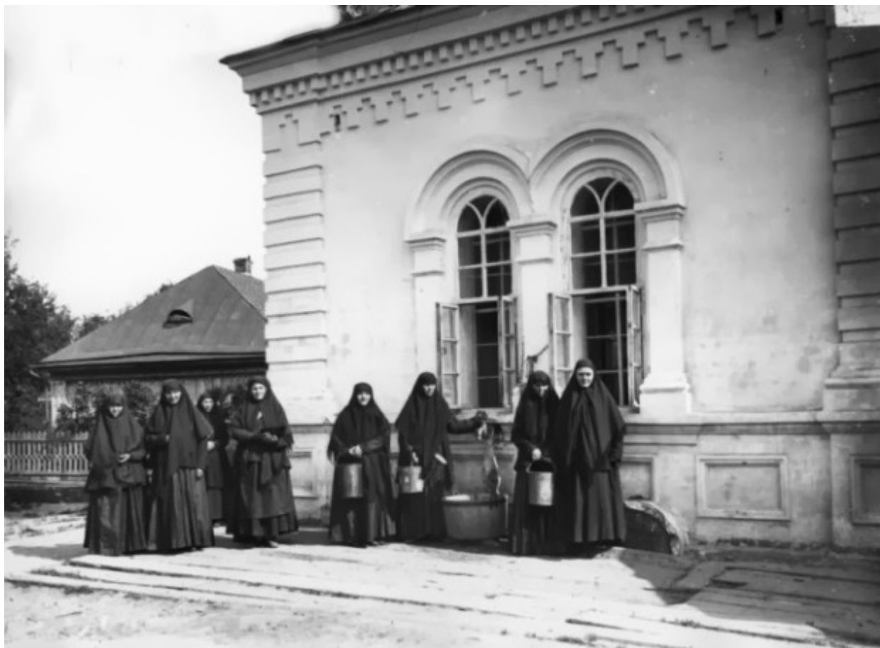
Αδελφές μοναχές στην υδραντλία της Ιεράς Μονής της Αγίας Τριάδος στο Ντιβέγιεβο.