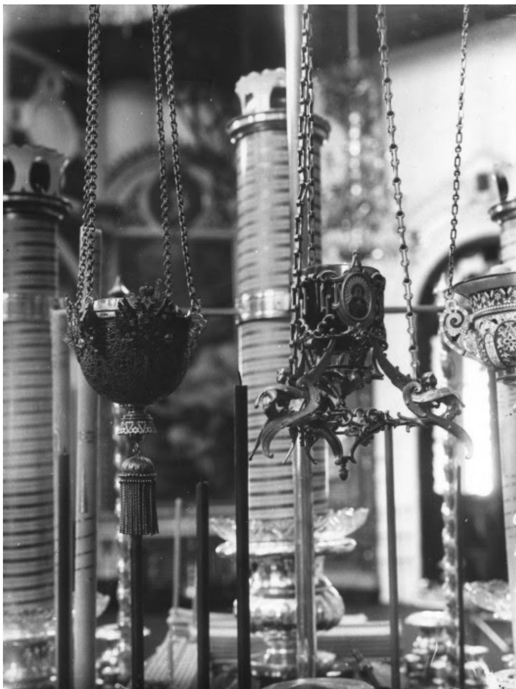
Λαμπάδες του τσάρου Νικόλαου Β΄ μπροστά στην εικόνα Θεοτόκος Ουμιλένιε.