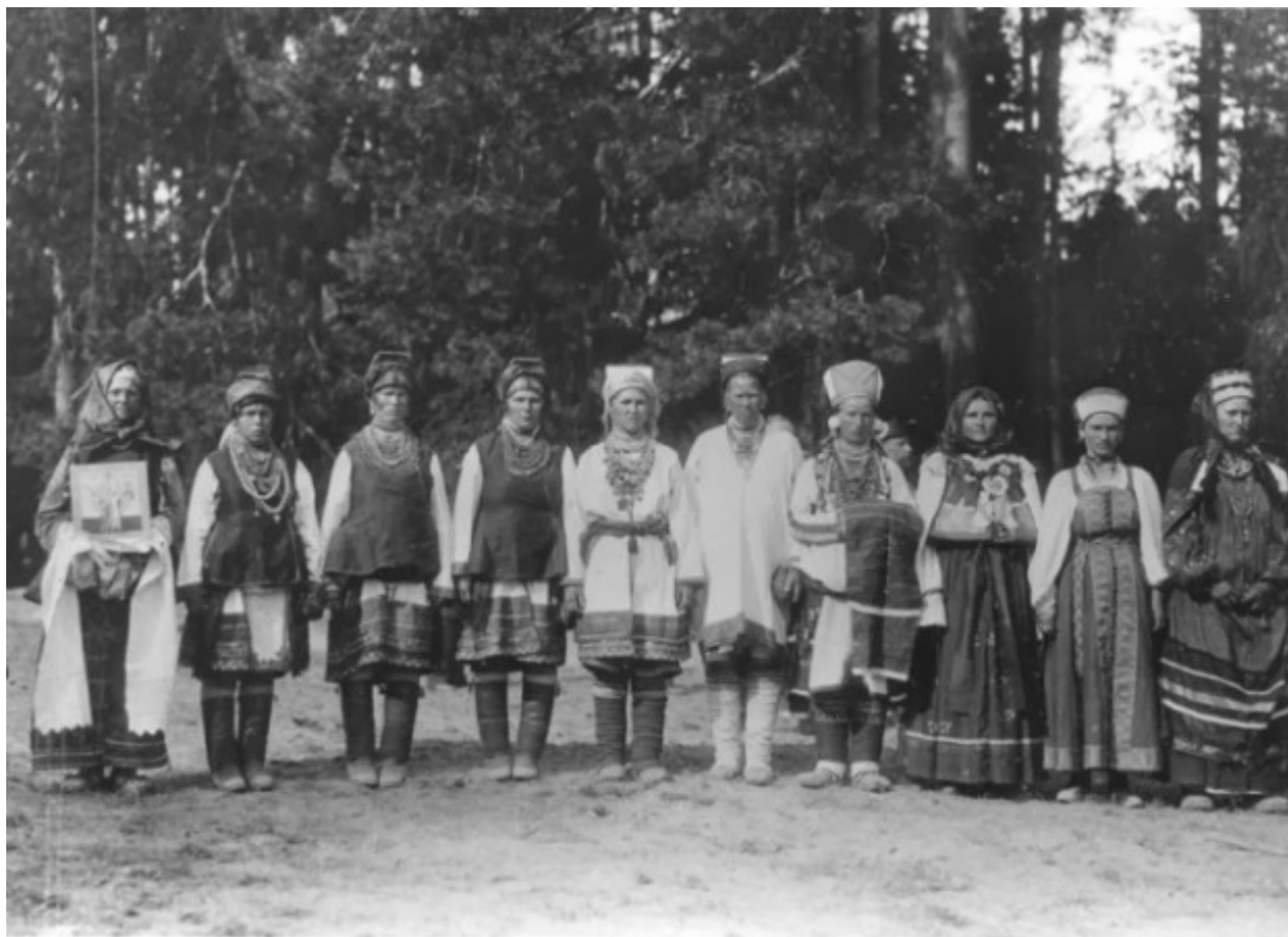
Η υποδοχή του Τσάρου από τους χωρικούς της Μορδοβίας.