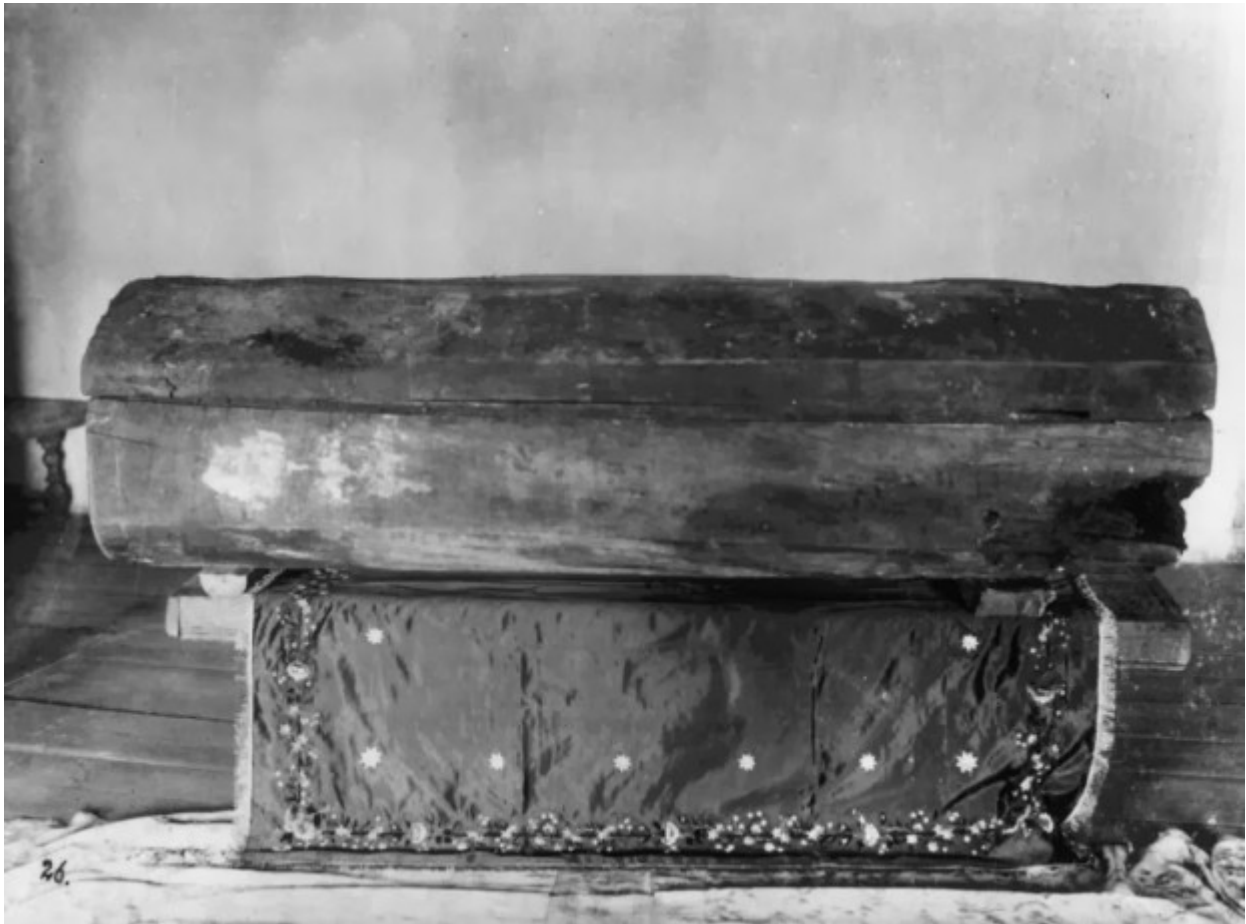
Το ξύλινο φέρετρο στο οποίο εναποτέθηκε ο Όσιος Σεραφείμ του Σαρώφ. Το φέρετρο λαξεύτηκε από τον ίδιο τον Όσιο.

/ Άγιοι - Πατέρες - Γέροντες / Ορθόδοξη πίστη