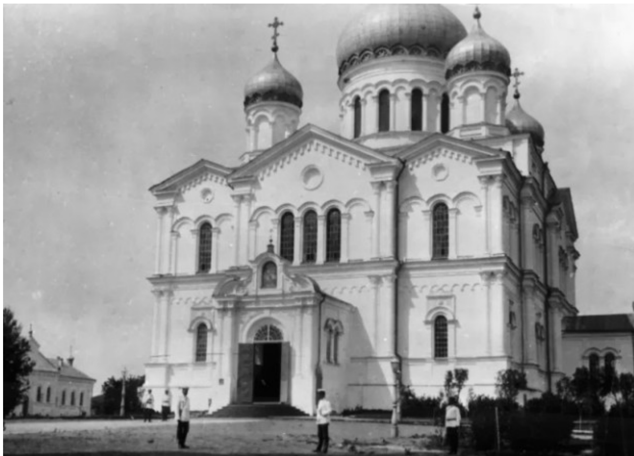
Ο Καθολικός Ναός "Η Κοίμηση της Θεοτόκου" της Ιεράς Μονής της Αγίας Τριάδος στο Ντιβέγιεβο.