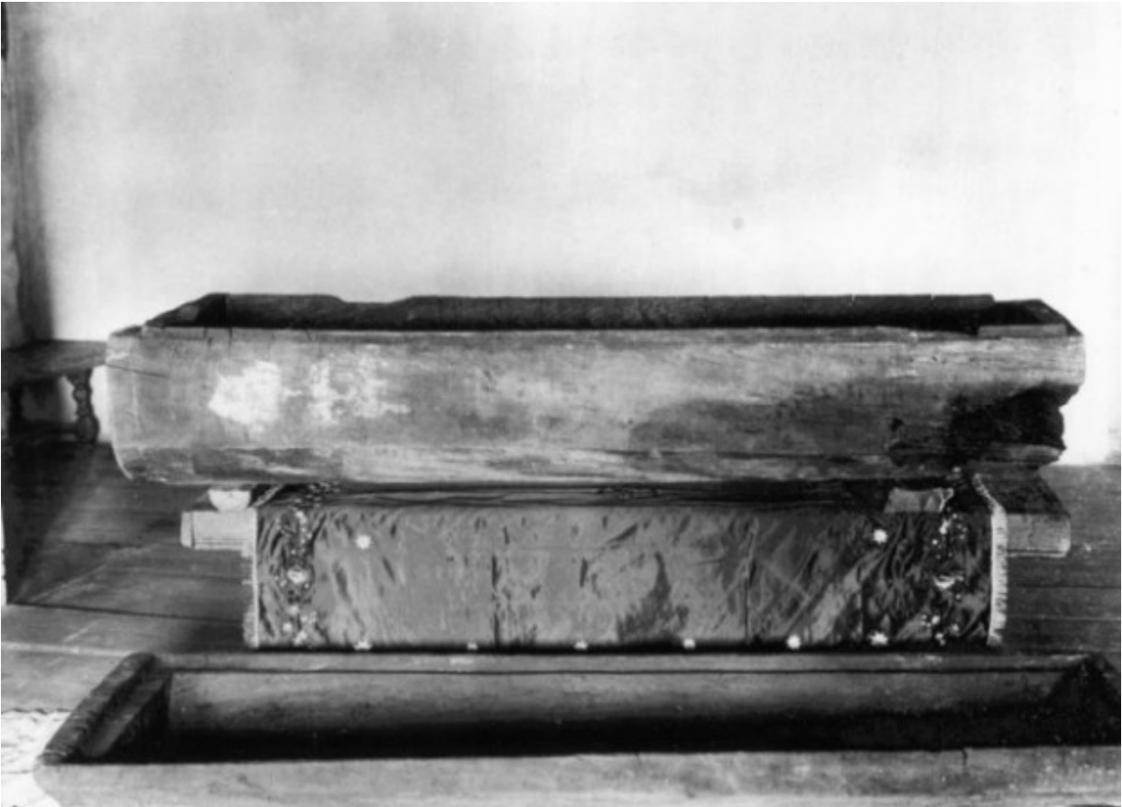
Το ξύλινο φέρετρο στο οποίο εναποτέθηκε ο Όσιος Σεραφείμ του Σαρώφ. Το φέρετρο λαξεύτηκε από τον ίδιο τον Όσιο.