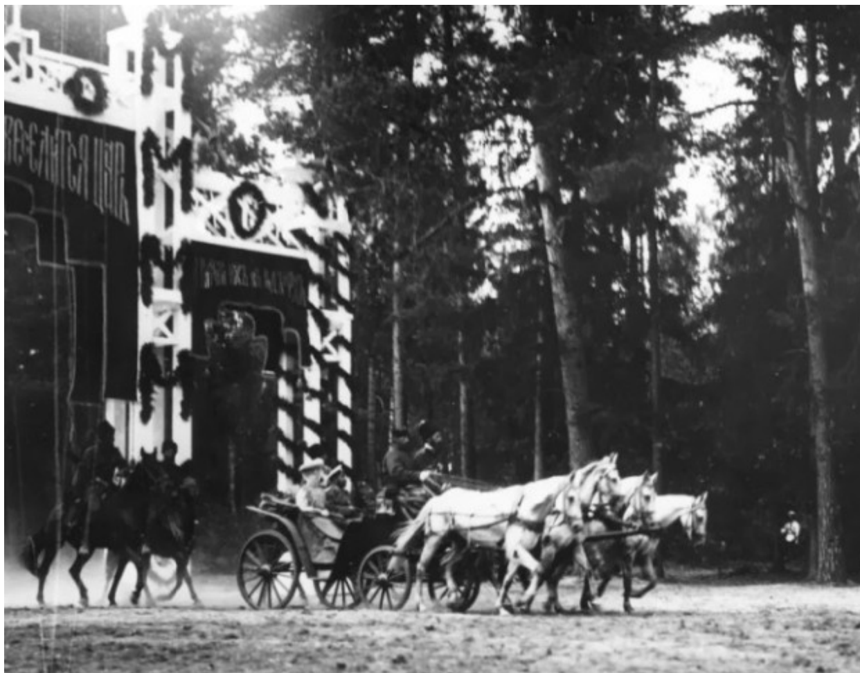
Η είσοδος της τσαρικής άμαξας στην Περιφέρεια Ταμπώφ.