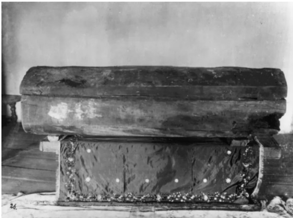
Το ξύλινο φέρετρο του Οσίου Σεραφείμ του Σαρώφ.