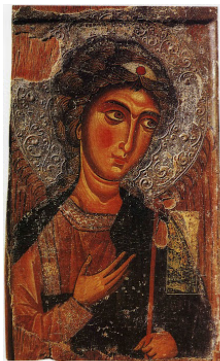
Αρχάγγελος Μιχαήλ (12 αιώνας μ.Χ.) - Ιερά Μονή Ιωάννη Χρυσοστόμου (Κύπρος) στον κατεχόμενο Κουτσοβέντη. Η εικόνα κλάπηκε από τους Τούρκους και αγνοείται η τύχη της.