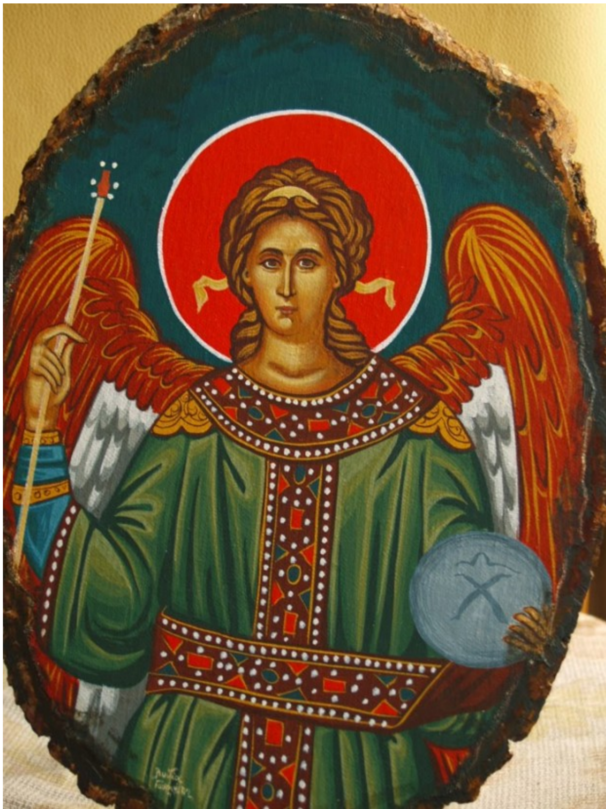
Άγγελος Κυρίου – Λυδία Γουριώτη© ( lydiagourioti-iconography.blogspot.com )