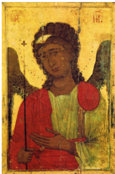
Αρχάγγελος Μιχαήλ (τέλη 14ου μ.Χ. αιώνα, Κύπρος)