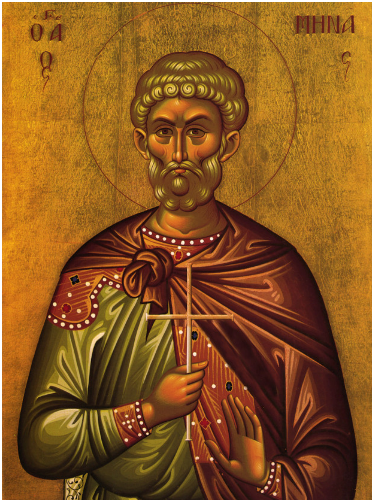
Άγιος Μηνάς «ό έν τῷ Κοτυαείῳ» ο Μεγαλομάρτυρας