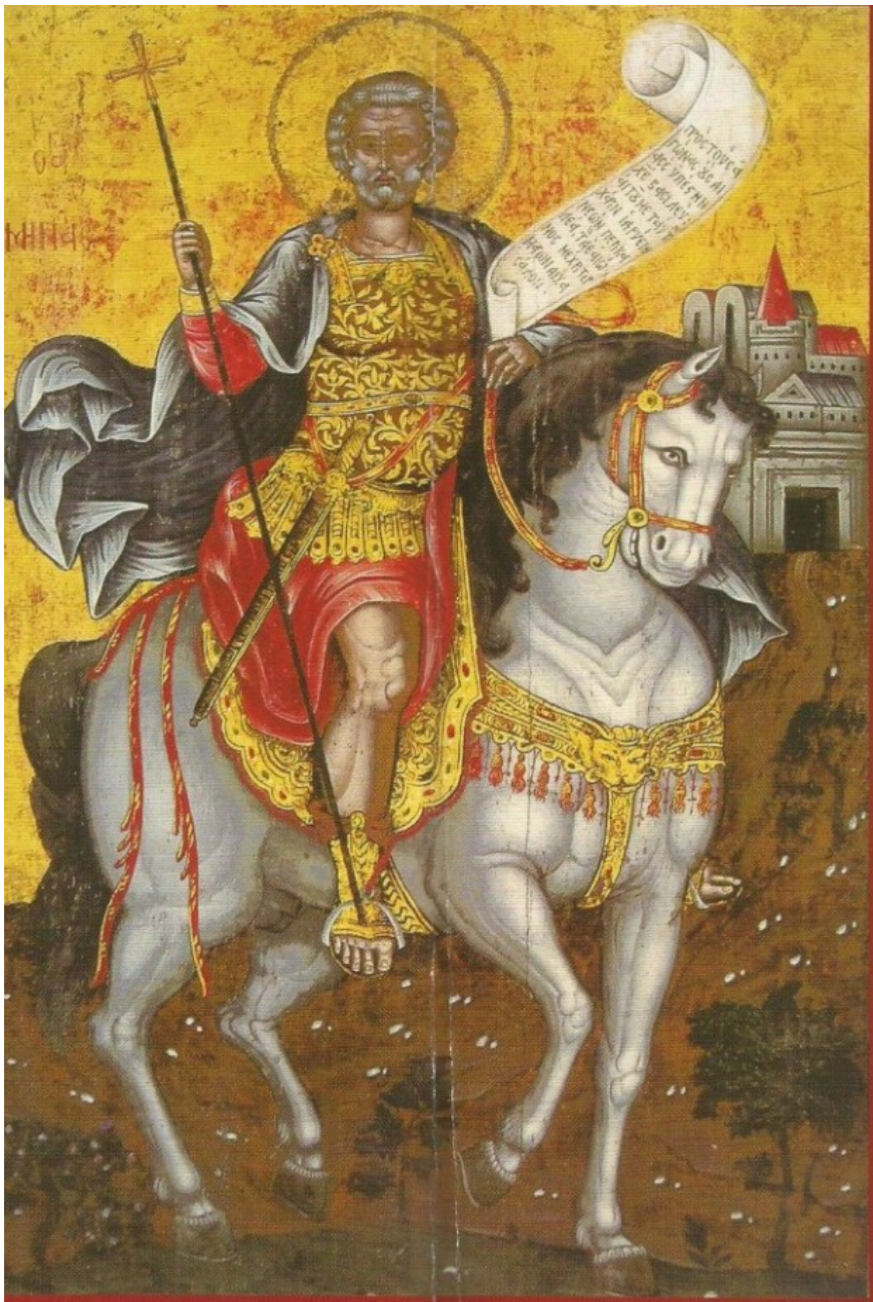
Άγιος Μηνάς «ὁ ἐν τῷ Κοτυαεῖῳ» ὁ Μεγαλομάρτυρας