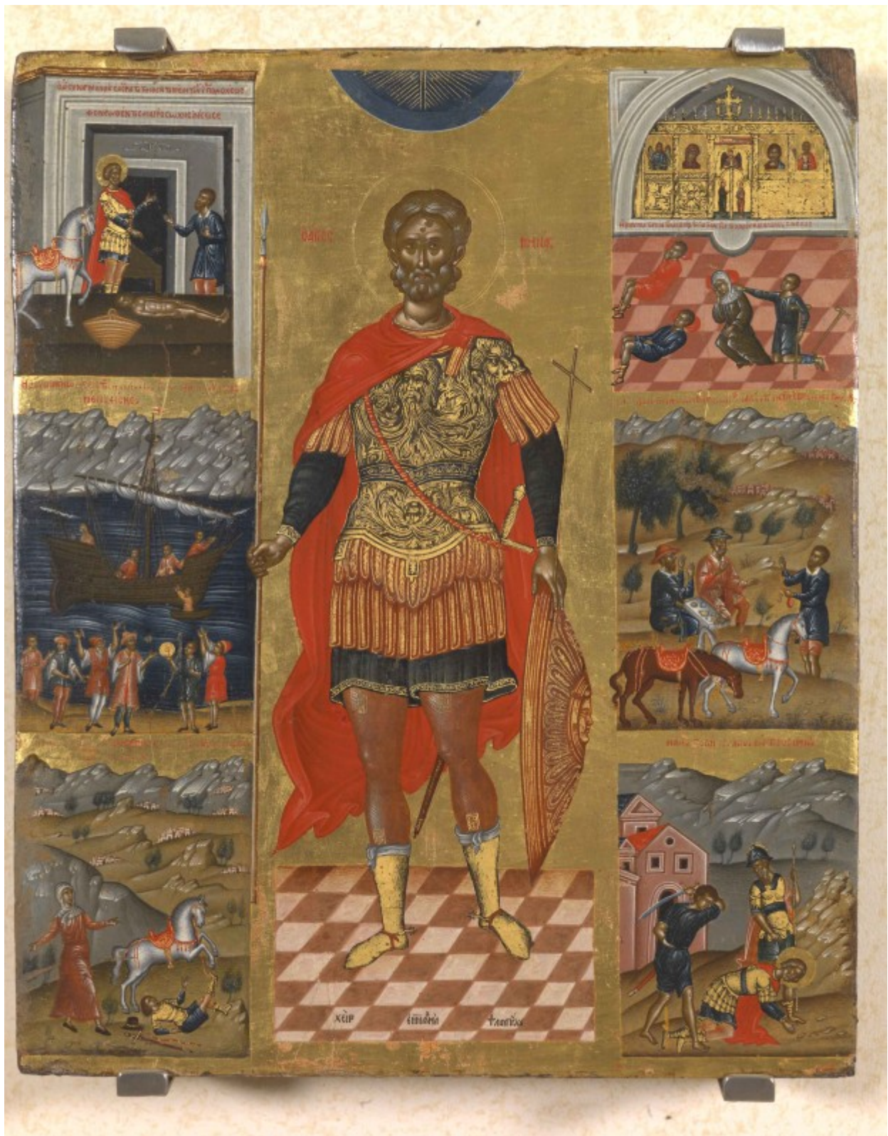
Άγιος Μηνάς «ὁ ἐν τῷ Κοτυαεῖῳ» ὁ Μεγαλομάρτυρας - Εμμανουήλ Λαμπάρδος, ἀρχές 17ου αἰῶνα μ.Χ