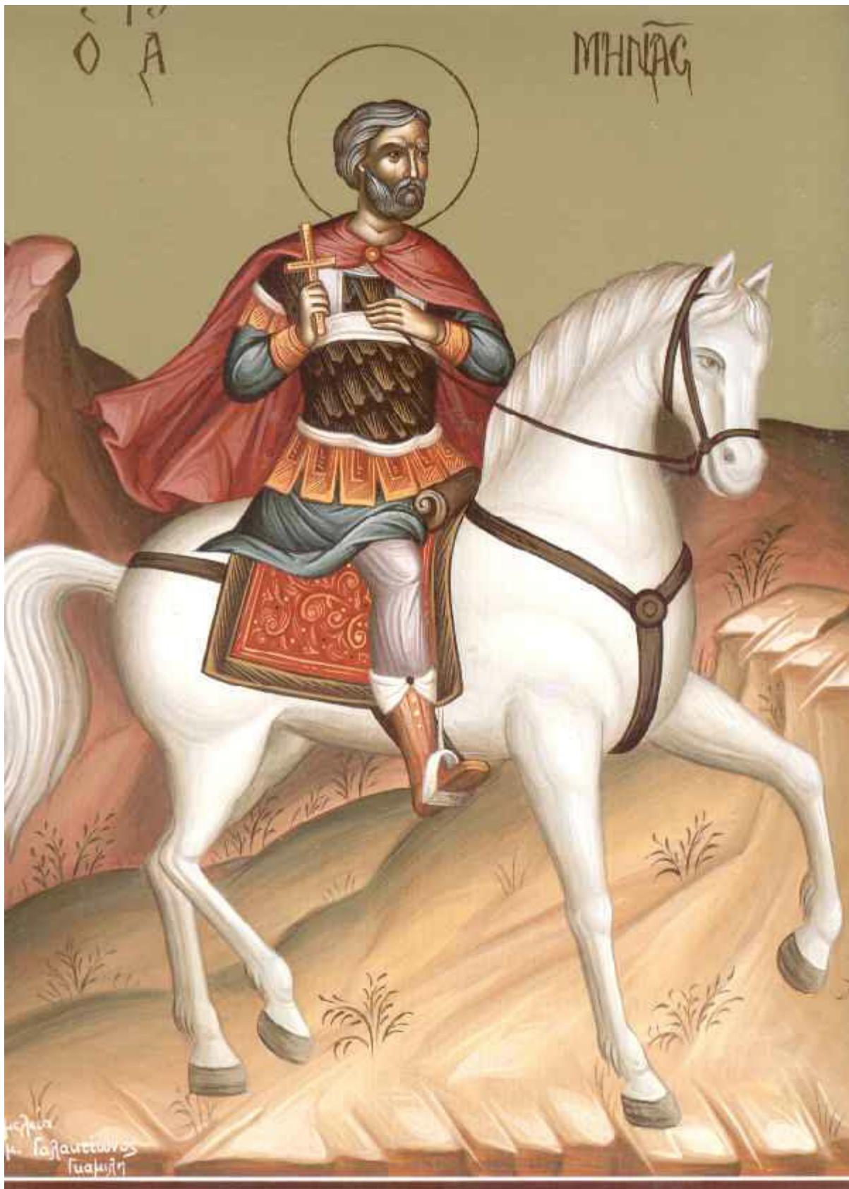
Άγιος Μηνάς «ὁ ἐν τῷ Κοτυαεῖῳ» ὁ Μεγαλομάρτυρας