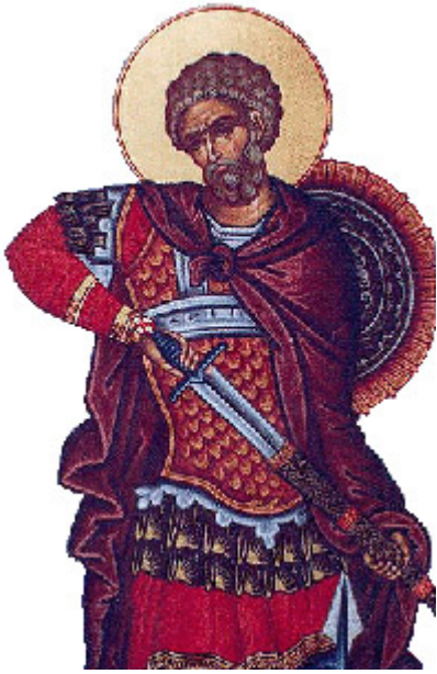
Άγιος Μηνάς «ὁ ἐν τῷ Κοτυαεῖῳ» ὁ Μεγαλομάρτυρας