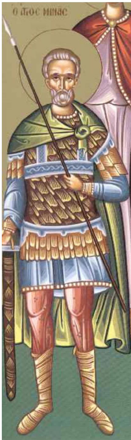
Άγιος Μηνάς «ὁ ἐν τῷ Κοτυαεῖῳ» ὁ Μεγαλομάρτυρας