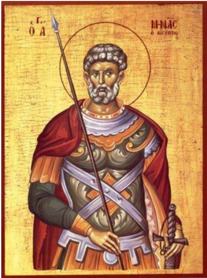
Άγιος Μηνάς «ὁ ἐν τῷ Κοτυαεῖῳ» ὁ Μεγαλομάρτυρας

Εορτάζει στις 11 Νοεμβρίου εκάστου έτους.