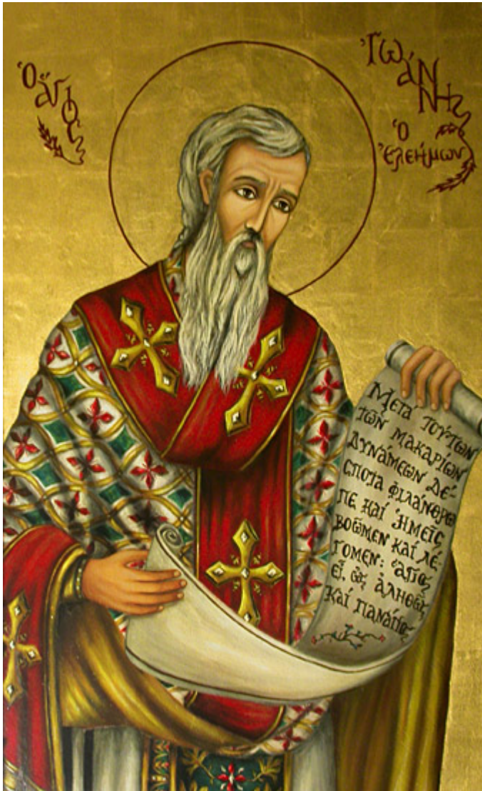
Άγιος Ιωάννης ο Ελεήμονας Αρχιεπίσκοπος Αλεξανδρείας

Εορτάζει στις 12 Νοεμβρίου εκάστου έτους.