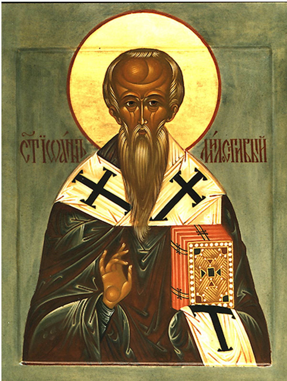
Άγιος Ιωάννης ο Ελεήμονας Αρχιεπίσκοπος Αλεξανδρείας