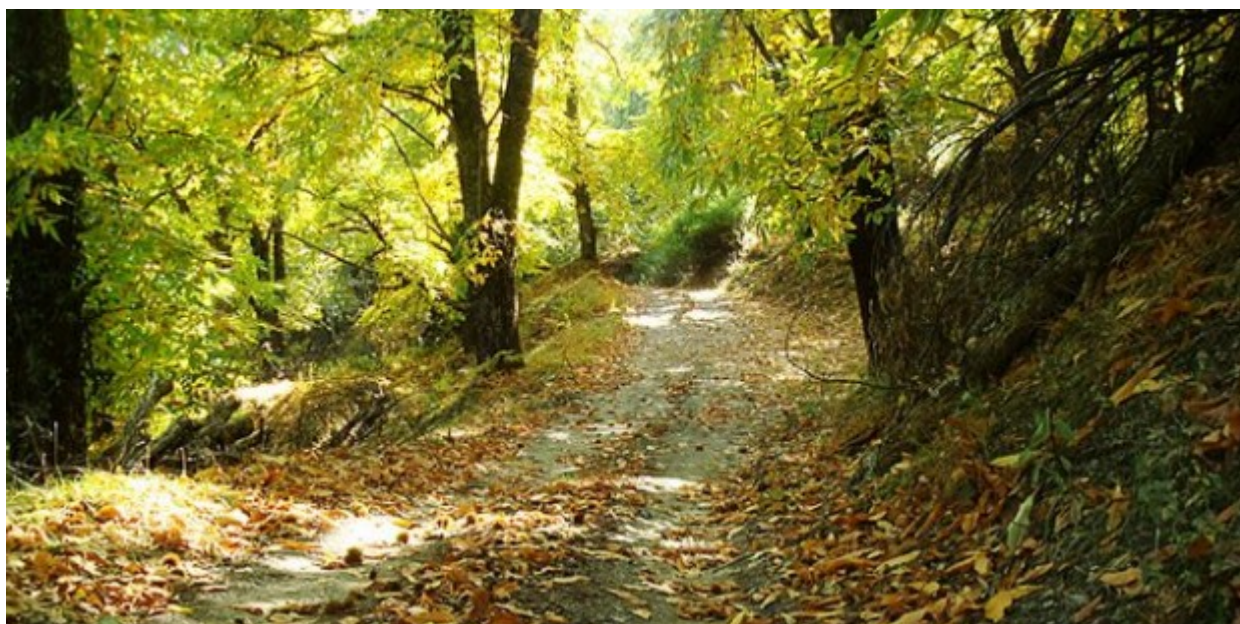
Το καστανοδάσος του Κοσμά, στον Πάρνωνα