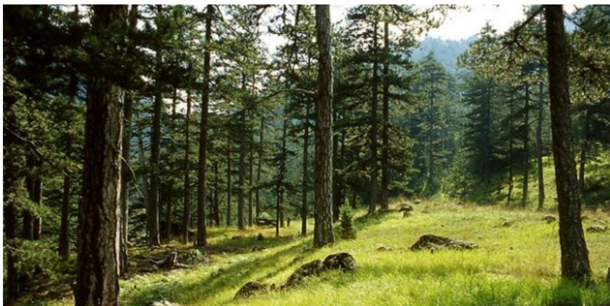
Το δάσος του Λαϊλιά, στο νομό Σερρών