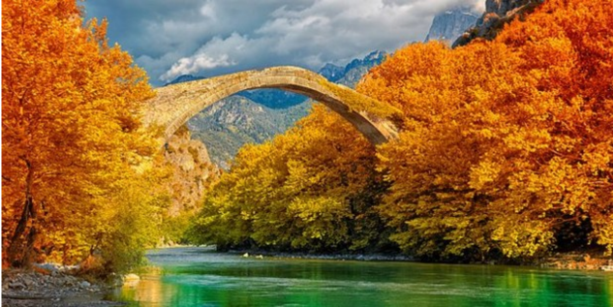
Στον Εθνικό Δρυμό του Βίκου (το γεφύρι της Κόνιτσας)