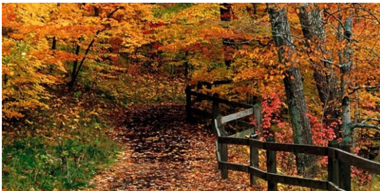
Φθινοπωρινό τοπίο στο παρθένο δάσος Φρακτού