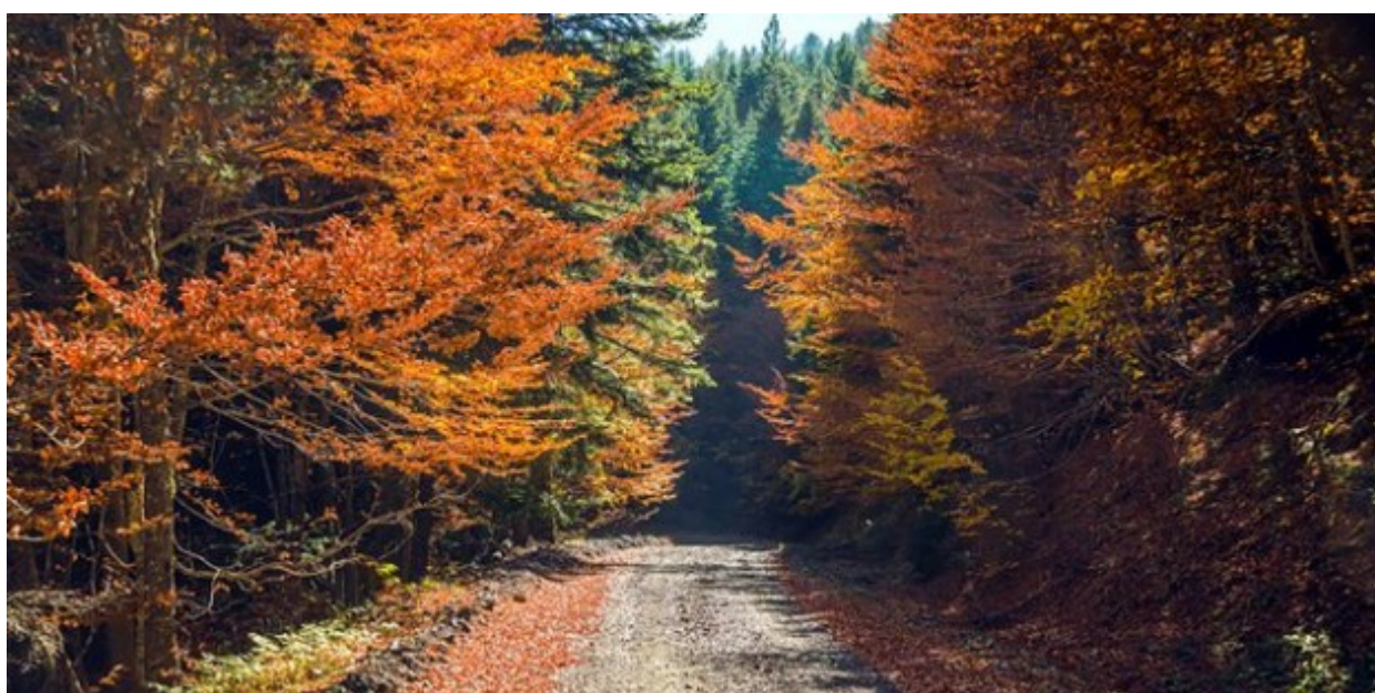
Η Βάλια Κάλντα, κοντά στα Γρεβενά