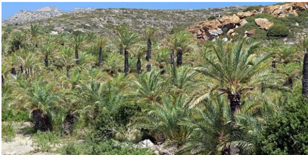
Το φοινικόδασος του Βάι, στην Κρήτη