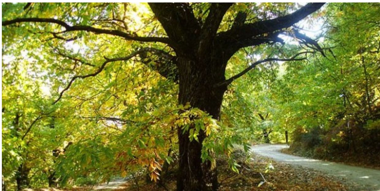
Το καστανοδάσος του Κοσμά, στον Πάρνωνα