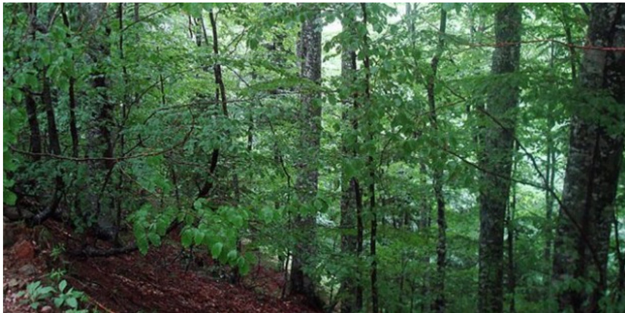
Στο παρθένο δάσος του Φρακτού, στο νομό Δράμας