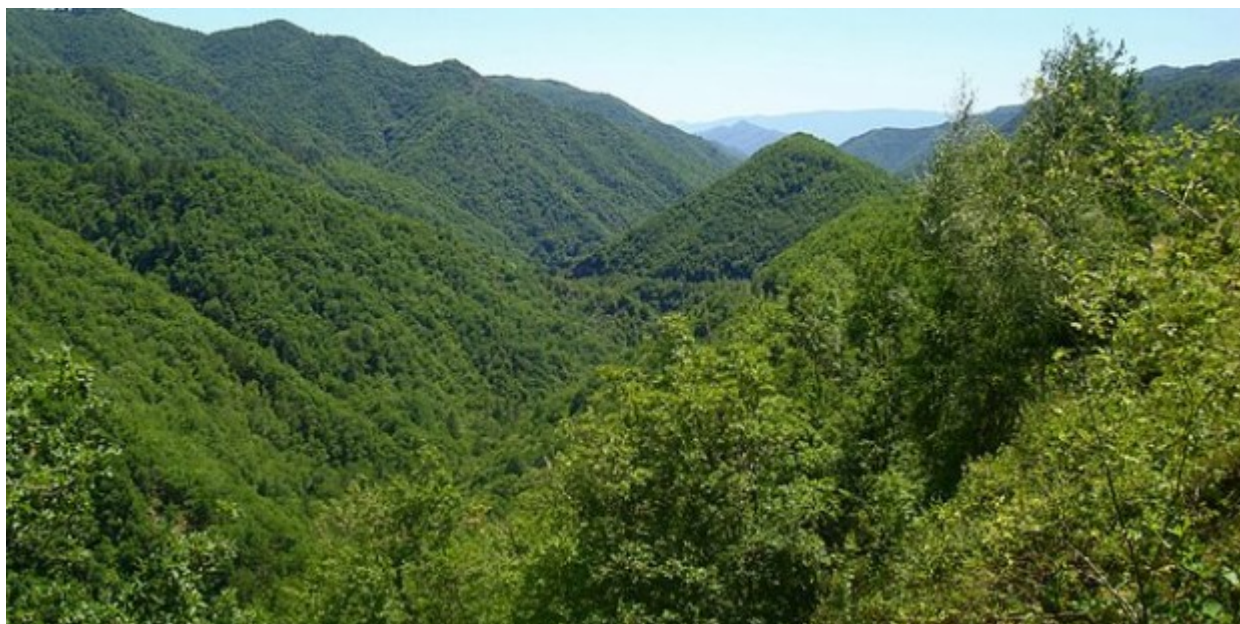
Το δάσος της Ελατιάς, περισσότερο γνωστό ως Καρά Ντερέ, στο νομό Δράμας