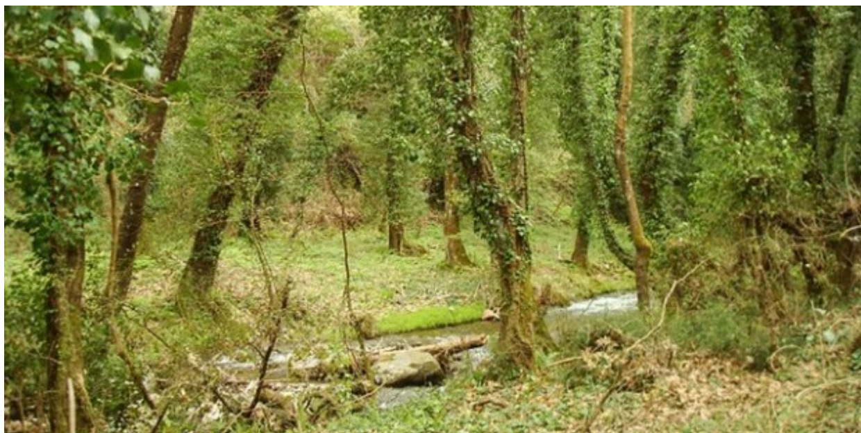
Ο ποταμός Κάστορας, στα δάση του Βόρειου Ταύγετο