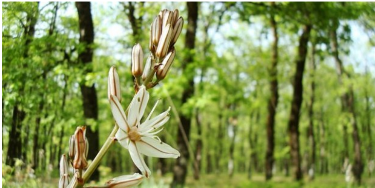
Στο υπέροχο δρυοδάσος της Φολόης, στην Ηλεία