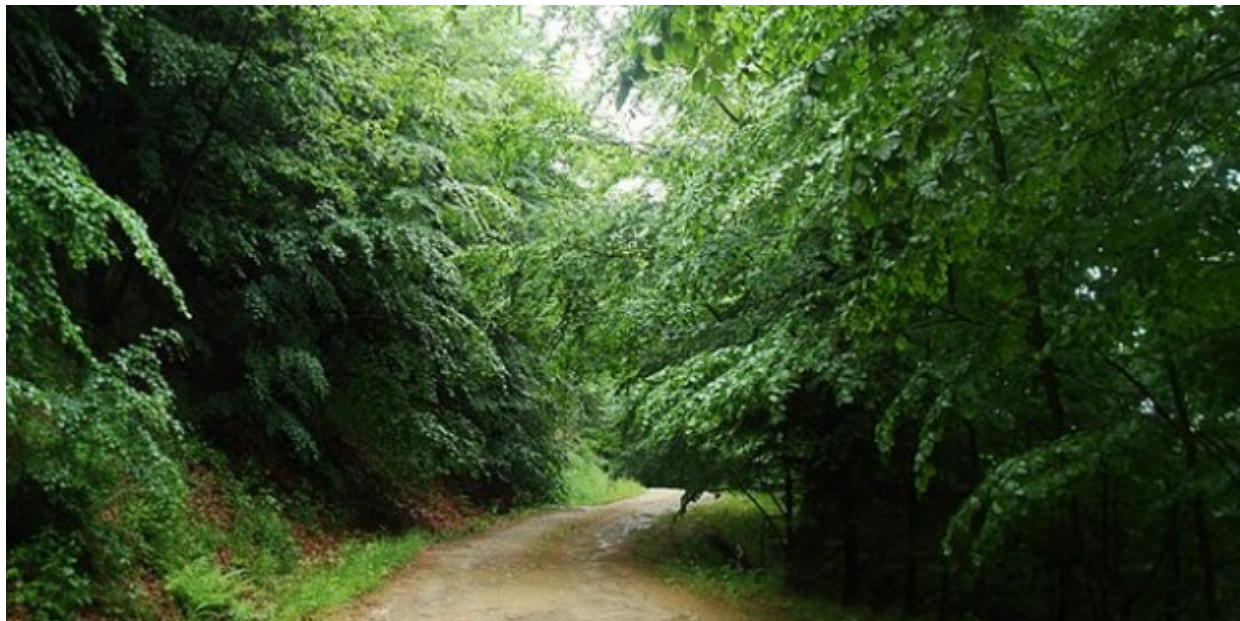
Το δάσος της Χαϊντούς, «μοιρασμένο» μεταξύ Ξάνθης και Δράμας