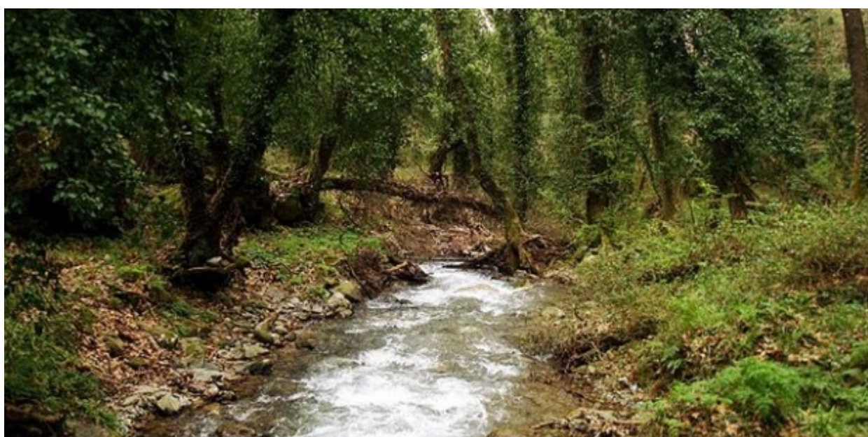
Τα νερά του Κάστορα, στον Βόρειο Ταύγετο