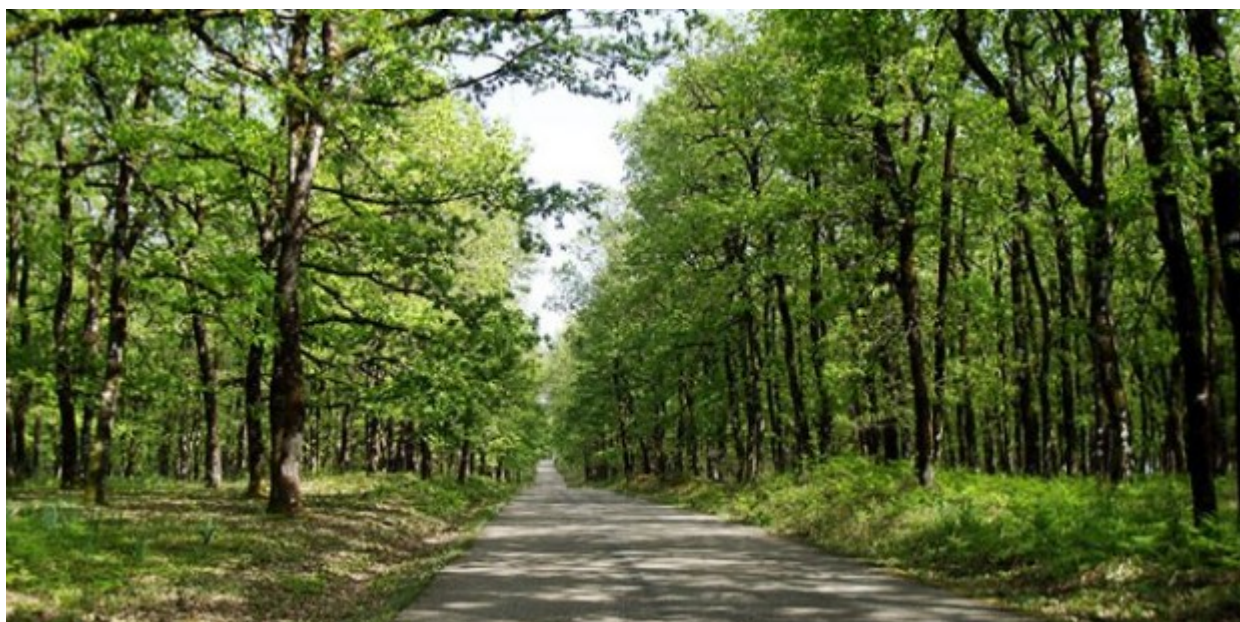
Το μοναδικό εντελώς επίπεδο δάσος της Ελλάδας, η Φολή (στο νομό Ηλείας)