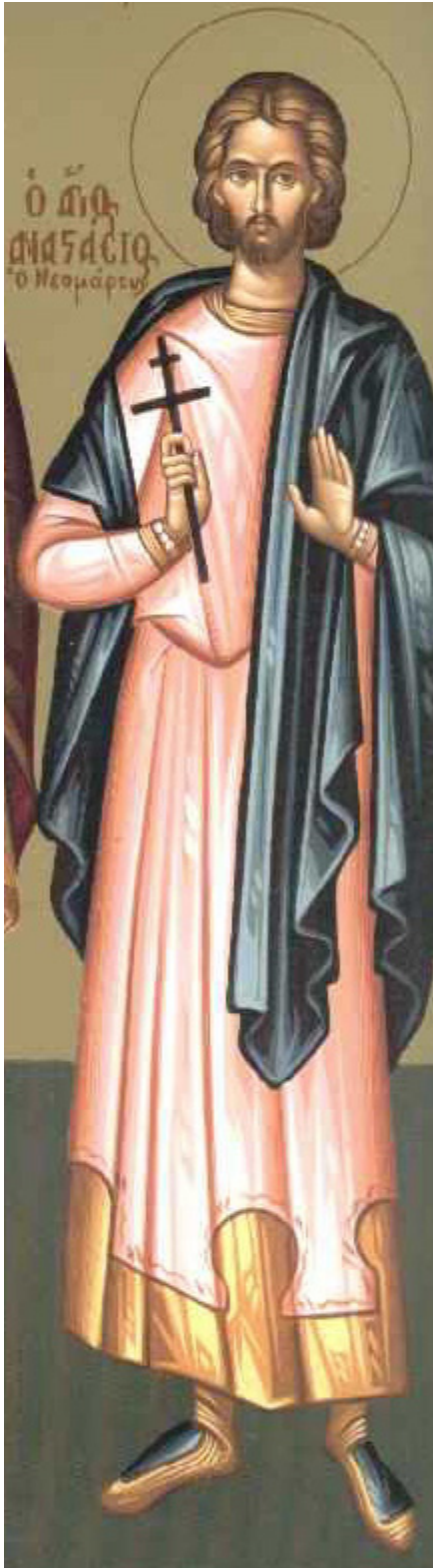
Ἅγιος Αναστάσιος ὁ Νεομάρτυρας ἀπὸ τῆν Παραμυθία τῆς Ἠπείρου

όθεν σου την μνήνην, τελούμεν την Αγίαν, χαρμονικώς τιμώντες, Σε, Αναστάσιε.