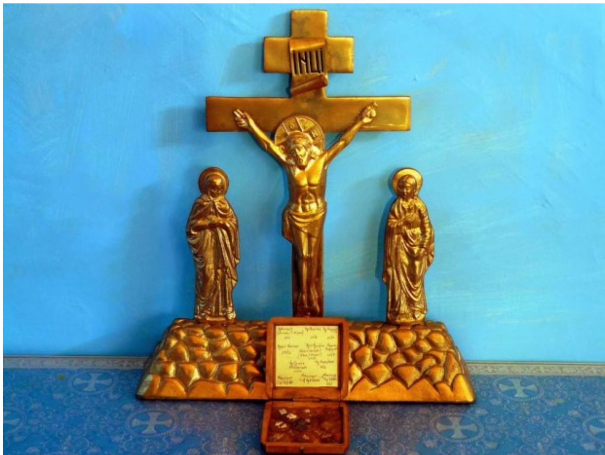
Η ξύλινη λειψανοθήκη με τα λείψανα