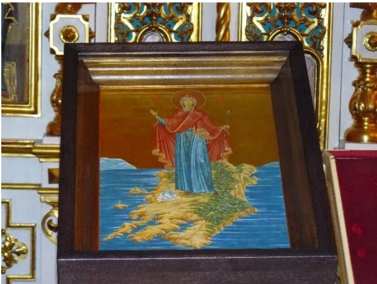
Η Θεοτόκος, η Έφορος του Ολχόν Βαϊκάλης