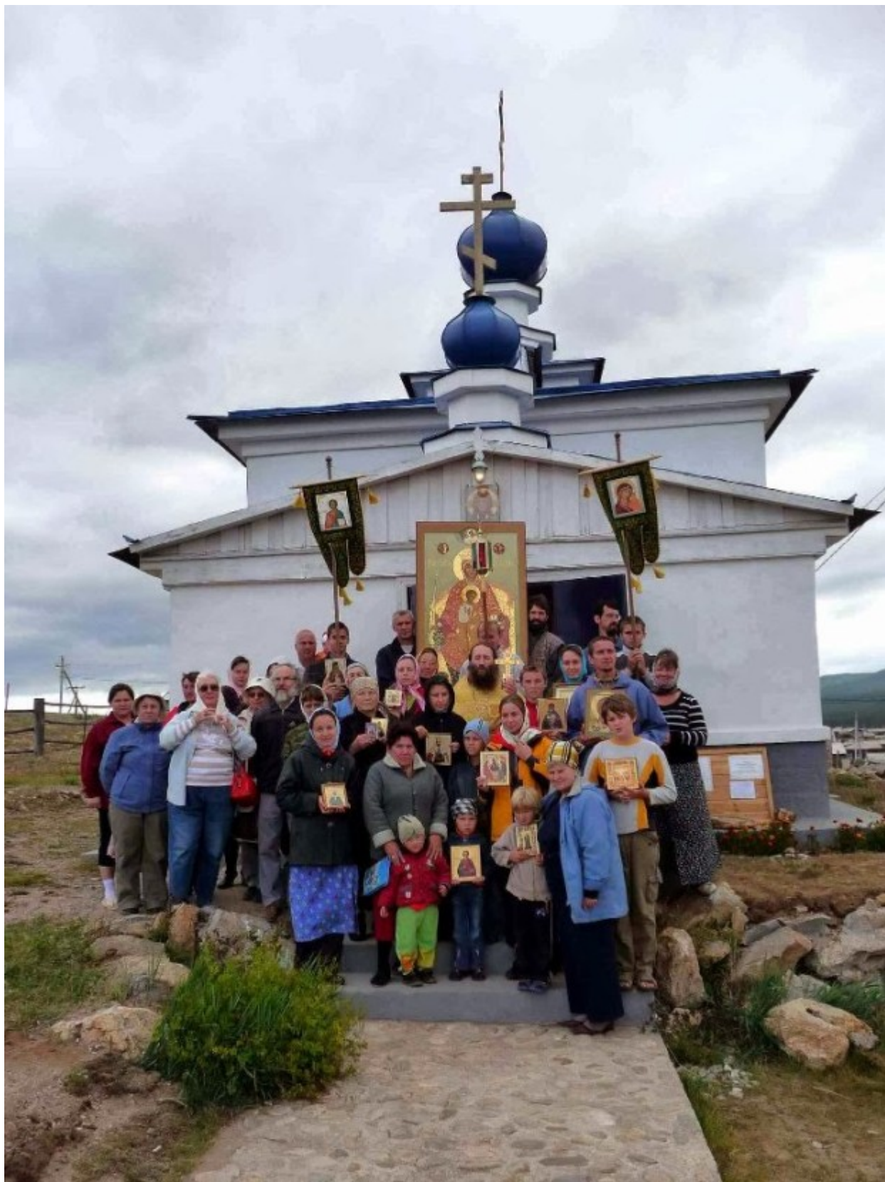
Η μοναδική εκκλησία στο νησί Ολχόν της Βαϊκάλης

Η Βαϊκάλη είναι λίμνη που βρίσκεται στη νότια Σιβηρία κοντά στην πόλη του Ιρκούτσκ. Είναι η βαθύτερη και παλαιότερη λίμνη στον κόσμο, καθώς επίσης και η λίμνη με τον μεγαλύτερο όγκο γλυκού νερού. Περιέχει πάνω από ένα πέμπτο του γλυκού νερού παγκοσμίως και περισσότερο από 90% του γλυκού νερού της Ρωσίας.