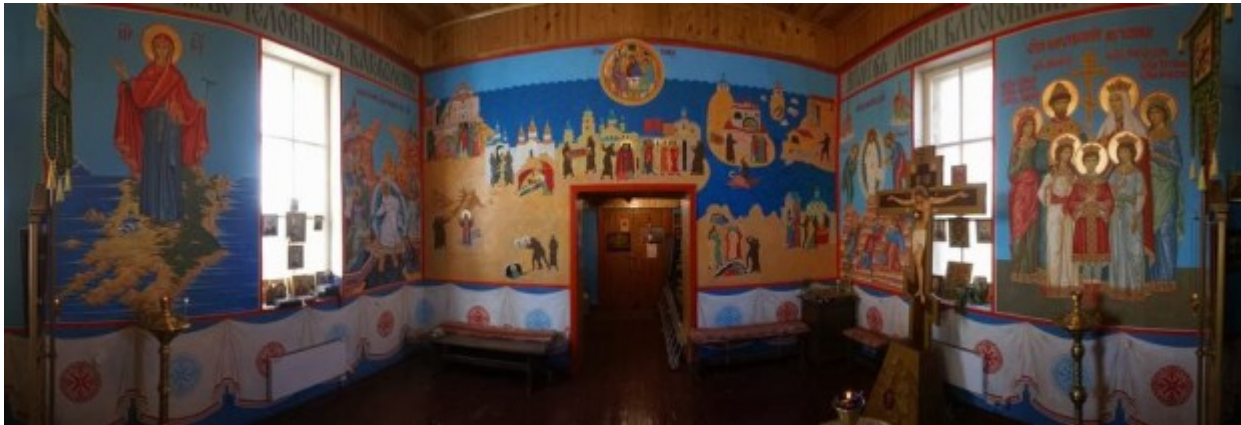
Η μεγάλη τοιχογραφία αριστερά απεικονίζει την Θεοτόκο, Έφορο του Ολχόν Βαϊκάλης