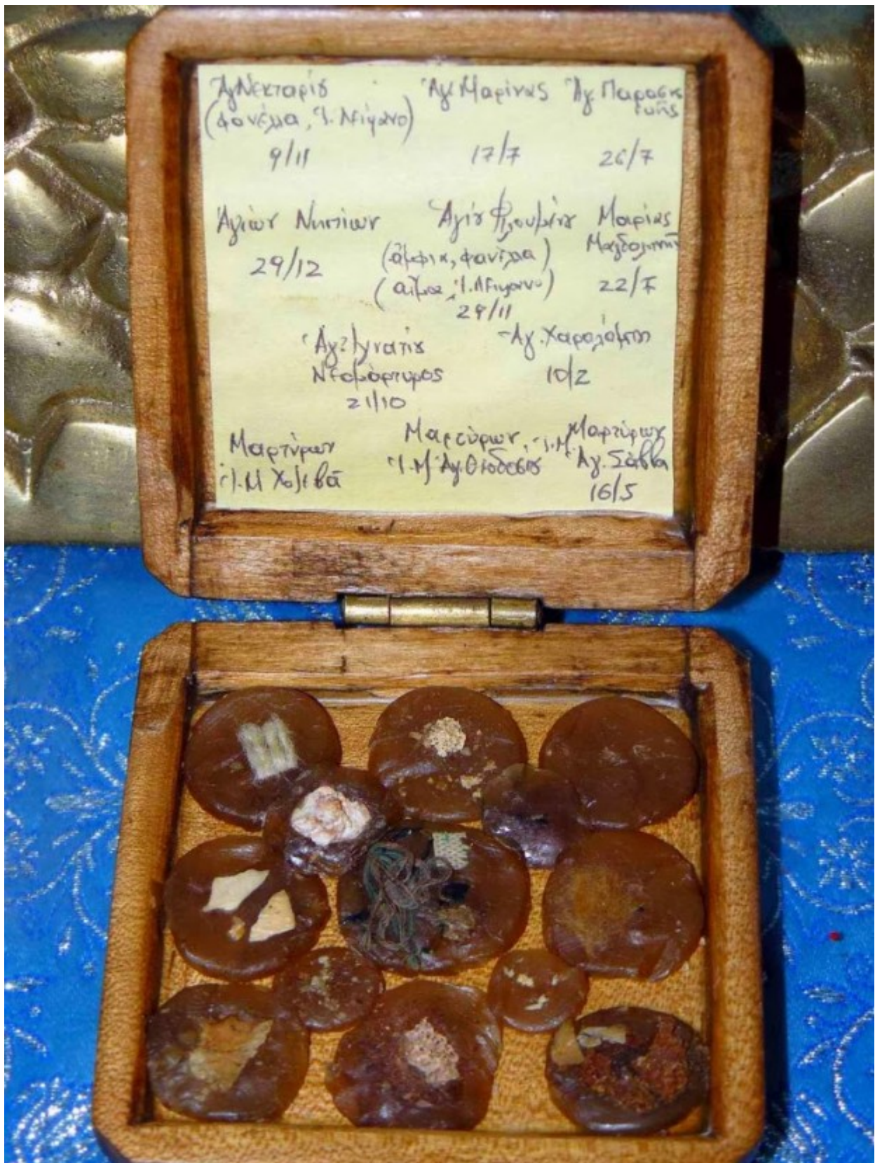
Η ξύλινη λειψανοθήκη με τα λείψανα