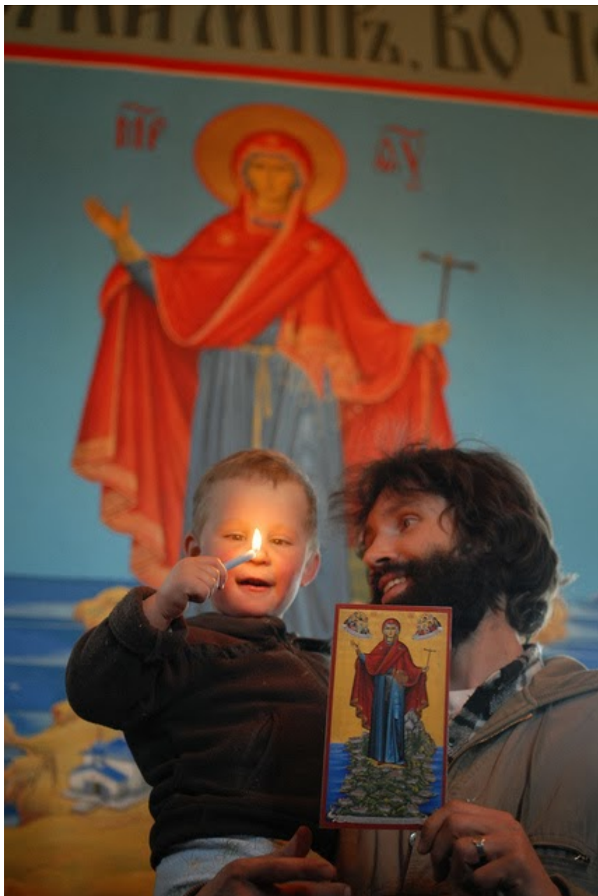
Η Θεοτόκος, Έφορος του Αγίου Όρους (η μικρή εικόνα) και η Θεοτόκος, Έφορος του Ολχόν Βαϊκάλης (η τοιχογραφία)

αυτά τα προσκυνηματικά τους ταξίδια είδαν την εικόνα της Θεοτόκου Εφόρου του Αγίου Όρους, στην οποία η Θεοτόκος πατάει πάνω στο περιβόλι της, το Άγιον Όρος, και τόσο την άρεσαν που έφτιαξαν μία παρόμοια για την εκκλησία τους (εικόνα και τοιχογραφία) να την προσκυνούν, μόνο που στη δική τους εικόνα, η Θεοτόκος πατάει πάνω στο νησί τους.