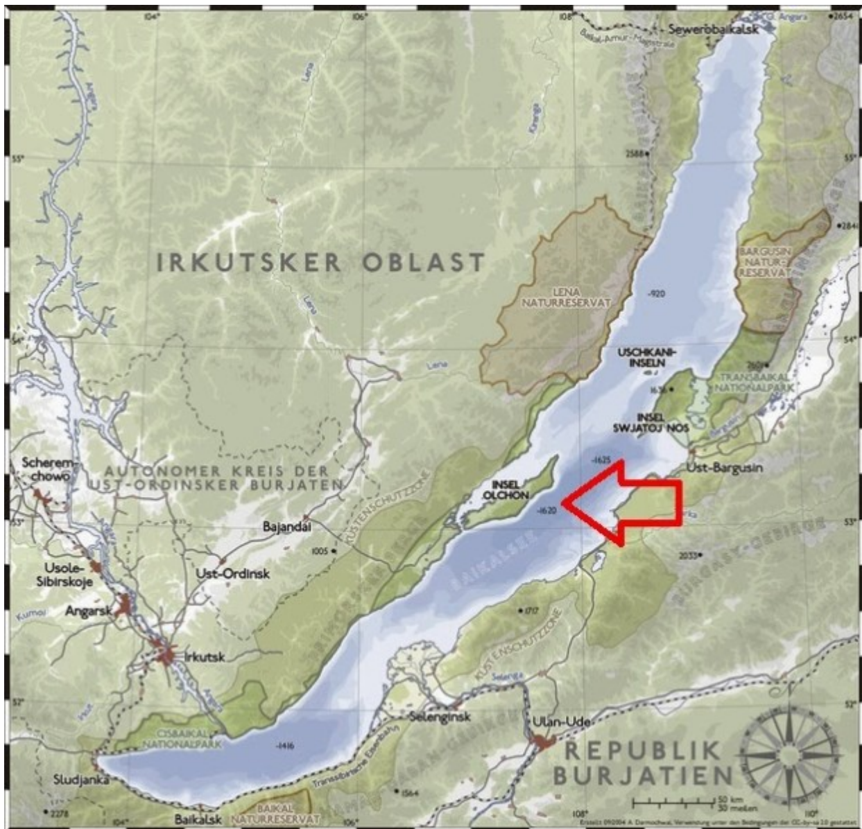
Το νησί Ολχόν της Βαϊκάλης (από γερμανικό χάρτη)

Στη μέση της λίμνης βρίσκεται το νησί Ολχόν με μήκος 71,5 χλμ. και πλάτος 20,8 χλμ. Ο πληθυσμός του νησιού δεν ξεπερνά τα 1500 άτομα, κατά κύριο λόγο ιθαγενείς ψαράδες και αγρότες, που ζουν σε 5 χωριά ή και σε μικρότερους οικισμούς. Οι κάτοικοι του νησιού είναι κατά κύριο λόγο σαμανιστές, αλλά υπάρχει και μία (και μοναδική) Ρώσικη Ορθόδοξη εκκλησία.