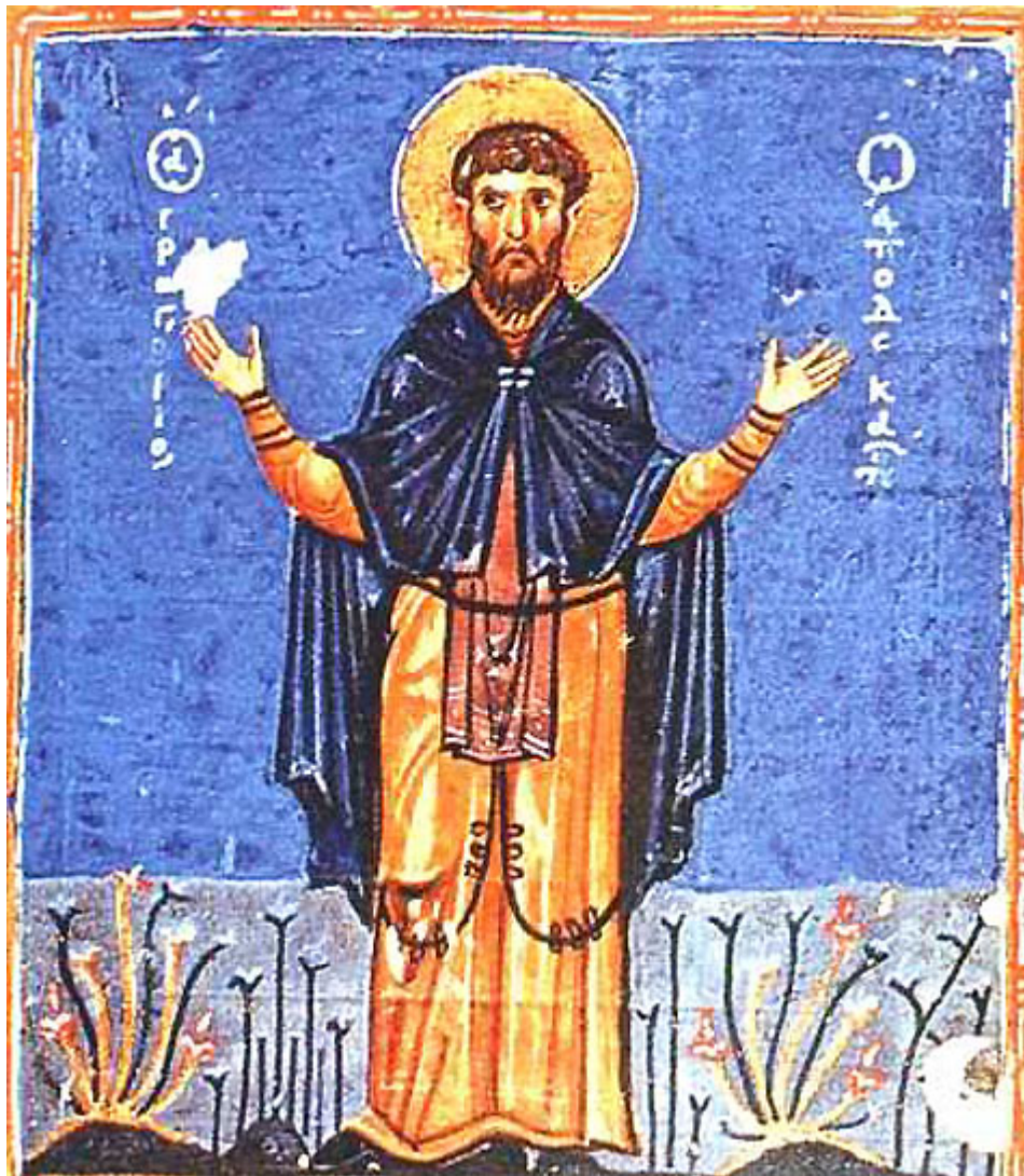
Όσιος Γρηγόριος ο Δεκαπολίτης