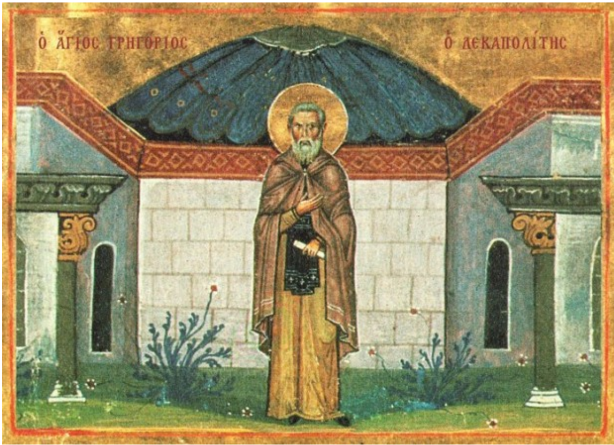
Όσιος Γρηγόριος ο Δεκαπολίτης

Εορτάζει στις 20 Νοεμβρίου εκάστου έτους.