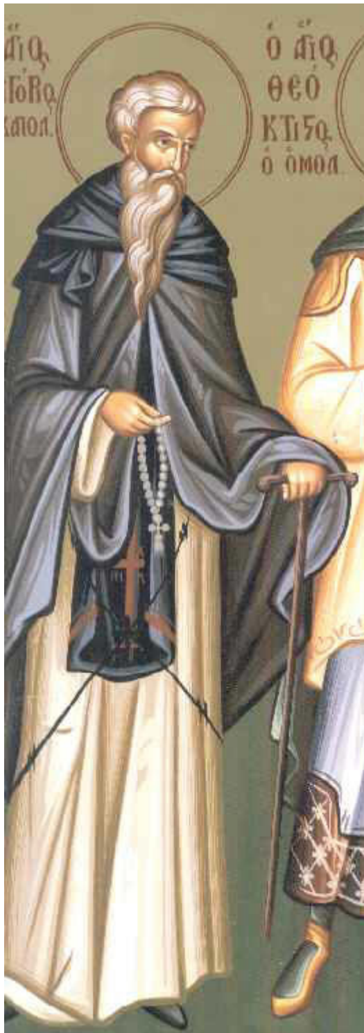
Όσιος Γρηγόριος ο Δεκαπολίτης