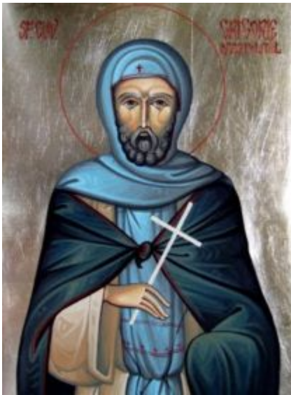
Όσιος Γρηγόριος ο Δεκαπολίτης

Τη θεία λαμπρότητι, καταυγαζόμενος, το σκότος εδίωξας, των ψυχοφθόρων παθών, Γρηγόριε αίδιμε, ήρθης προς απαθείας, καθαρώτατον ύψος, ήστραψας παραδόξως, ιαμάτων ακτίνας, σκηνώσας εις άδυτον φως, της βασιλείας Χριστού.