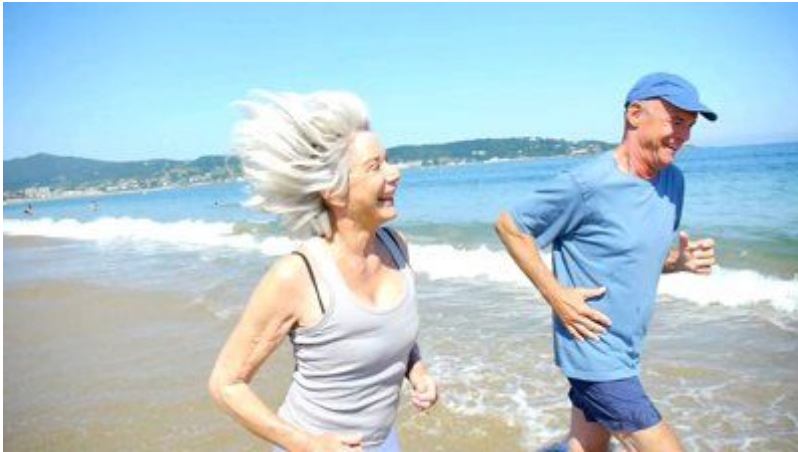
Η άσκηση είναι σημαντική για τον έλεγχο της χοληστερόλης.

υιοθέτηση υγιεινών αλλαγών στον τρόπο ζωής για καλύτερα αποτελέσματα στον έλεγχο της χοληστερόλης.