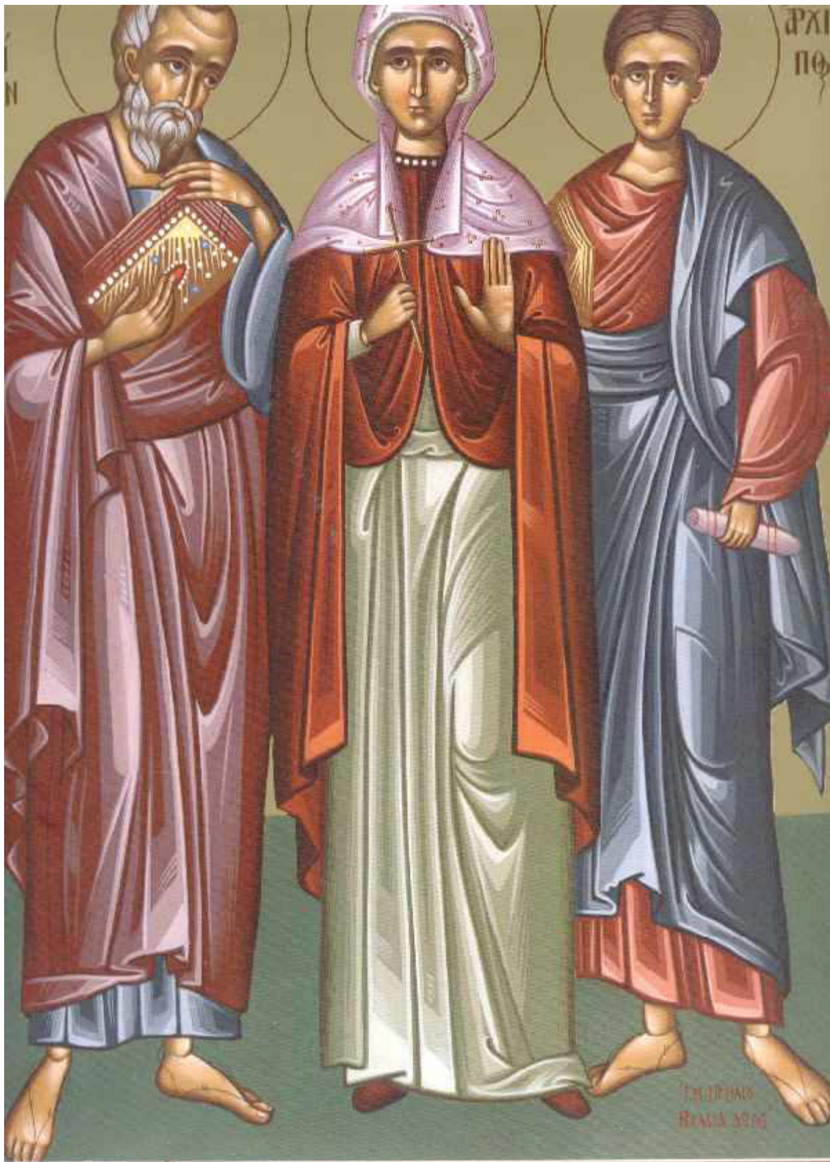
Άγιοι Φιλήμων ο Απόστολος, Αρχιππος, Ονήσιμος και Αφία

Ο Άγιος Ονήσιμος ο Απόστολος μαθητής του Αποστόλου Παύλου