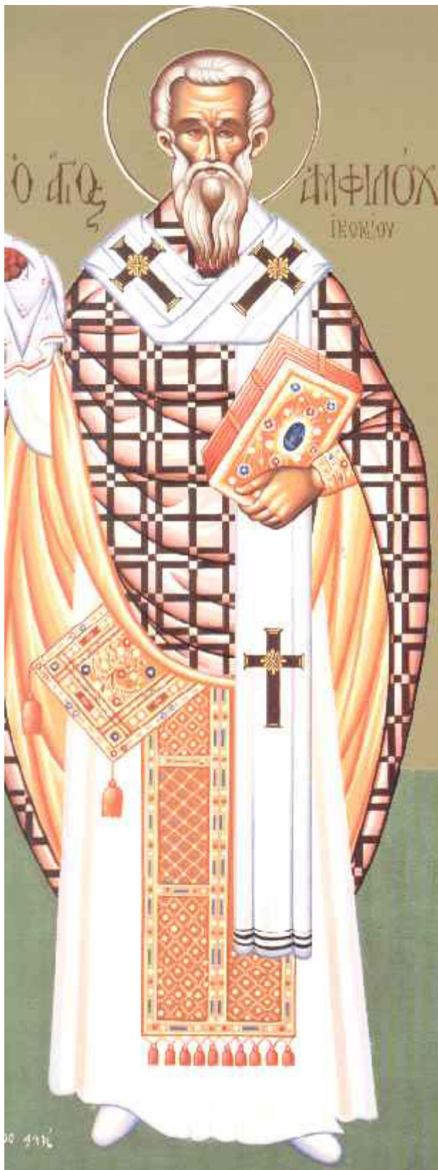
Άγιος Αμφιλόχιος Επίσκοπος Ικονίου