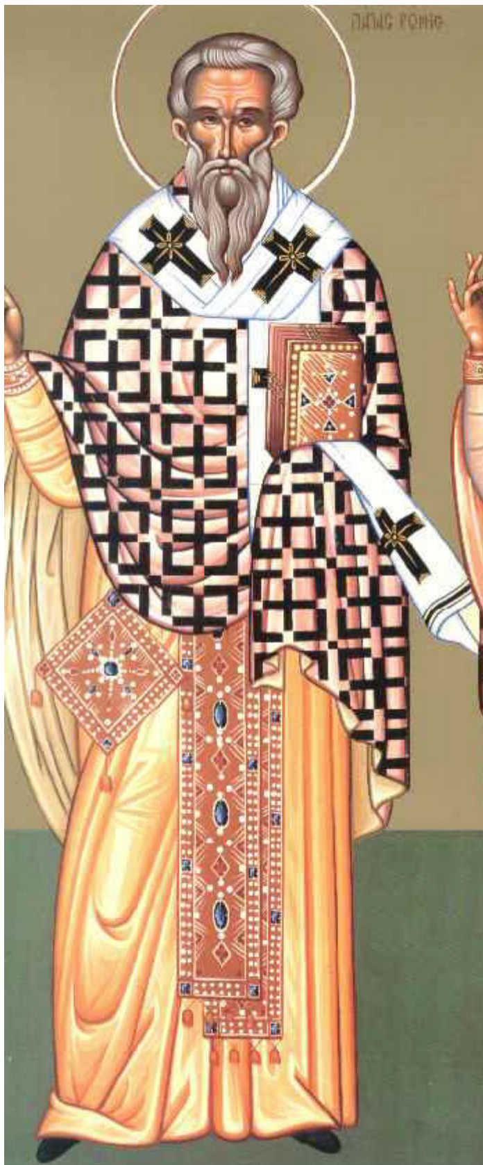
Άγιος Κλήμης Ιερομάρτυρας, επίσκοπος Ρώμης