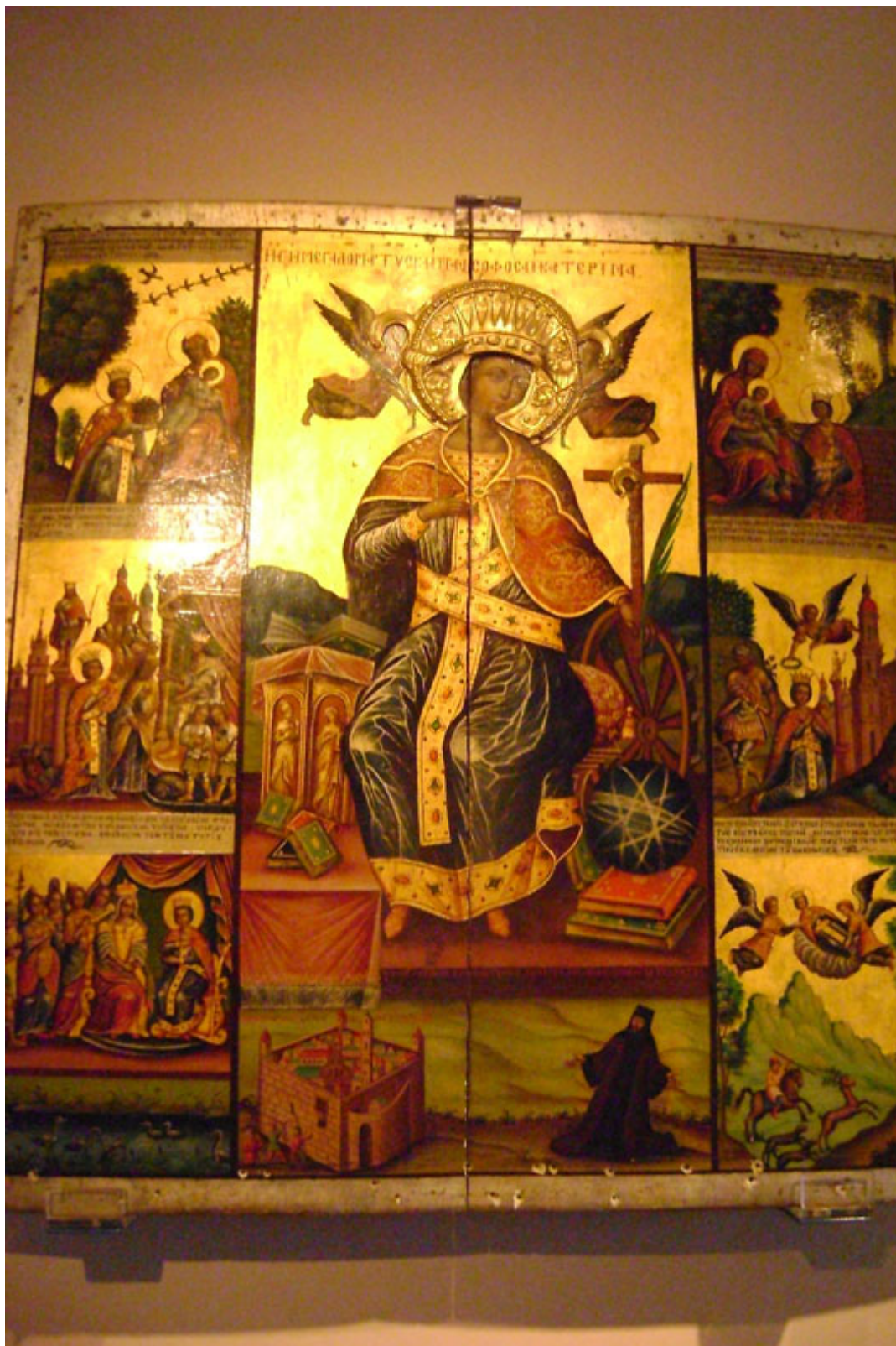
Ἁγία Αἰκατερίνη (Σινά)