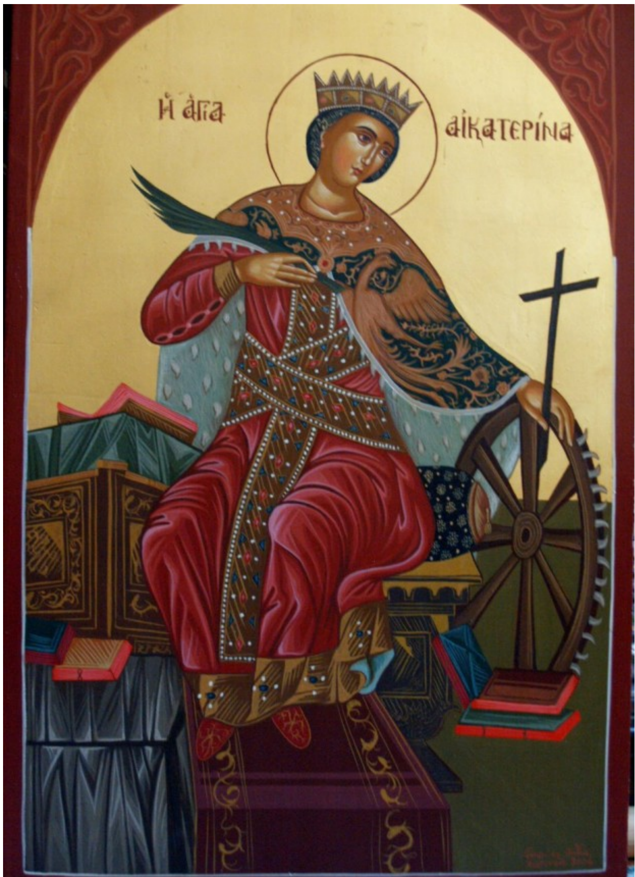
Αγία Αικατερίνη - Λυδία Γουριώτη© ( http://lydiagourioti-iconography.blogspot.com )