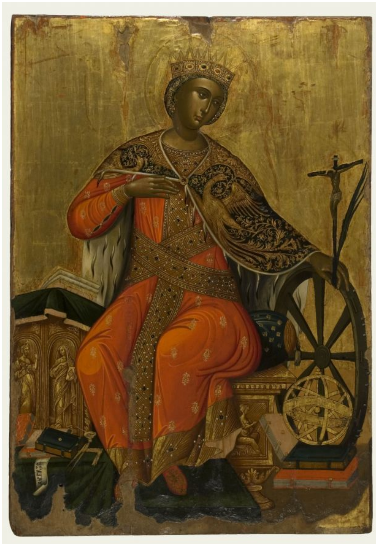
Αγία Αικατερίνη - Βίκτωρ - Β΄ μισό 17ου αιώνα μ.Χ. Από τη Messina - Αθήνα, Βυζαντινό και Χριστιανικό Μουσείο