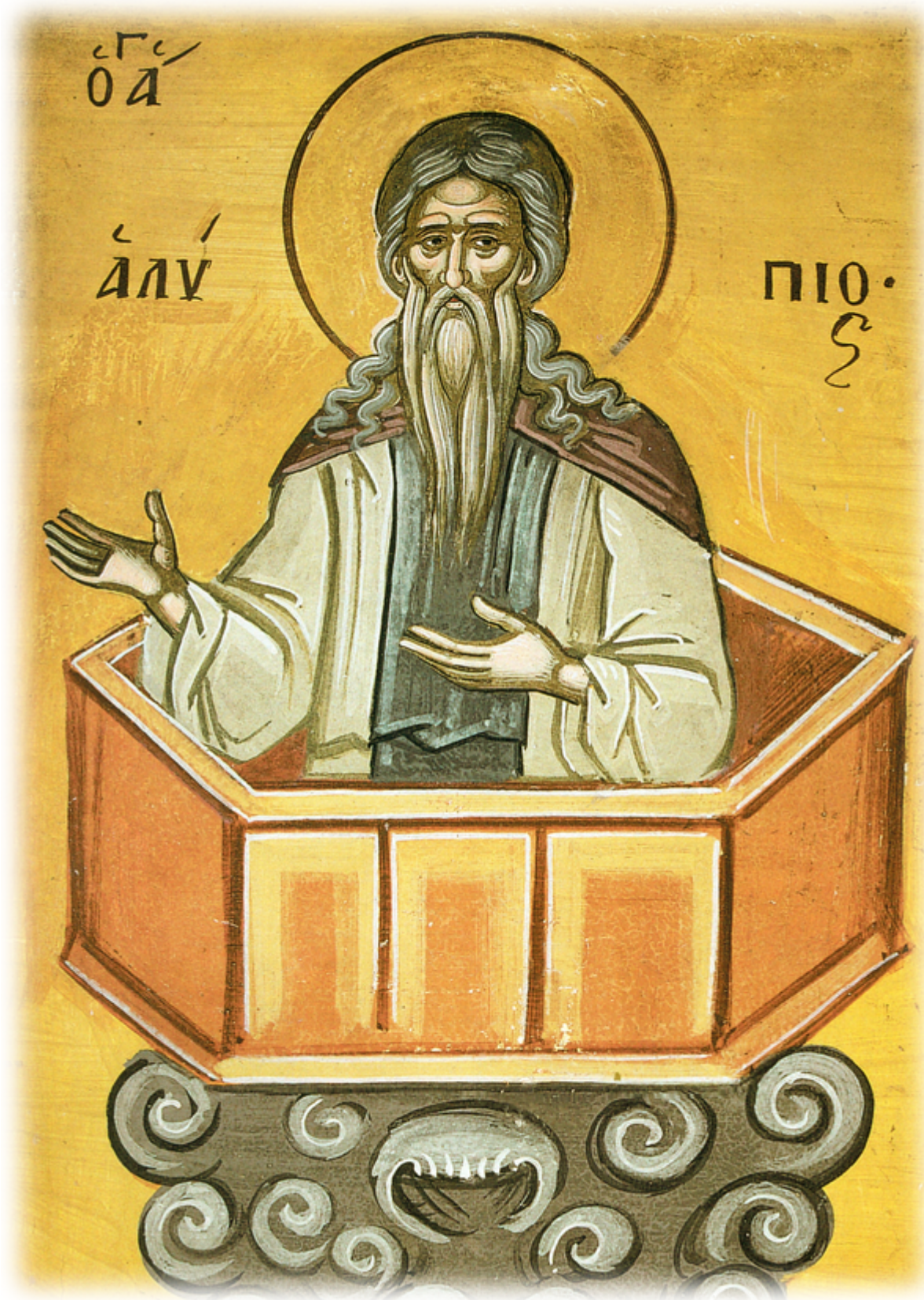
Όσιος Αλύπιος ο Κιονίτης

Εορτάζει στις 26 Νοεμβρίου εκάστου έτους.