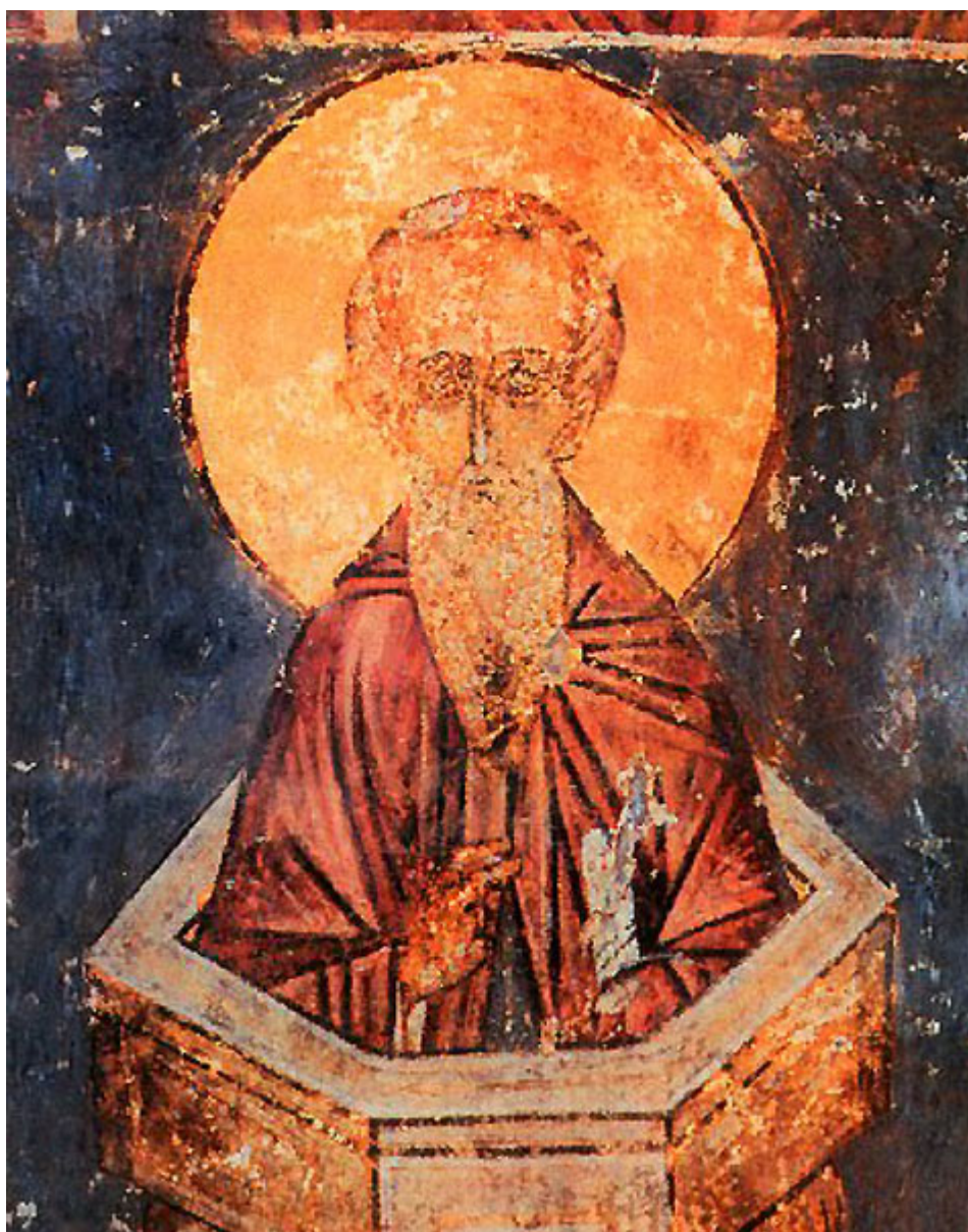
Όσιος Αλύπιος ο Κιονίτης

της λαμπρότητας του με την οποία επρόκειτο να φωτίσει κόσμο πολύ, με τον θαυμάσιο βίο του. Και πάλιν όταν τον γέννησε είδε άλλο όραμα. Είδε ότι συνάχθηκε όλη η πολιτεία και με υμνωδίες και ιερά άσματα τον προσκύνησαν με πολλή ευλάβεια. Όταν ήταν τριών ετών και τελείωσε ο θηλασμός του βρέφους, απέθανε ο πατέρας του. Η μητέρα του από τα οράματα εκείνα και από τα άλλα σημεία εννόησε βαθειά, ότι το παιδί της έμελλε να γίνει δούλος γνήσιος του Θεού. Το πήγε, λοιπόν, και το παρέδωσε στην Εκκλησία, στα χέρια του Αρχιερέως Θεοδώρου.