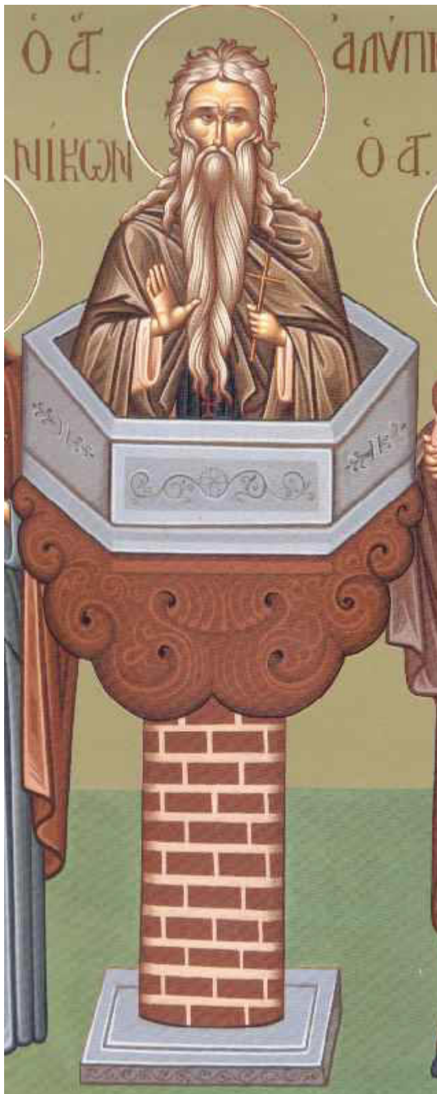
Όσιος Αλύπιος ο Κιονίτης