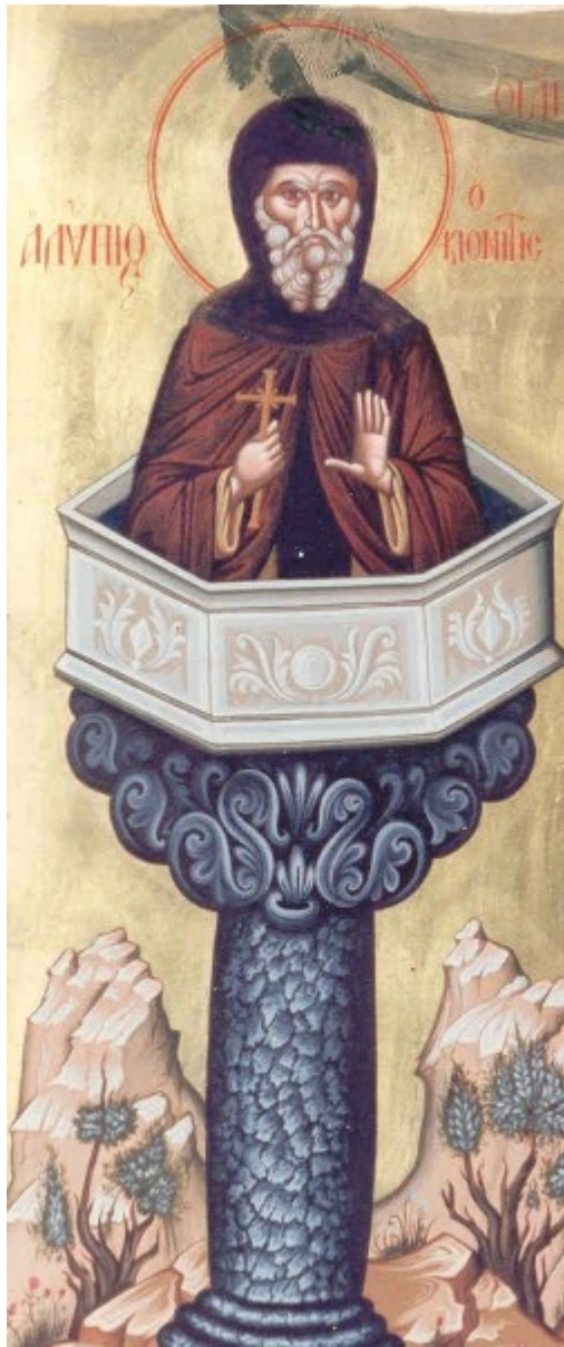
Όσιος Αλύπιος ο Κιονίτης