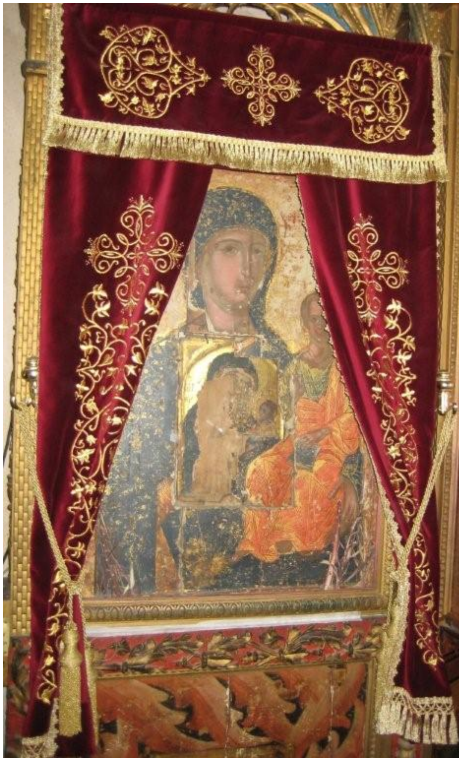
Από την Ιερά Μονή

Παναγίας Αμιρούς ανακοινώνεται ότι με την ευκαιρία της εορτής Αγίας Μεγαλομάρτυρος Αικατερίνης της Πανσόφου την Κυριακή 24 Νοεμβρίου και ώρα 4.30μ.μ, θα τελεσθεί πανηγυρικός εσπερινός χοροστατούντος του Πανιερωτάτου