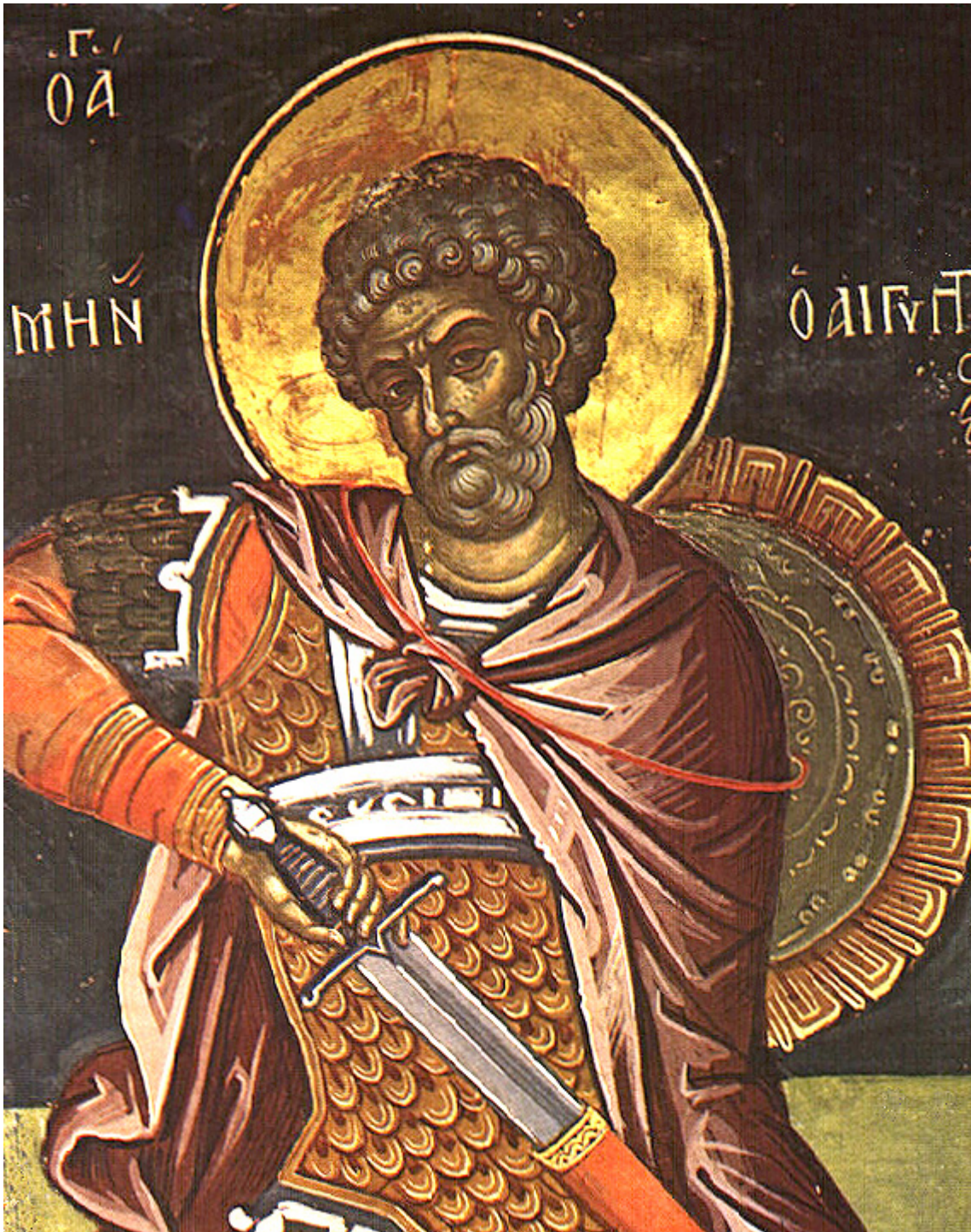
Άγιος Μηνάς ο Καλλικέλαδος

Χριστώ τω Θεώ, των παισμάτων άφεσιν δωρήσασθαι, τοις εορτάζουσι πόθω, την αγίαν μνήμην υμών.