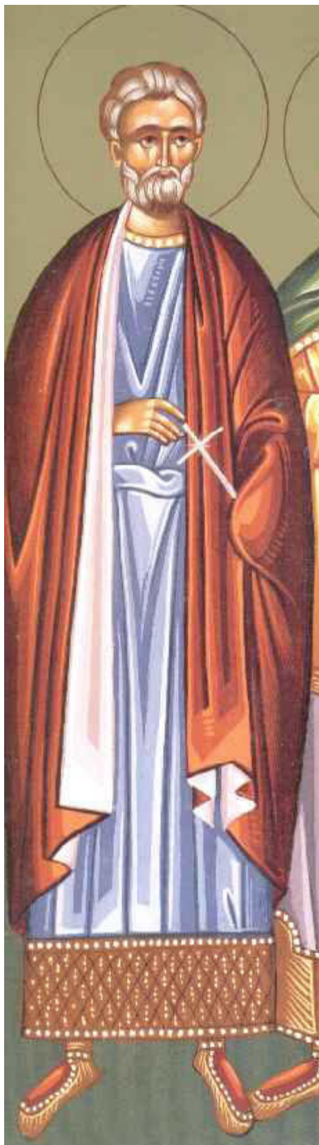
Άγιος Μηνάς ο Καλλικέλαδος