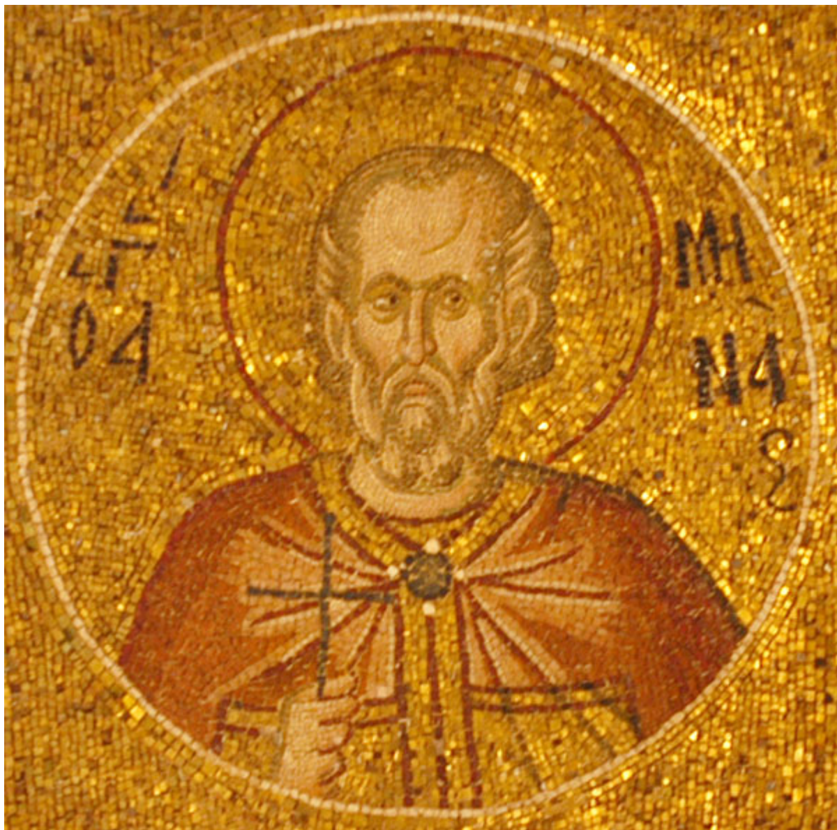
Άγιος Μηνάς ο Καλλικέλαδος