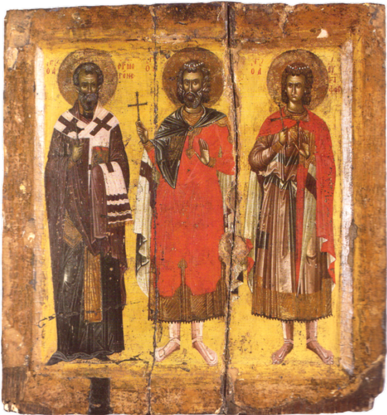
Άγιοι Μηνάς ο Καλλικέλαδος, Ερμογένης και Εύγραφος