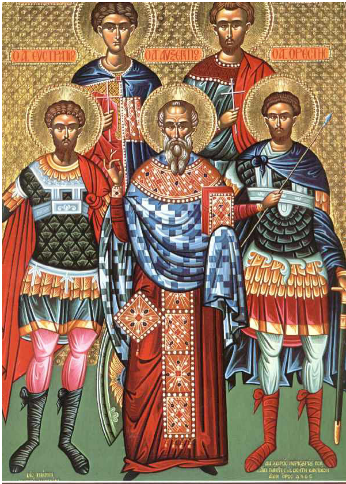
Οι Άγιοι Ευστράτιος, Αυξέντιος, Ευγένιος, Μαρδάριος και Ορέστης