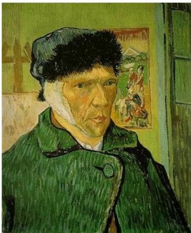
Βίνσεντ Βαν Γκογκ