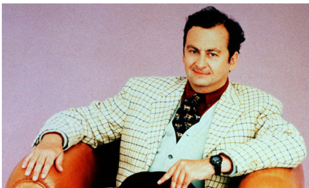
Ζαν Ντομινίκ Μπομπί

Οι πράκτορες τον κυνηγούσαν σαν επίμονες σκιές. Εισχωρούσαν στο μυαλό του και δημιουργούσαν καταστάσεις φόβου και παράνοιας. Όταν ο Τζον Νας δραπέτευε από τον σαγηνευτικό κόσμο των αριθμών εγκλειόταν στις θεωρίες συνωμοσίας που τον κατάτρυχαν. Ο Αμερικανός μαθηματικός, που κέρδισε το βραβείο Νόμπελ στα οικονομικά το 1994 για τα μεγαλοφυή θεωρήματα που απέδειξε στη «Θεωρία των Παιγνίων», αντιμετώπιστηκε ως διάνοια από μικρή ηλικία όταν παρουσίαζε λύσεις σε θεωρήματα των μαθηματικών που θεωρούνται πολύπλοκα. Το 1959 και ενώ βρισκόταν στο αποκορύφωμα της δημιουργικότητας του άρχισαν να τον τυλίγουν οι ακουστικές ψευδαισθήσεις. Απόκοσμοι θόρυβοι, φθονερές σκιές Ρώσων και Αμερικανών πρακτόρων δυνάστευαν την ύπαρξη του και τον οδήγησαν σε εγκλεισμό σε ψυχιατρικά ιδρύματα για τα επόμενα 40 χρόνια. Υποβλήθηκε σε θεραπείες ηλεκτροσόκ και παρά τα αλλεπάλληλα επεισόδια ψύχωσης εξακολούθησε να εργάζεται ως μαθηματικός. Τα τελευταία χρόνια δίδασκε στο πανεπιστήμιο Πρίνστον, όπου απολαμβάνει του σεβασμού και της εκτίμησης της κοινότητας, ιδίως έπειτα από την προβολή της ταινίας «Ένα όμορφο μυαλό» με τον Ράσελ Κρόου να τον υποδύεται στον πρωταγωνιστικό ρόλο.