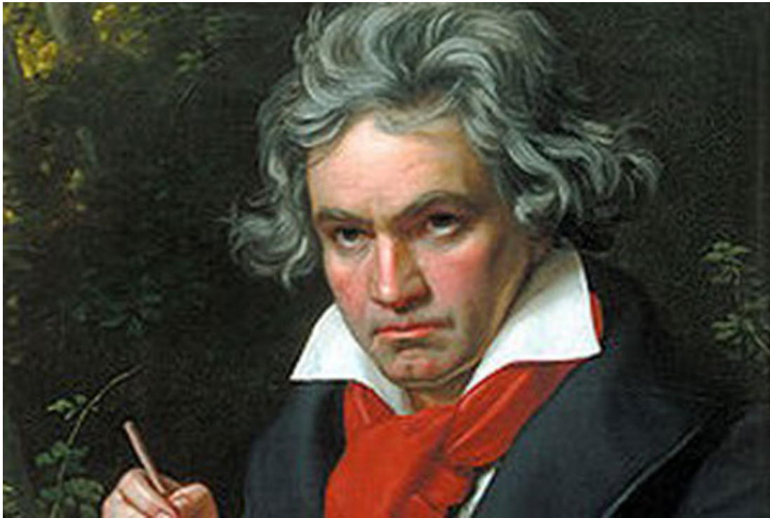
Λούντβιχ Βαν Μπετόβεν

από ανευόδωτο έρωτα. Με την τέχνη του κατάφερε να υπομείνει και να κάνει δικό του τον τόσο ξένο κόσμο που κινείτο. Η πολυώδυνη πορεία ζωής του σφραγίστηκε στις 29 Ιουλίου του 1890 με μερικές λέξεις. «Η λύπη θα κρατήσει για πάντα!»»