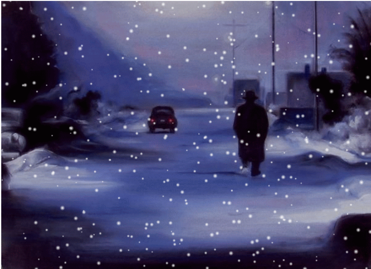
πίνακας ζωγραφικής δια χειρός Ελένης Κυριαζοπούλου