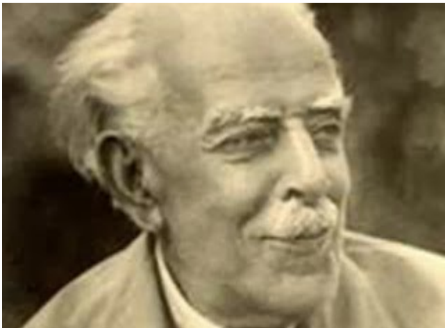
Γεώργιος Δροσίνης (1859 - 1951)

Από το 1914 ως το 1923 διετέλεσε τμηματάρχης Δημοτικής Εκπαίδευσης του Υπουργείου Παιδείας, συμβάλλοντας ουσιαστικά στη σύνταξη του Ιστορικού Λεξικού της Ελληνικής Γλώσσας και στην εφαρμογή του εκπαιδευτικού προγράμματος του Ελευθέριου Βενιζέλου . Το 1924, υπό τη διεύθυνσή του, οργανώθηκε το Μουσείο Κοσμητικών Τεχνών. Έγινε τακτικό μέλος της Ακαδημίας Αθηνών από την ίδρυσή της το 1926, διατέλεσε ο πρώτος Γραμματέας των Δημοσιευμάτων του Ιδρύματος (1926-1928) και τιμήθηκε με το Αριστείο των Γραμμάτων και Τεχνών .