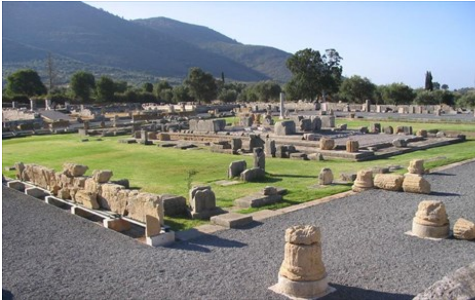
Το «Ασκληπείον» της Αρχαίας Μεσσήνης.

/ Ειδήσεις και Ανακοινώσεις / Επιστήμες, Τέχνες & Πολιτισμός