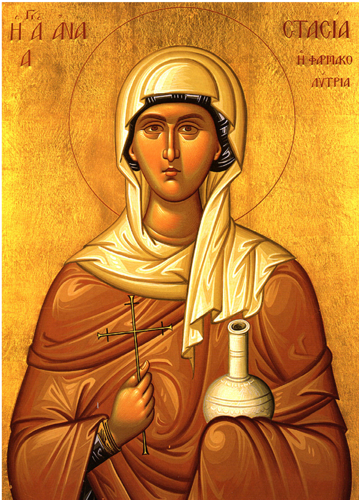
Ἁγία Ἀναστασία ἡ Φαρμακολύτρια