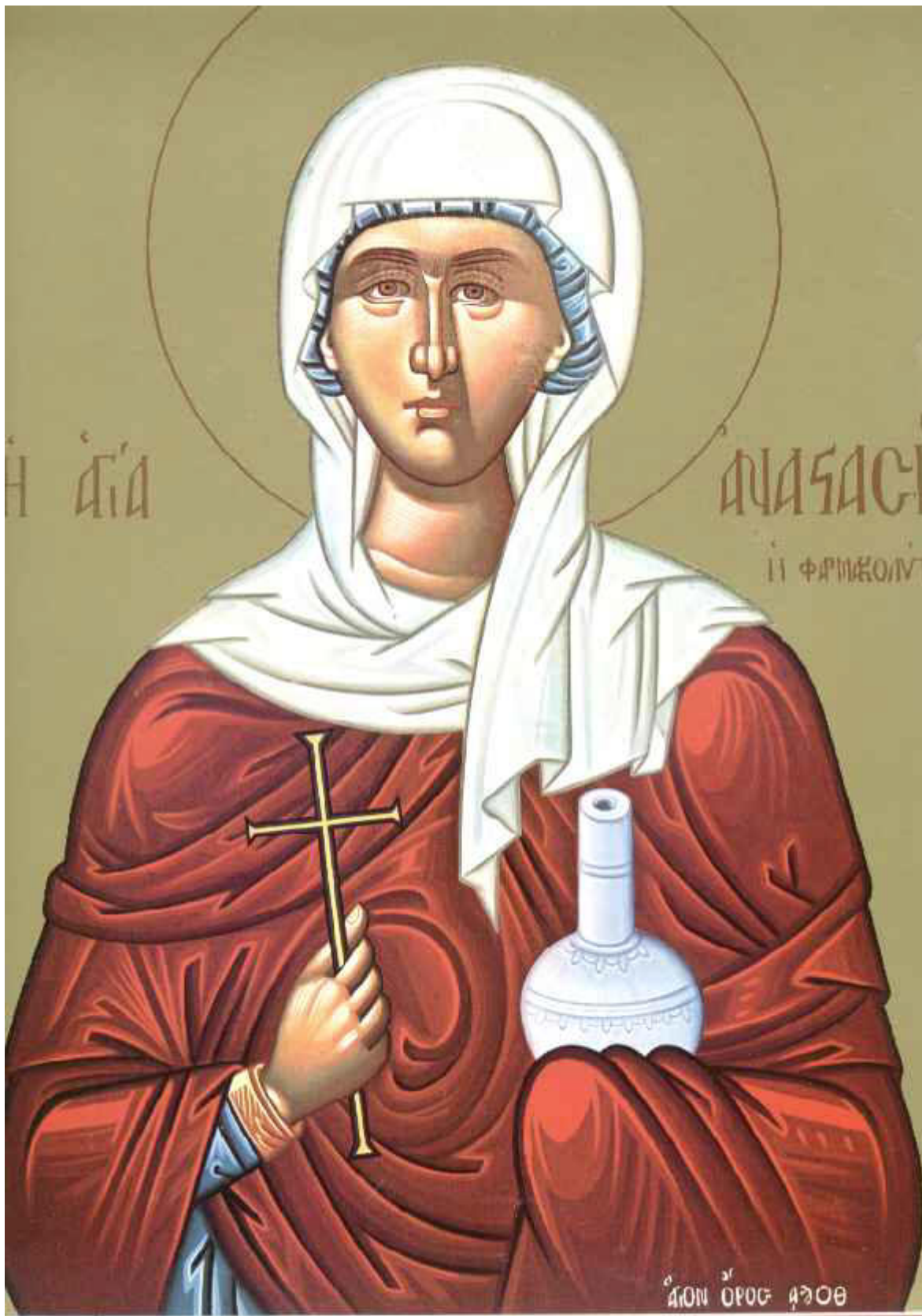
Αγία Αναστασία η Φαρμακούτρια