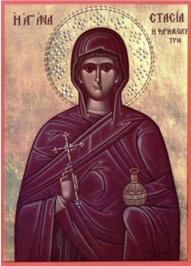
Αγία Αναστασία η Φαρμακολύτρια

Εορτάζει στις 22 Δεκεμβρίου εκάστου έτους.