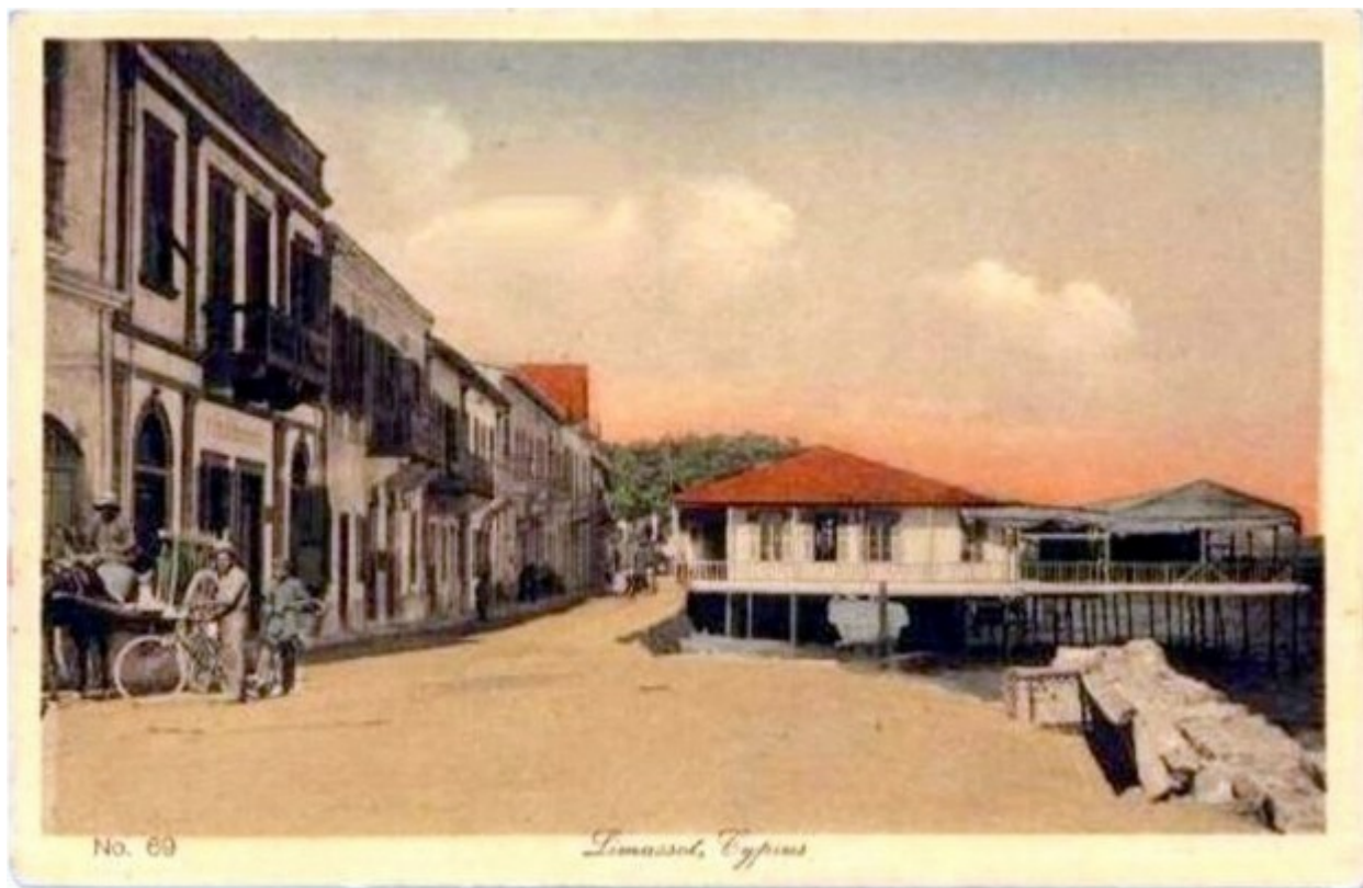
Ο παραλιακός μέχρι το Ακταίον πριν γίνει κατασκευαστεί μόλος την δεκαετία του 30

Την πρότασιν ταύτην του Δήμου. υπάρχει ελπίς ότι θα εγκρίνη η Κυβέρνησις, τοσούτω μάλλον όσω ελαχίστη σχετικώς θ' απαιτηθή δαπάνη προς κατασκευήν του μώλου. Ως προς δε το ποσόν των αποζημιώσεων, τάς οποίας θα πληρώση δια Κυβερνη-τικού δανείου ο Δήμος, τούτο κατά προχείρους υπολογισμούς δεν θα υπερβή τας 2 ½ -3 χιλ. λιρών.»