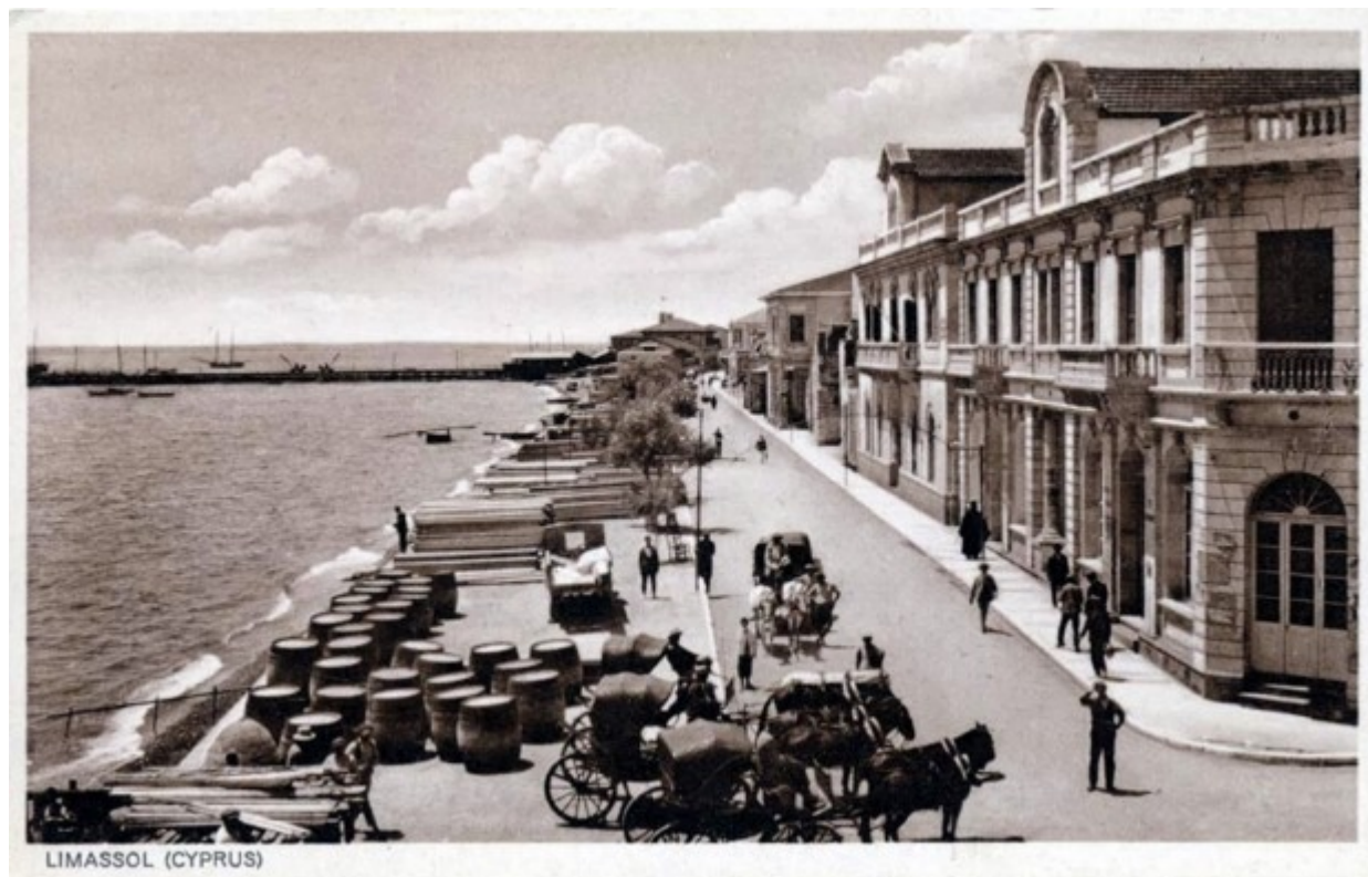
Ο μόλος που δημιουργήθηκε το 1914 και που για μερικά χρόνια ήταν αποθηκευτικός χώρος των εμπορευμάτων για εισαγωγές και εξαγωγές

αργότερα και θα δώσει τη βάση για ακόμη παραπέρα επεκτάσεις του μόλου, και τέλος την πλήρη κατεδάφιση όλων των παραλιακών κτισμάτων στα δημοτικά όρια, για να καταλήξουμε στη σημερινή ακτή Ολυμπίων.