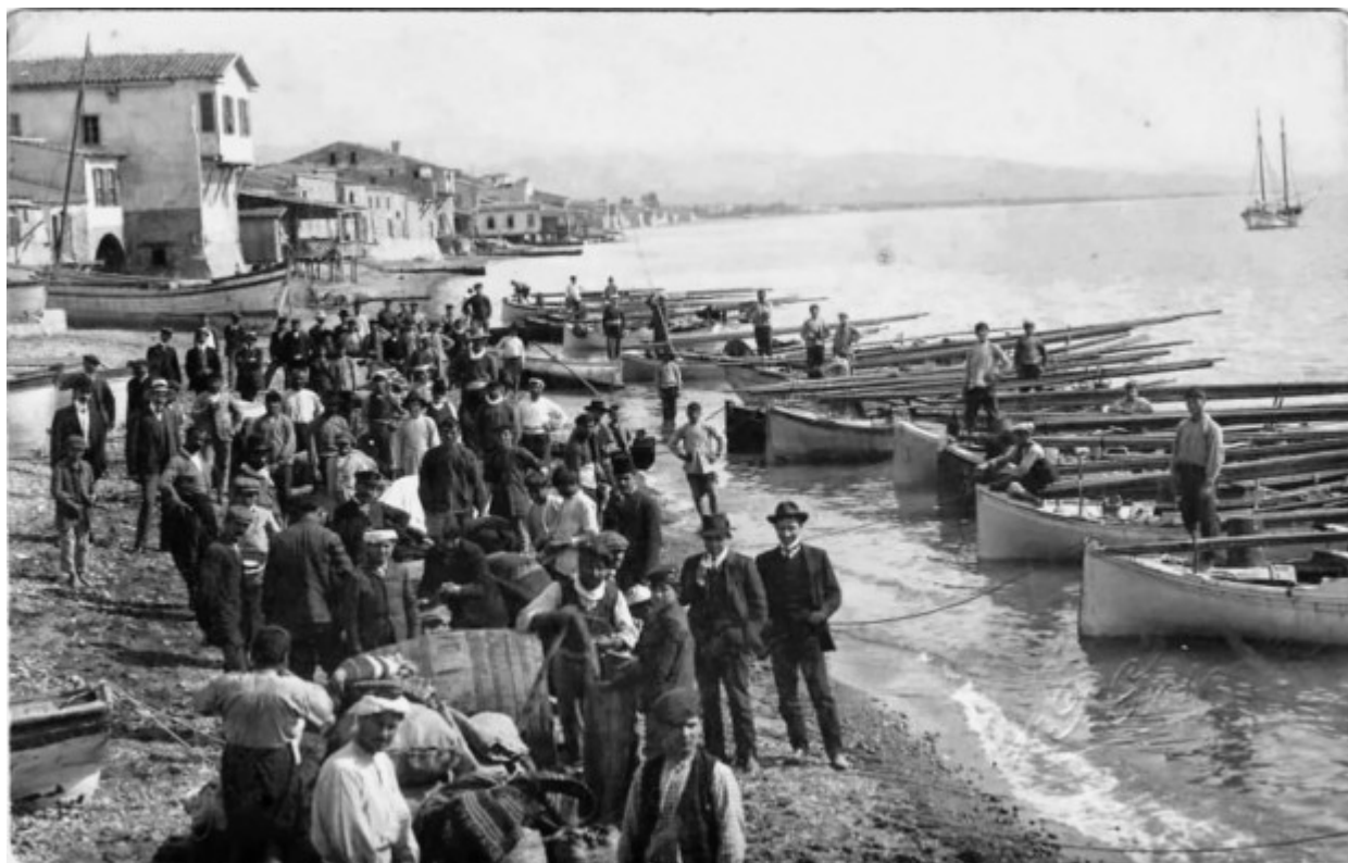
Ένα από τα ελάχιστα ανοίγματα επί της παραλίας, παραπλεύρως της μεγάλης αποβάθρας

Η εξελισσόμενη αστική δομή δημιουργεί επίσης πρόσθετες ανάγκες για προστασία από τη διάβρωση και τις φουρτούνες της θάλασσας.