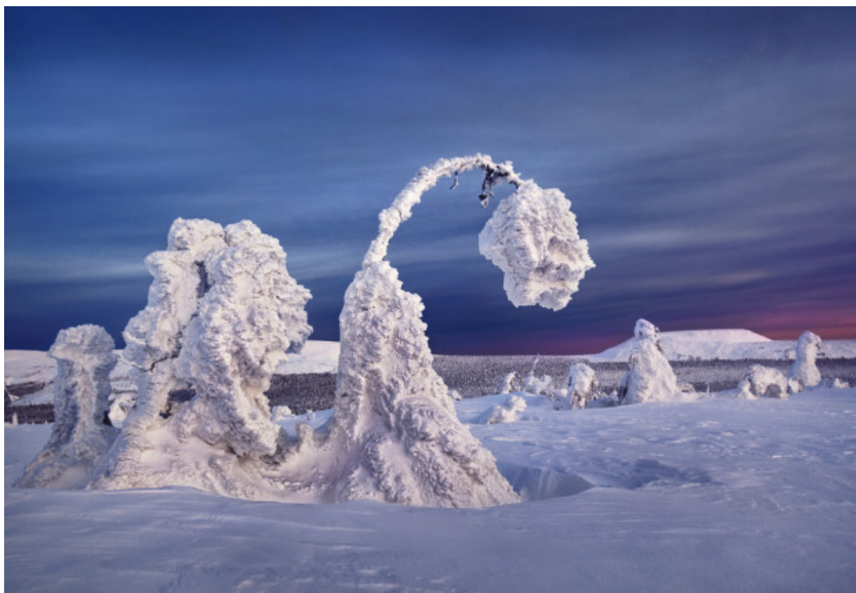
Υπάρχουν μέρη στη Ρωσία, με τόσο χαμηλές θερμοκρασίες που ακόμα και η βότκα παγώνει.