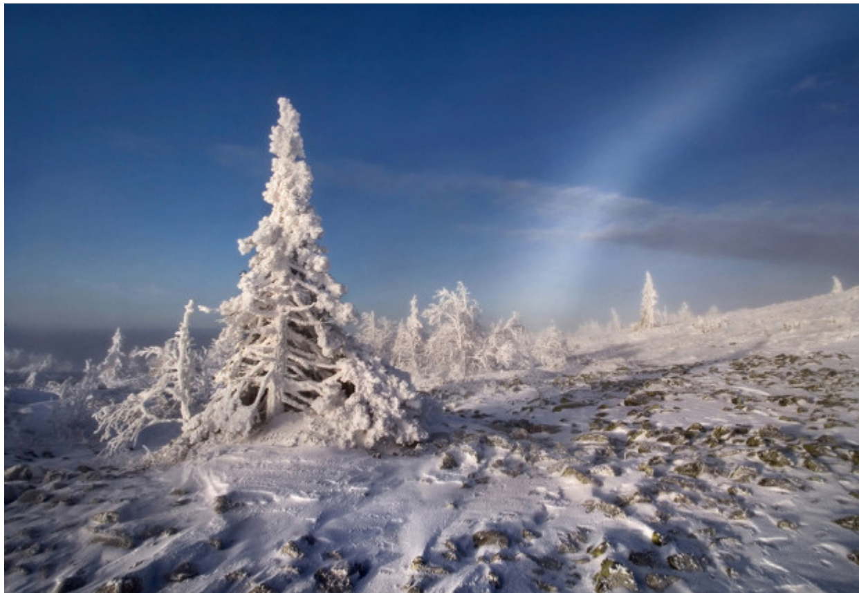
Η ομορφιά του τοπίου συμφιλιώνεται με το κρύο που το περιβάλλει, ενώ τα δυναμικά αθλήματα ζεσταίνουν το παγωμένο σώμα μέσα σε λίγα λεπτά.