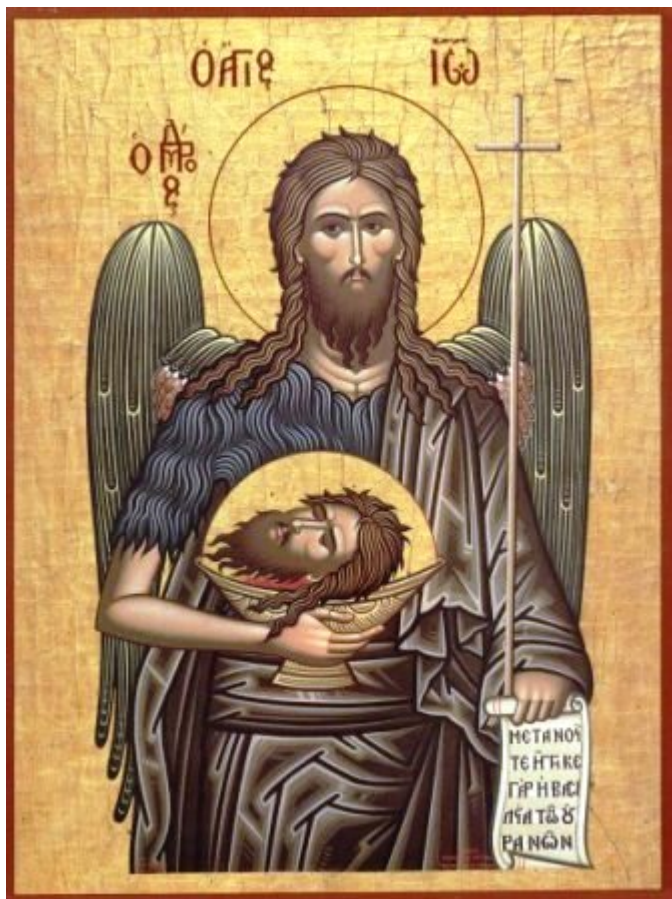
Άγιος Ιωάννης ο Πρόδρομος και Βαπτιστής