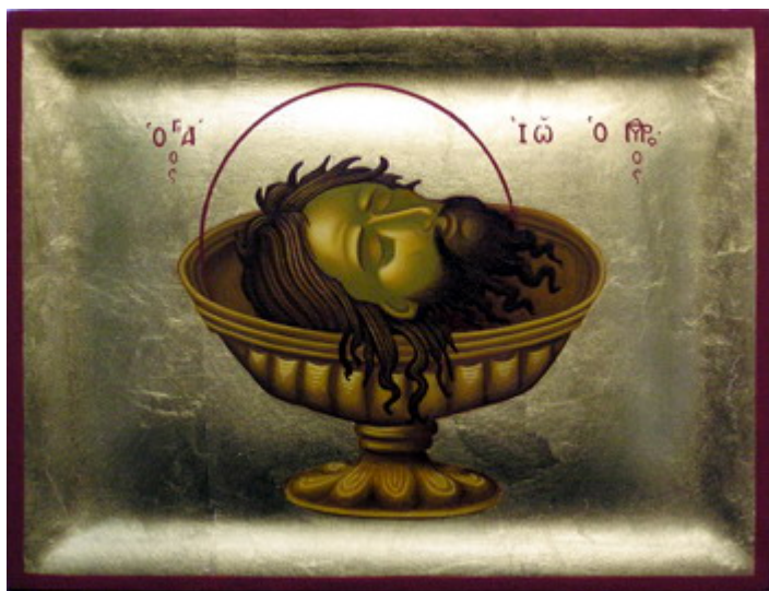
Άγιος Ιωάννης ο Πρόδρομος και Βαπτιστής