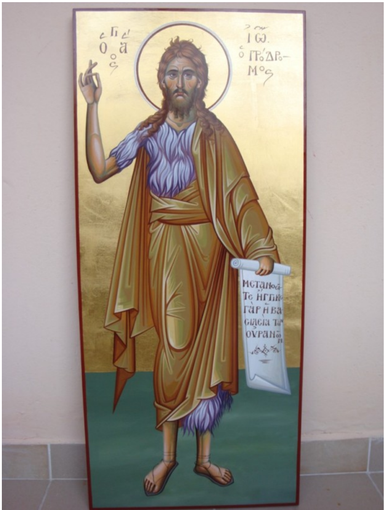
Άγιος Ιωάννης ο Πρόδρομος και Βαπτιστής - Σταύρος Τωνας© (ctonas-agiografies.blogspot.com)