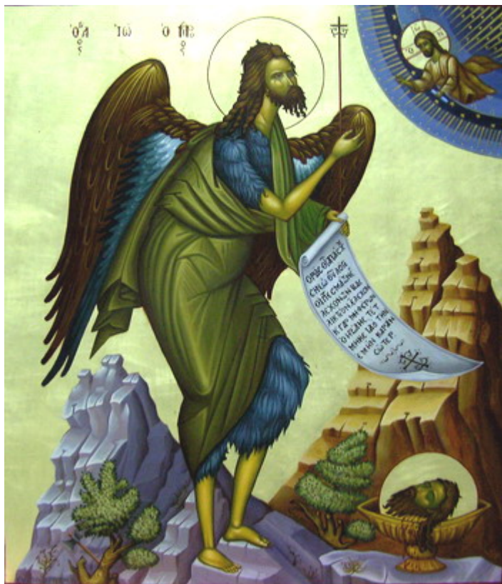
Άγιος Ιωάννης ο Πρόδρομος και Βαπτιστής