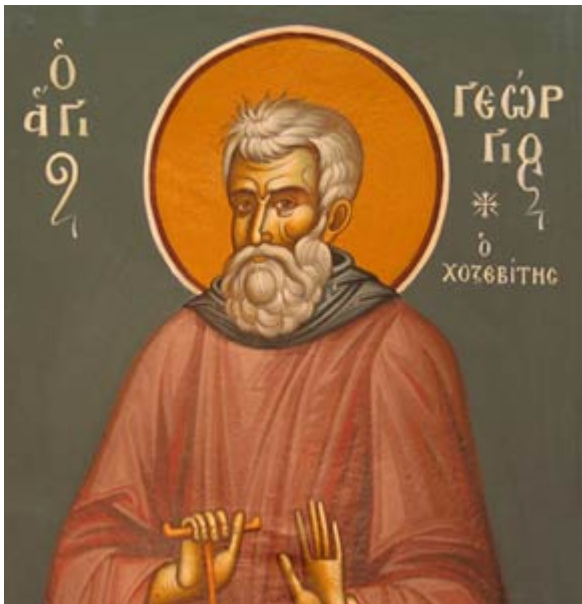
Όσιος Γεώργιος ο Χοζεβίτης

Εορτάζει στις 8 Ιανουαρίου εκάστου έτους.