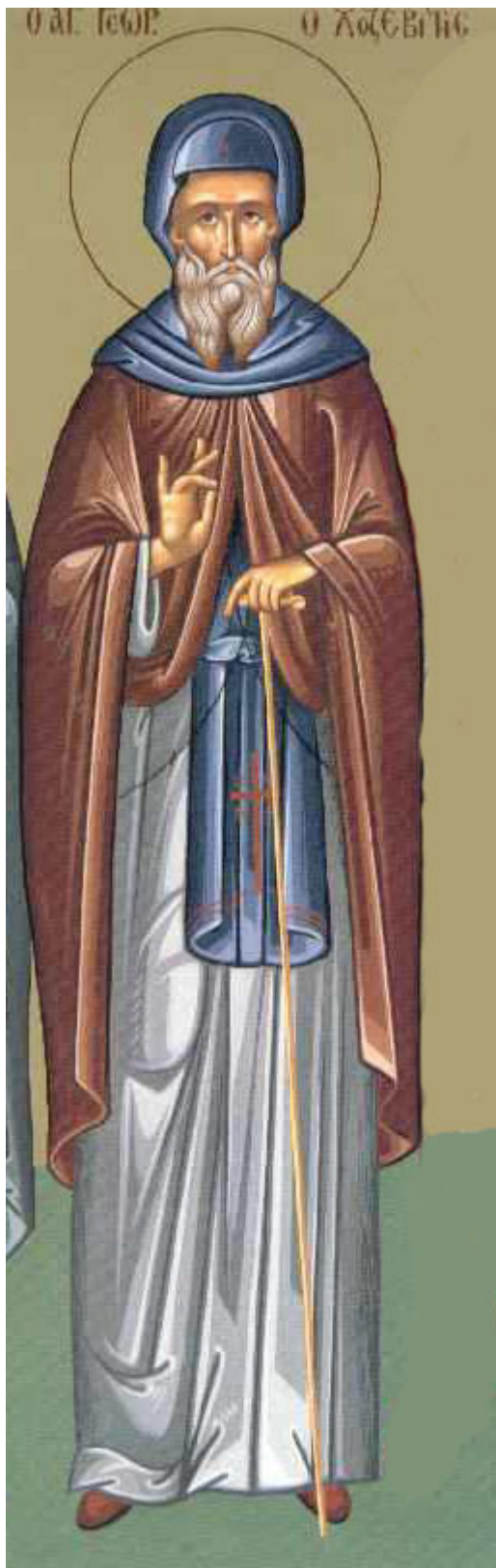
Όσιος Γεώργιος ο Χοζεβίτης