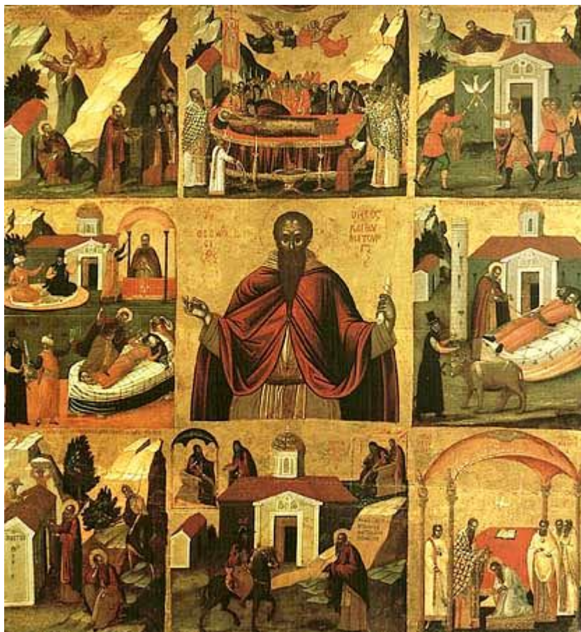
Όσιος Θεοδόσιος ο κοινοβιάρχης