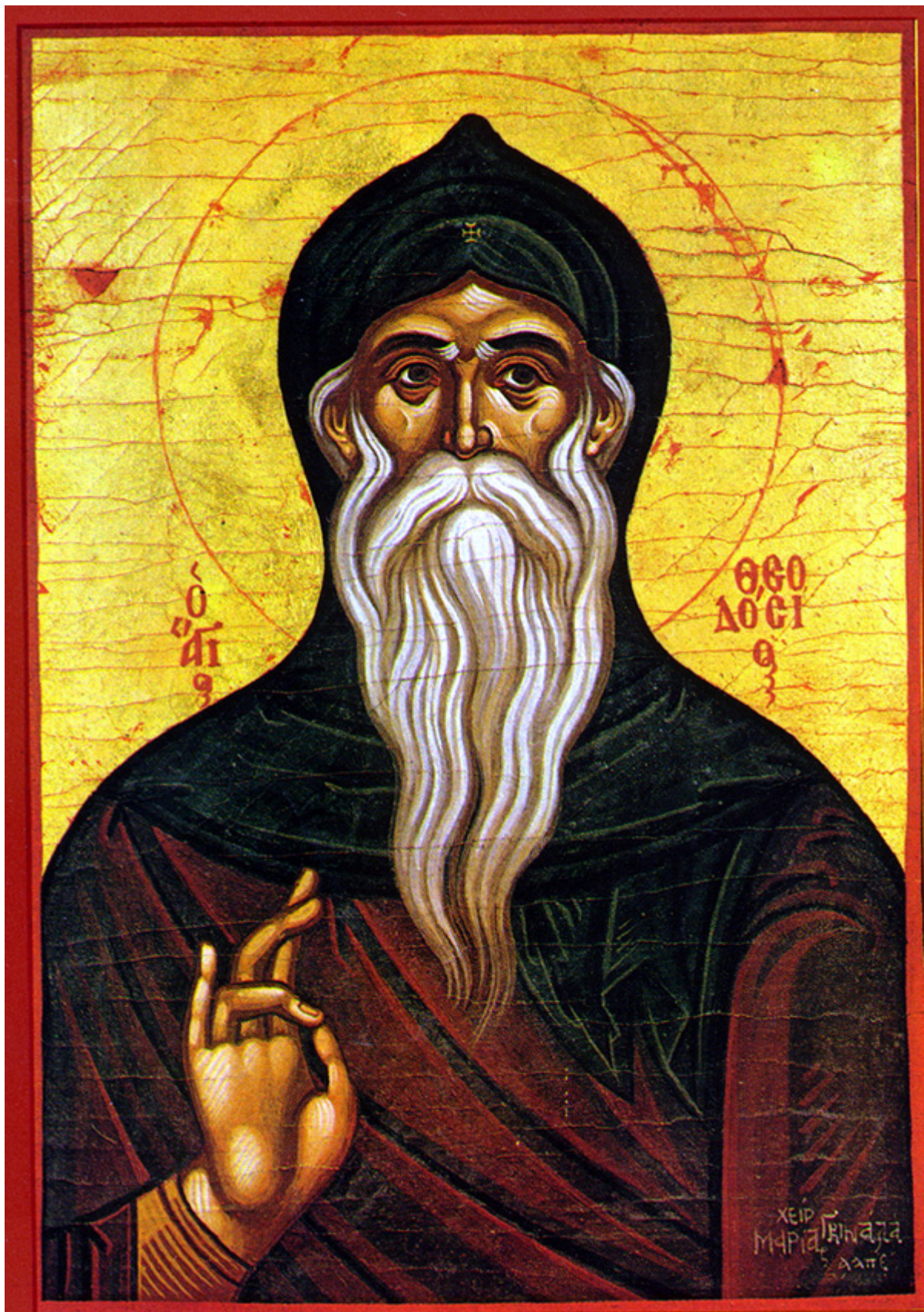
Όσιος Θεοδόσιος ο κοινοβιάρχης