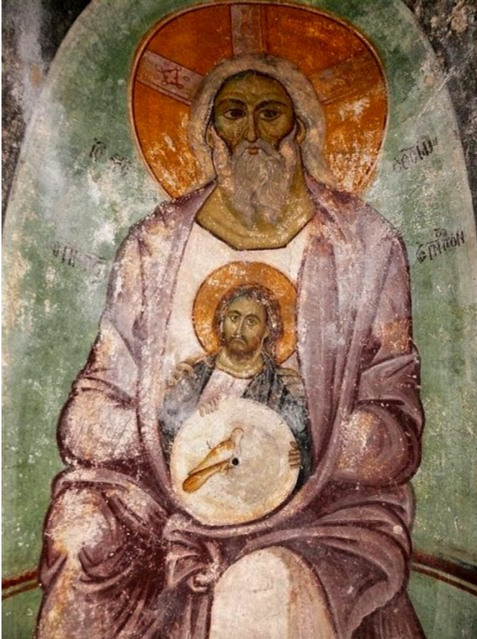
Η σπάνια απεικόνιση της Αγίας Τριάδος στην Παναγία Κουμπελίδικη της Καστοριάς.

/ Επιστήμες, Τέχνες & Πολιτισμός / Ορθόδοξη πίστη