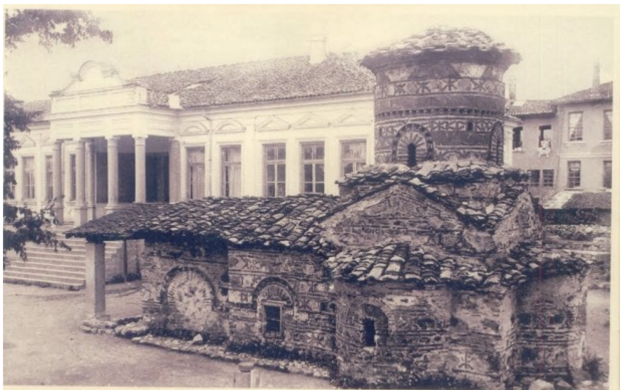
Παλαιά καρτ ποστάλ της Παναγίας Κουμπελίδικης πριν την ανακαίνισή της.

Δείτε περισσότερες φωτογραφίες παρακάτω: