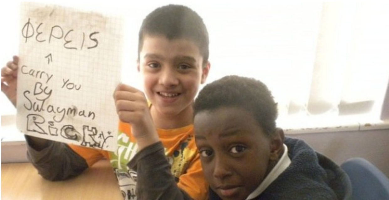
Οι Άγγλοι μαθαίνουν αρχαία..

Άγγλοι μαθητές του δημοτικού μαθαίνουν τη «νεκρή» γλώσσα των προγόνων μας προκειμένου να βελτιώσουν τα αγγλικά τους! Οι Βρετανοί πιτσιρικάδες συμμετέχουν στο πρωτοποριακό εκπαιδευτικό πρόγραμμα του οργανισμού Iris Project, που έχει ως στόχο τη γνωριμία των παιδιών με τη γλώσσα αλλά και τον πολιτισμό της ελληνικής και ρωμαϊκής αρχαιότητας.