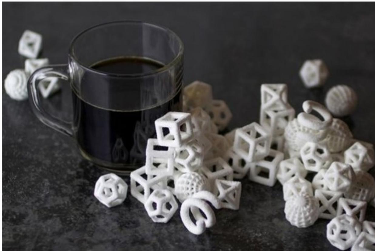
Κύβοι ζάχαρης στα πιο απίθανα σχήματα

Δύο 3D εκτυπωτές που υπόσχονται φουτουριστικά γλυκά παρουσιάστηκαν στην έκθεση CES του Λας Βέγκας