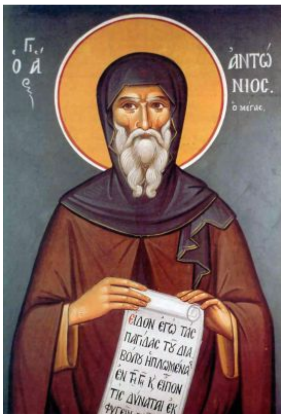
Ο Άγιος Αντώνιος ο Μέγας

Το όνομα του Μεγάλου Αντωνίου γίνεται ξακουστό. Ο θαυμασμός, για την αυστηρή ζωή, παρακινεί πολλούς να πάνε να τον δούνε. Πολλοί μοναχοί, τον βλέπουνε σαν φωτεινό παράδειγμα αγίας ζωής και θέλουν να τον μιμηθούν. Όταν, λοιπόν, μαθαίνουν που βρίσκεται, τρέχουν πολλοί με χαρά κοντά του. Κοιτάζουν με απορία το κοκαλιάρικο σώμα του και τα χάνουν. Αρκετοί, που πάσχουν από αρρώστιες, μόλος τον βλέπουν, γιατρεύονται. Πολλοί δαιμονισμένοι λυτρώνονται από τα δεσμά του διαβόλου. Ο Μέγας Αντώνιος, όλους τους δίδασκε. Δεν ήξερε βέβαια γράμματα, αλλά ο λόγος του ήτανε «ἅλατι ἤρτυμένος». Όσοι τον άκουγαν, ένοιωθαν αμέσως γαλήνη στην καρδιά του. Μεγάλωνε ο έρωτάς τους για την αρετή. Έφευγε από το σώμα τους η τεμπελιά, για τους πνευματικούς αγώνες και από την ψυχή τους ο καταστρεπτικός εγωισμός. Μάθαιναν όλοι τους, πώς να καταφρονούν τους πειρασμούς του πονηρού διαβόλου και πώς να πλησιάζουν περισσότερο τον Χριστό.