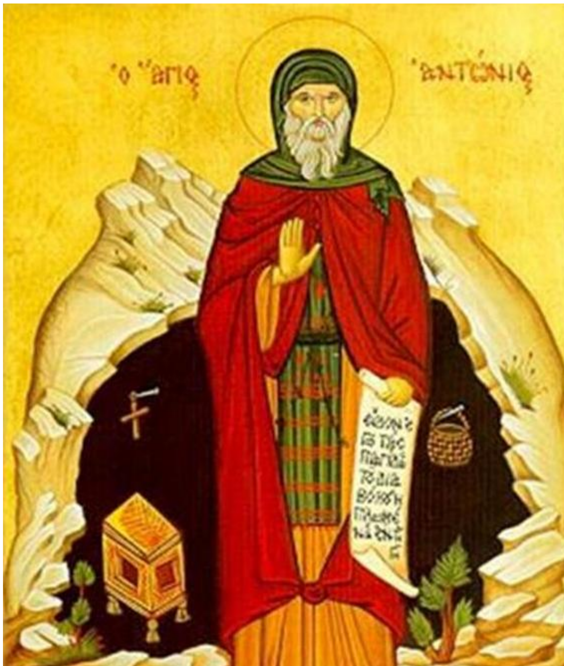
Ο Άγιος Αντώνιος ο Μέγας