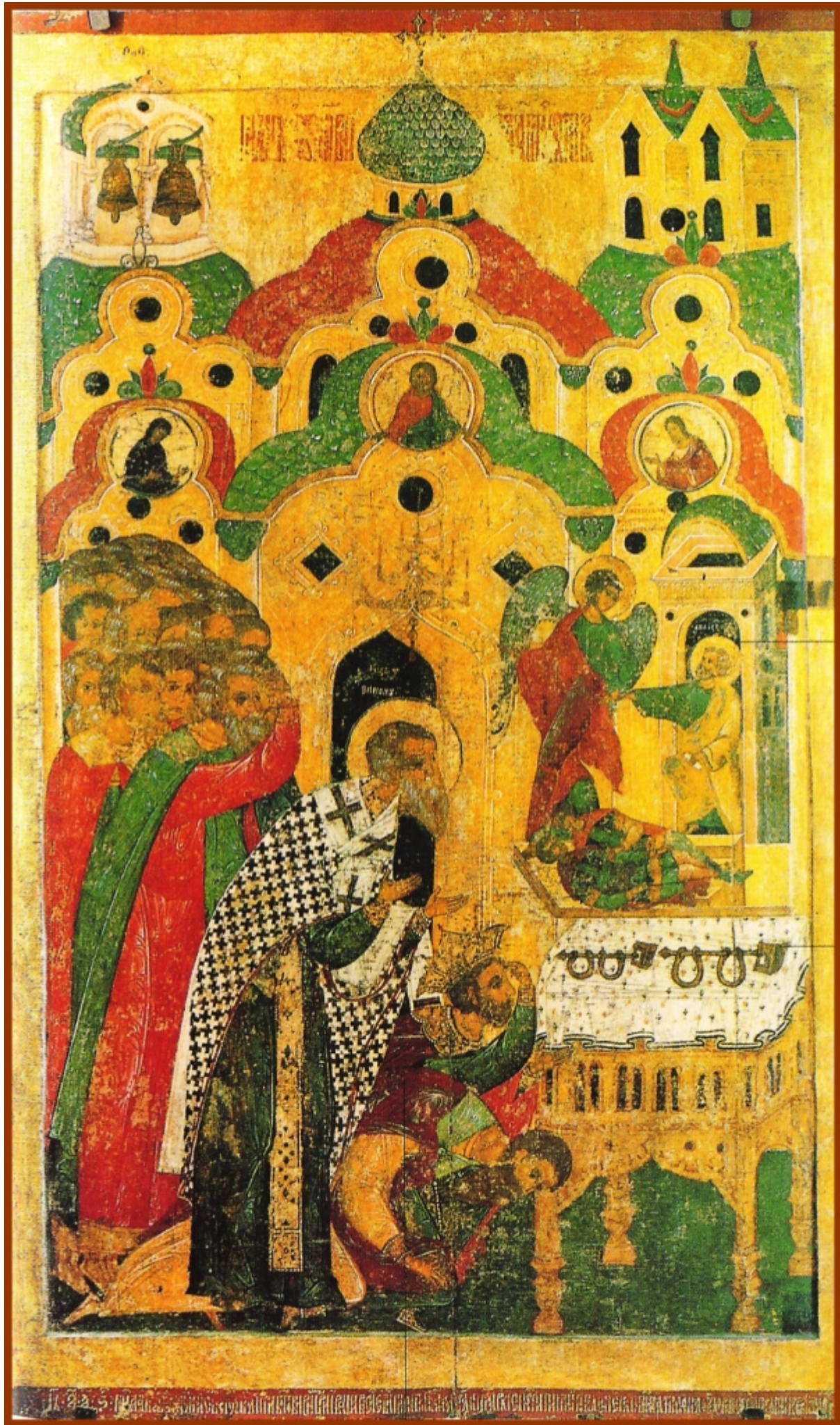
Η προσκύνηση των αλυσίδων.