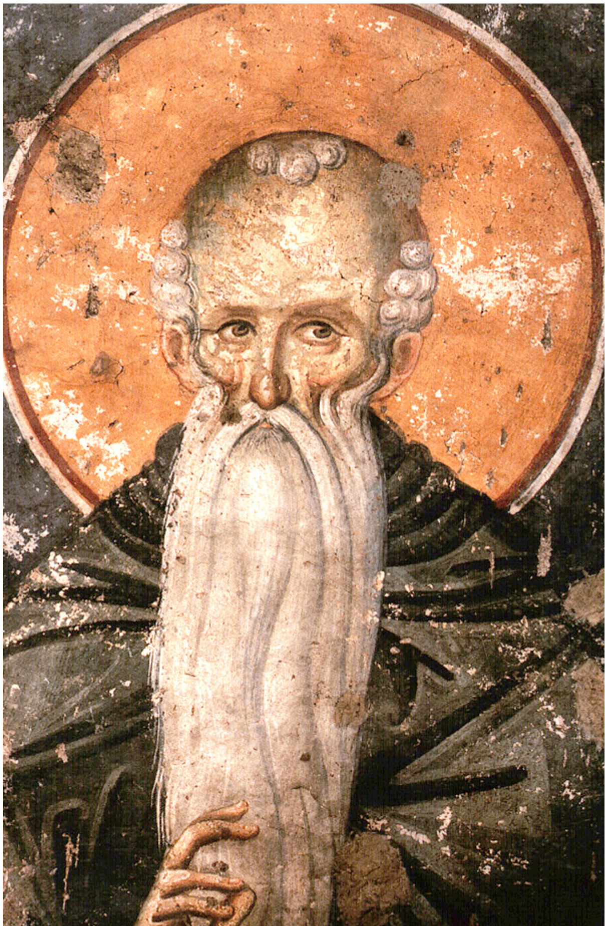
Όσιος Ευθύμιος ο Μέγας