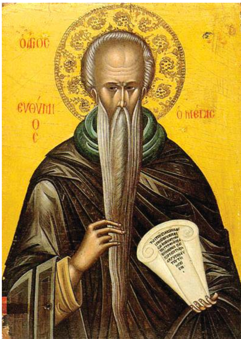
Όσιος Ευθύμιος ο Μέγας

Εορτάζει στις 20 Ιανουαρίου εκάστου έτους.