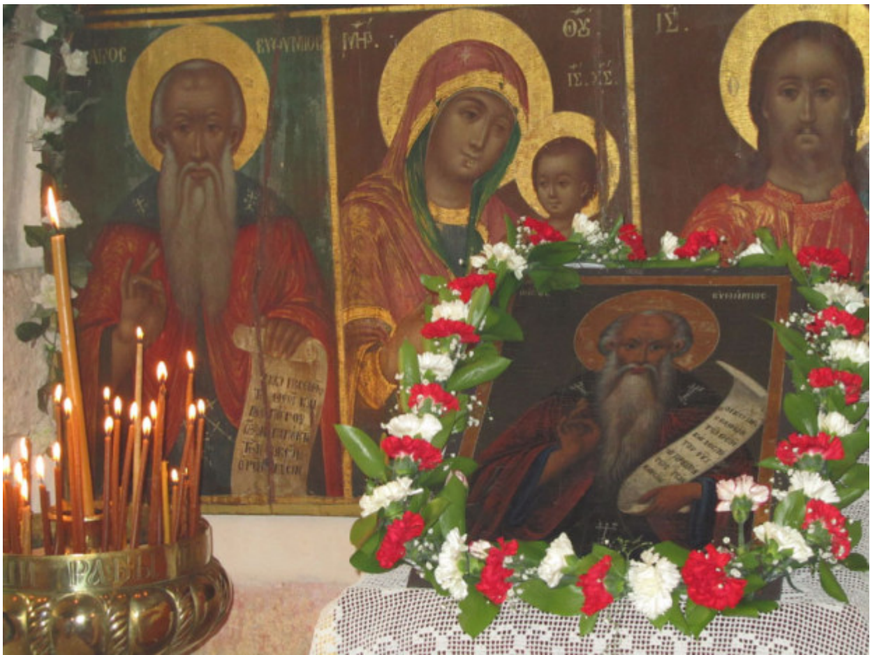
Η εικόνα του Αγίου Ευθυμίου που βρίσκεται στην ομώνυμη Ιερά Μονή στην Παλαιά πόλη των Ιεροσολύμων