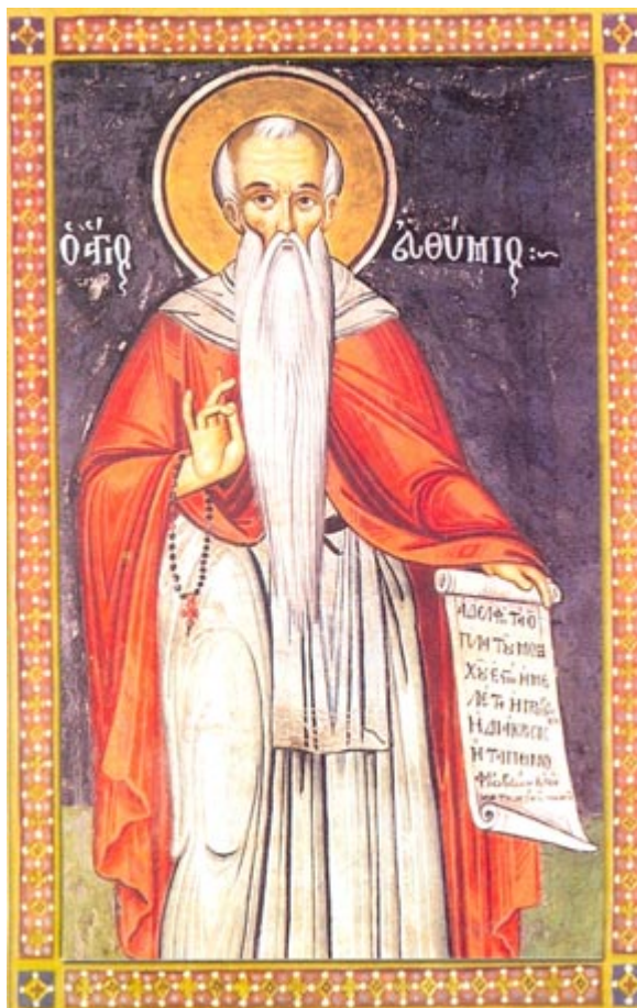
Όσιος Ευθύμιος ο Μέγας