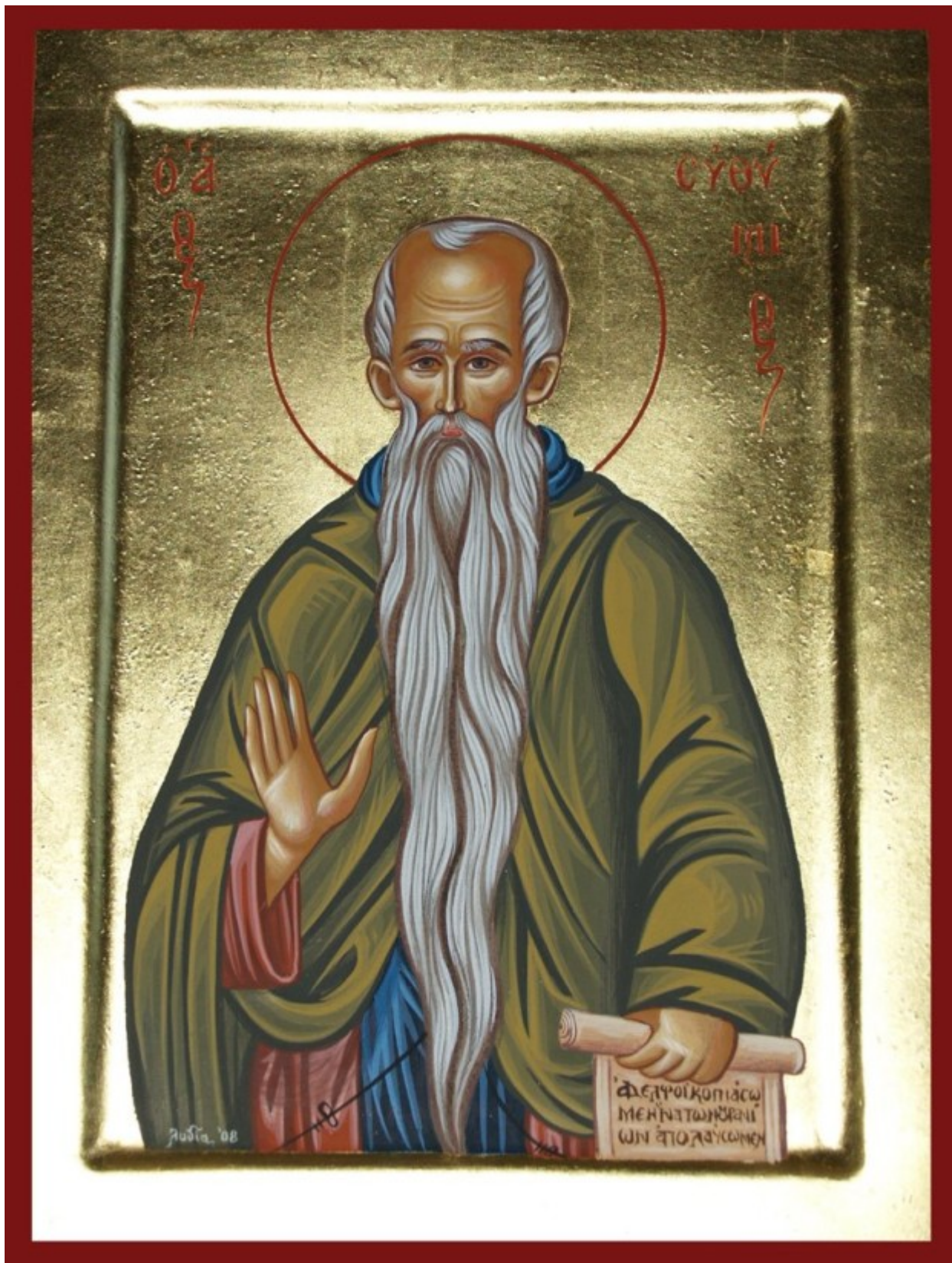
Όσιος Ευθύμιος ο Μέγας - Λυδία Γουριώτη© ( http://lydiagourioti-iconography.blogspot.com ) Όσιος Ευθύμιος ο Μέγας