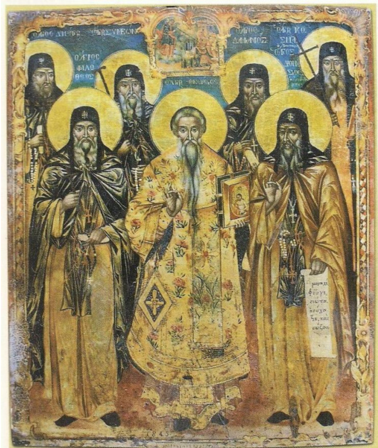
Οί ὄσιοι τῆς Ἱ. Μ. Φιλοθέου. Φορητὴ εἰκόνα Ἱ. Μ. Φιλοθέου (1845).