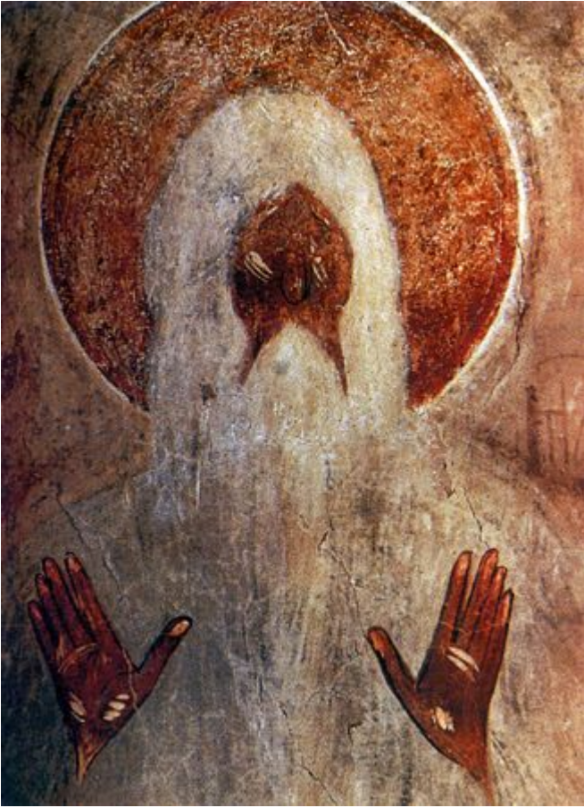
Όσιος Μακάριος ο Αιγύπτιος