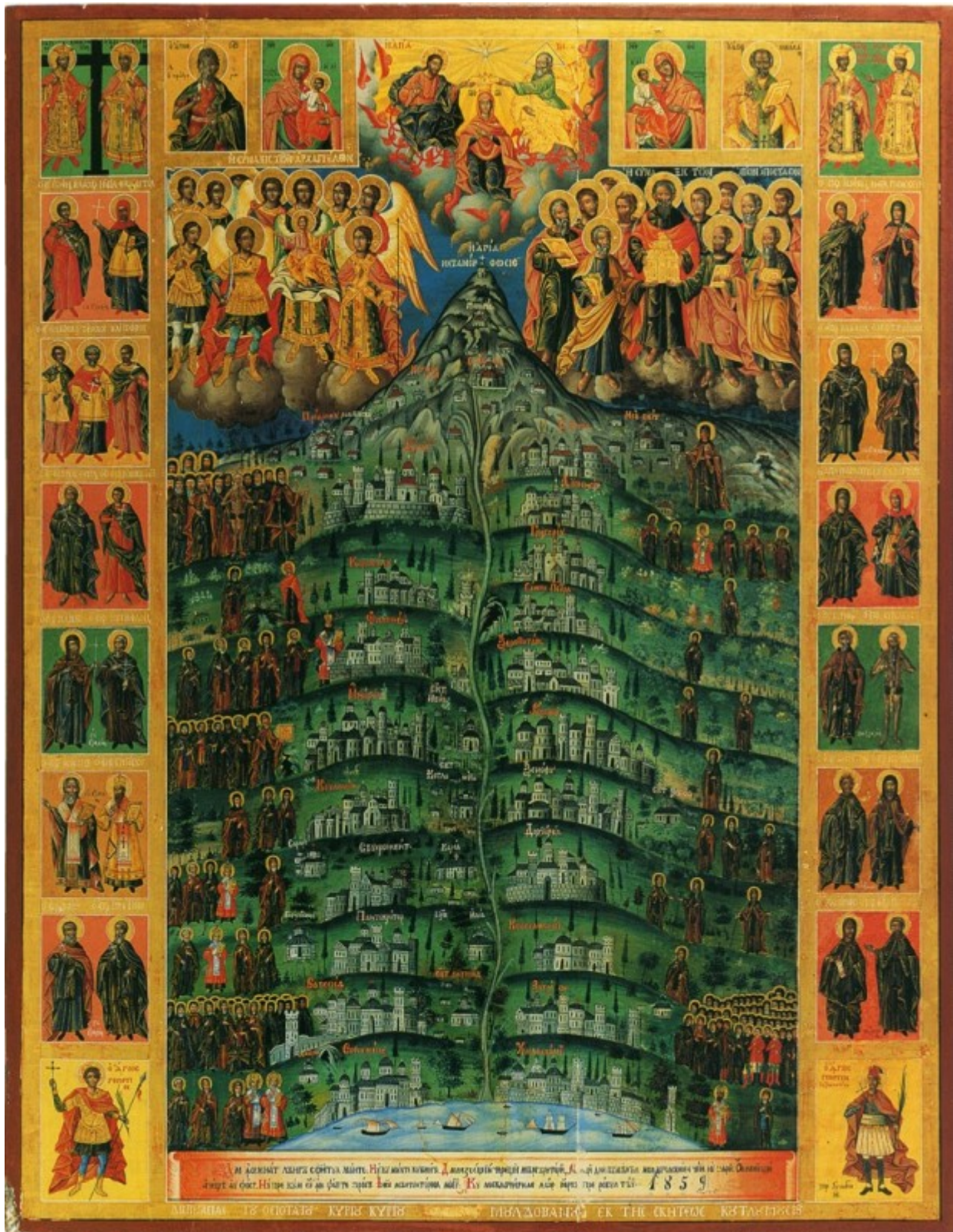
Πηγή φωτογραφίας: http://saints-of-mount-athos.blogspot.gr/

Πηγές: agioritikesmnimes.blogspot.gr - elpenor.org