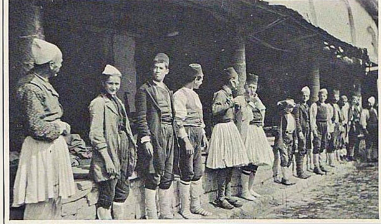
A GROUP OF ALBANIANS.