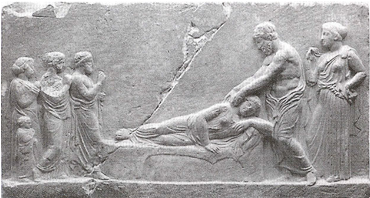
Ο Θεός Ασκληπιός θεραπεύει μία εγκοιμισμένη ασθενή, πίσω του η Υγεία, αριστερά η οικογένεια της ασθενούς. Ασκληπιείο Πειραιά, 4ος αι. π.Χ., Αρχαιολογικό Μουσείο Πειραιά

«Ιπποκρατική Ιατρική διά μέσου των αιώνων» είναι ο τίτλος έκθεσης που συνδιοργανώνουν η 8η Εφορεία Βυζαντινών Αρχαιοτήτων, το Πανεπιστήμιο Ιωαννίνων - Μουσείο Ιστορίας της Ιατρικής, το Διεθνές Ιπποκράτειο Ίδρυμα Κω και το Αρχαιολογικό Ινστιτούτο Ηπειρωτικών Σπουδών και η οποία παρουσιάζεται στο Ιτς Καλέ, στο Κάστρο των Ιωαννίνων από τις 10 Ιανουαρίου έως την 1η Μαρτίου 2014.