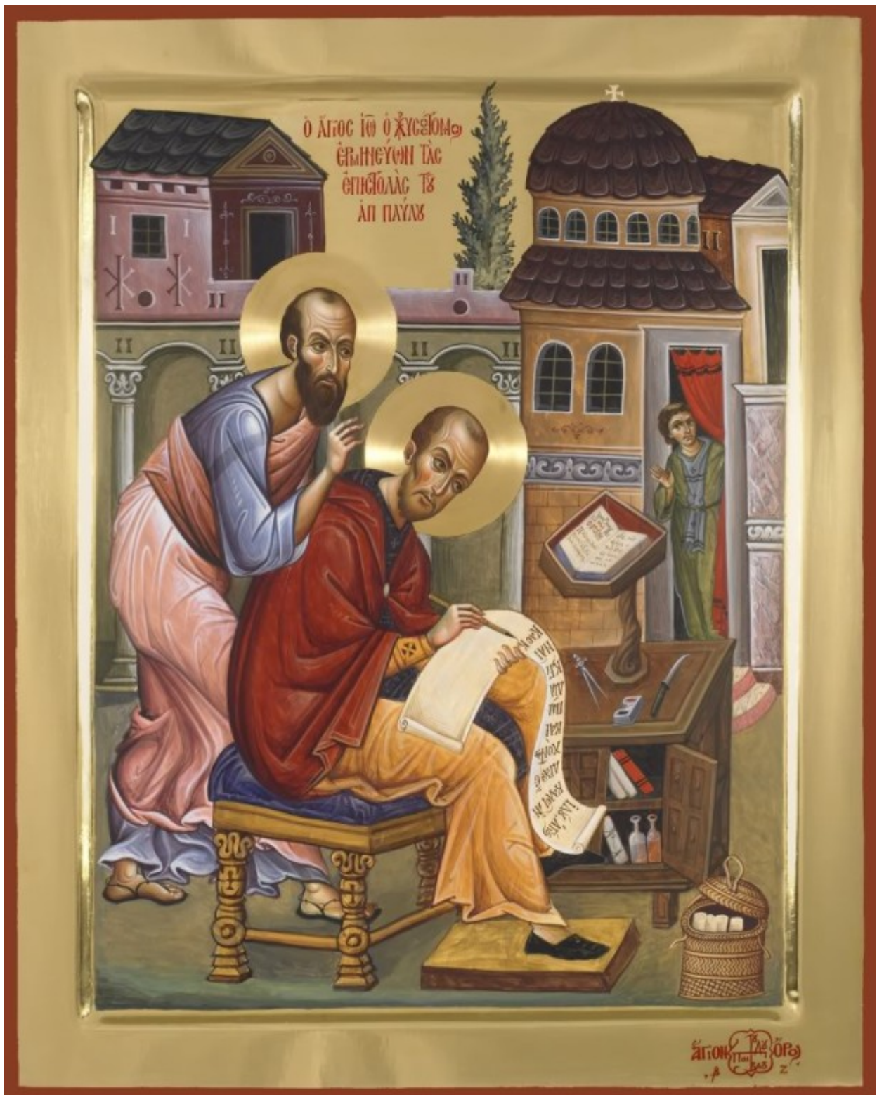
Ο Απόστολος Παύλος υπαγορεύει στον Άγιο Ιωάννη τον Χρυσόστομο την ερμηνεία των επιστολών του. Εικόνα του αιογραφείου της Ιεράς Μεγίστης Μονής Βατοπαιδίου.