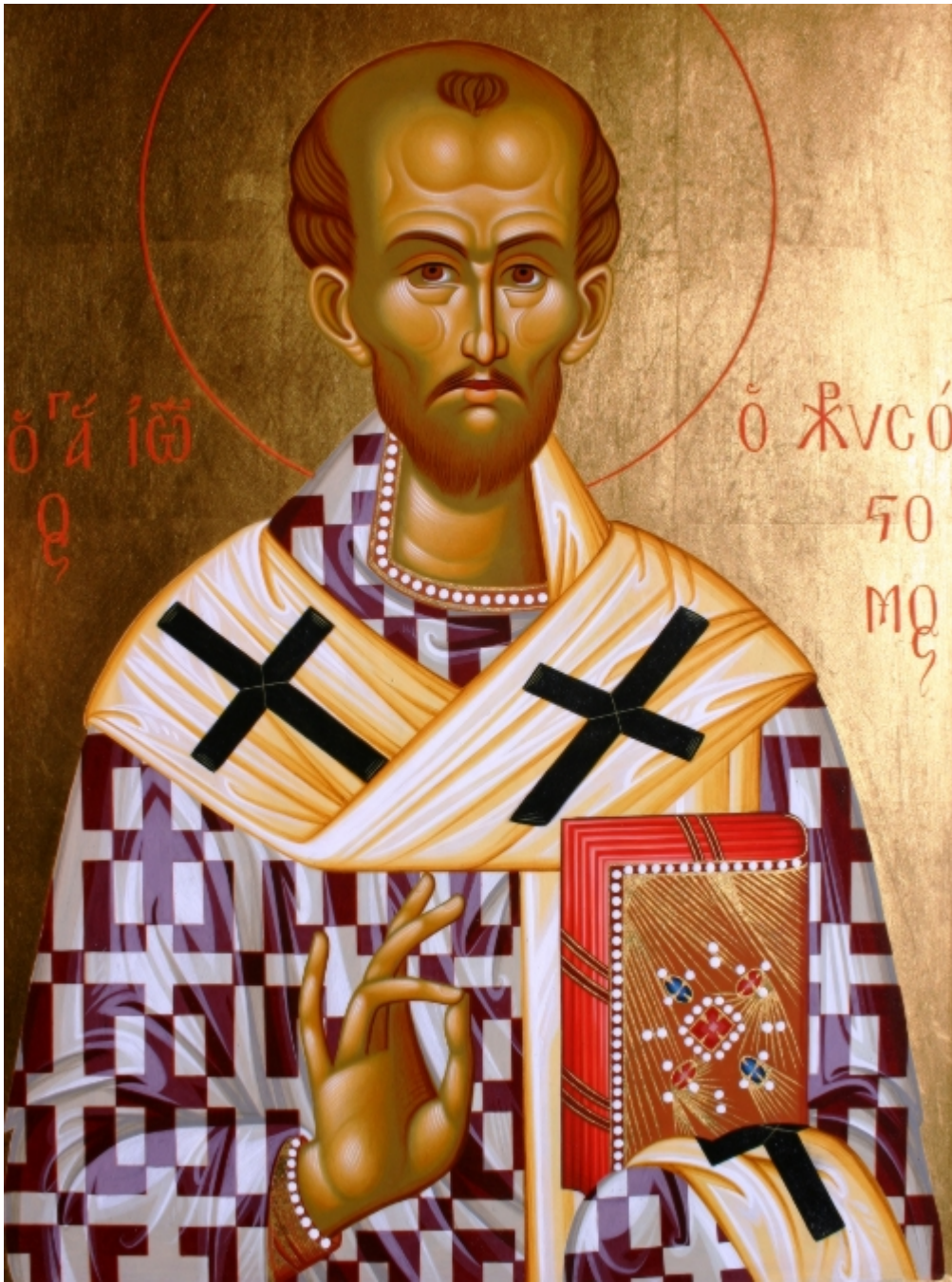
Άγιος Ιωάννης ο Χρυσόστομος