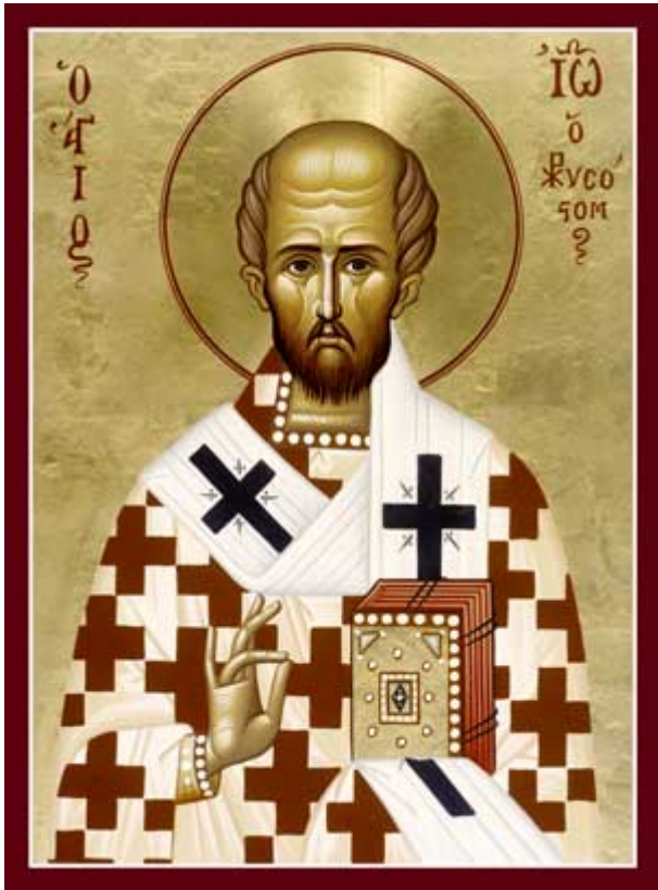
Άγιος Ιωάννης ο Χρυσόστομος - Φορητή εικόνα της Ιεράς Μονής Μεταμορφώσεως στην Βοστώνη

Εορτάζει στις 27 Ιανουαρίου εκάστου έτους.