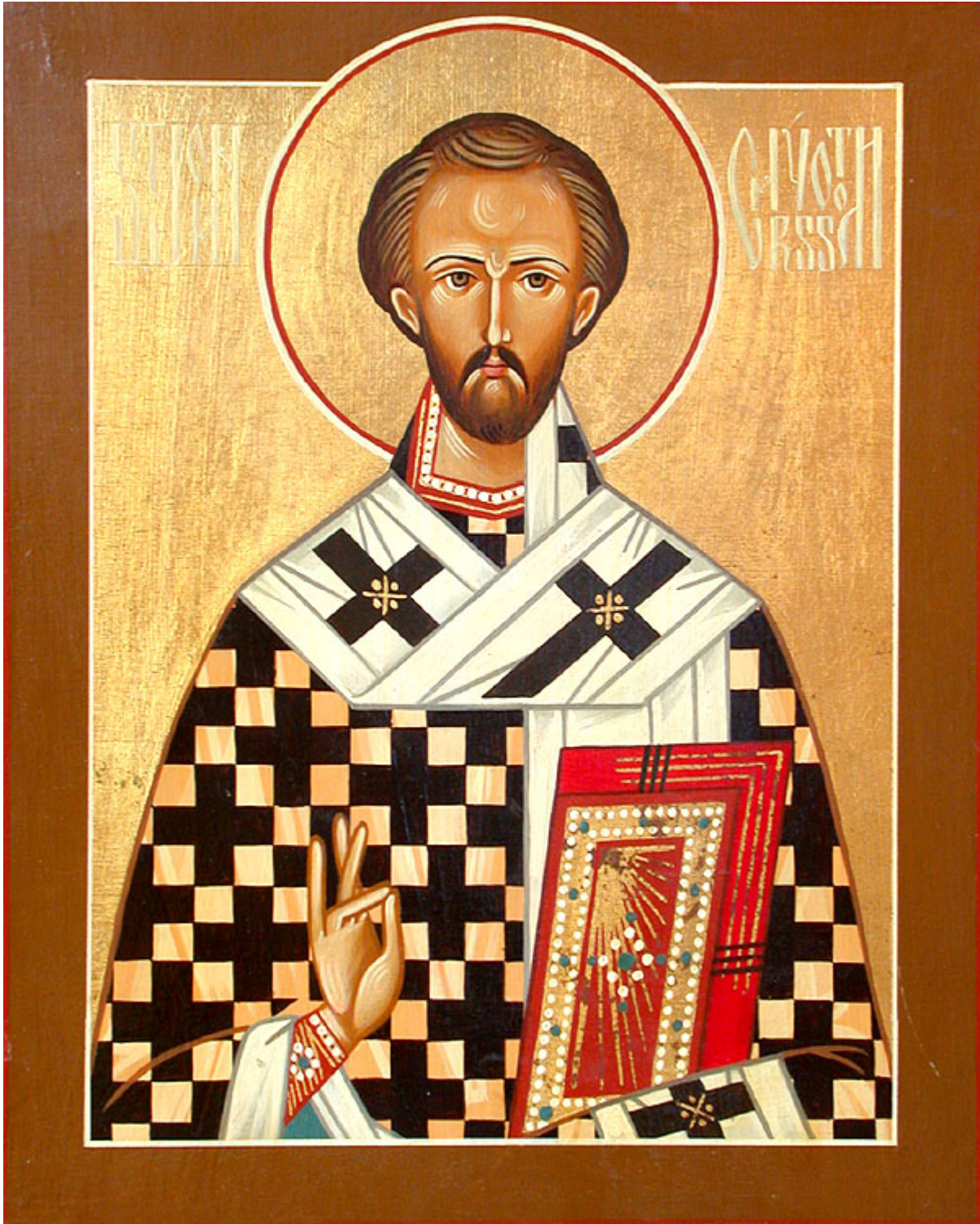
Άγιος Ιωάννης ο Χρυσόστομος