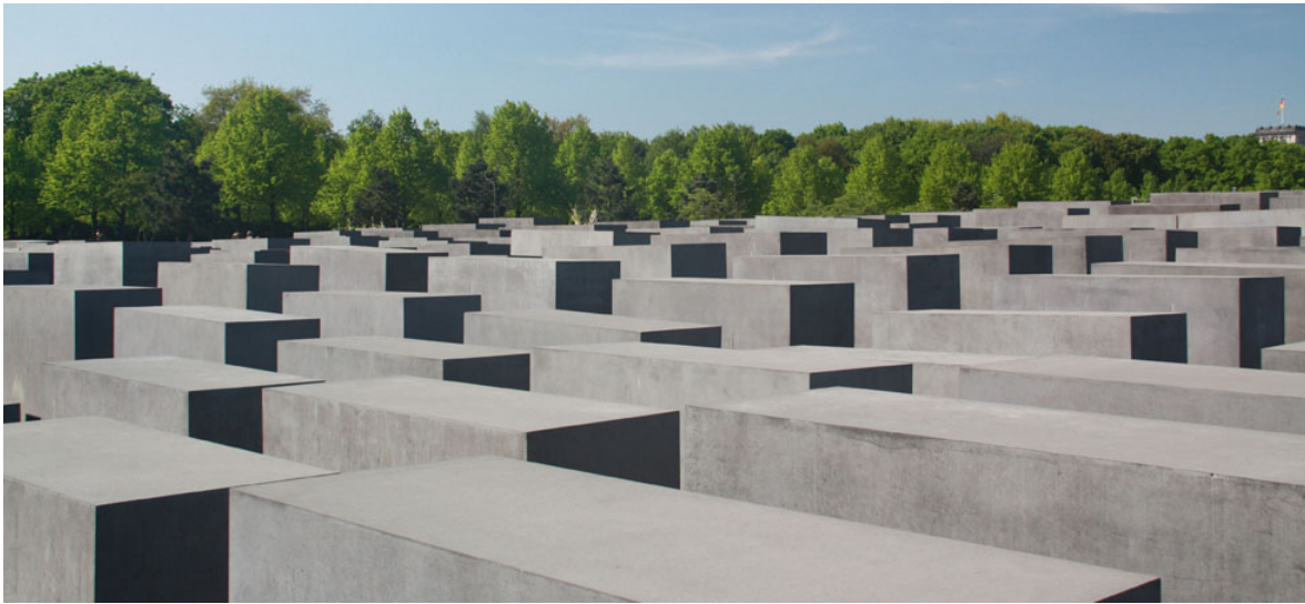
Το μνημείο του Ολοκαυτώματος στο Βερολίνο

“Την επομένη ο π. Ντιμίτρι ετέλεσε Θεία Λειτουργία σ’ένα παρεκκλήσι της Λουρμέλ, αφιερωμένο στον Άγιο Φίλιππο, έναν επίσκοπο που πλήρωσε με τη ζωή του επειδή κατήγγειλε τα εγκλήματα του τσάρου Ιβάν του Τρομερού. Δυναμωμένος από τη Θεία Κοινωνία κίνησε για τα γραφεία της Γκεστάπο, στην οδό ντε Σουσί. Τον ανέκριναν για τέσσερις ώρες, στις οποίες τους μίλησε κατάματα για τα πιστεύω του. Έχει σωθεί ένα τμήμα του διαλόγου: