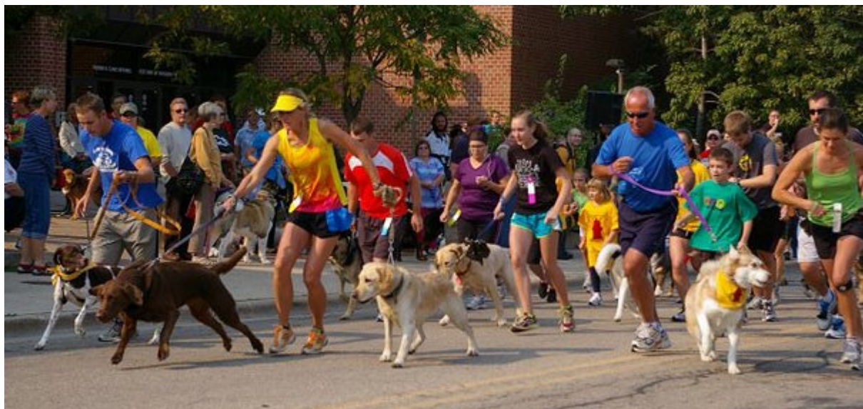
Βοηθούν στην διατήρηση του σώματος σε καλή φυσική κατάσταση

Μια μελέτη από το Πανεπιστήμιο του Λονδίνου κατέληξε στο συμπέρασμα ότι τα παιδιά με τα σκυλιά είναι πιο δραστήρια και γυμνάζονται περισσότερο συχνά από ό, τι τα παιδιά χωρίς σκυλιά . Αλλά και για τους μεγάλους, είναι πολύ πιο διασκεδαστικό και ενδιαφέρον να κάνετε τζόκινγκ παρέα με το σκύλο σας.