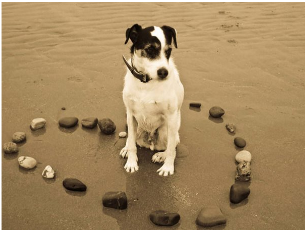
Μειώνουν τον κίνδυνο καρδιακών προβλημάτων

Οι προκαταρκτικές μελέτες από το American Heart Association αποκαλύπτουν ότι οι ιδιοκτήτες σκύλων έχουν μικρότερο κίνδυνο καρδιακής νόσου από εκείνους που δεν έχουν σκυλιά. Οι λόγοι είναι φυσικά η άσκηση που προσφέρει μια βόλτα με έναν σκύλο, αλλά και η μείωση του άγχους που προκαλεί η παρουσία ενός σκύλου.