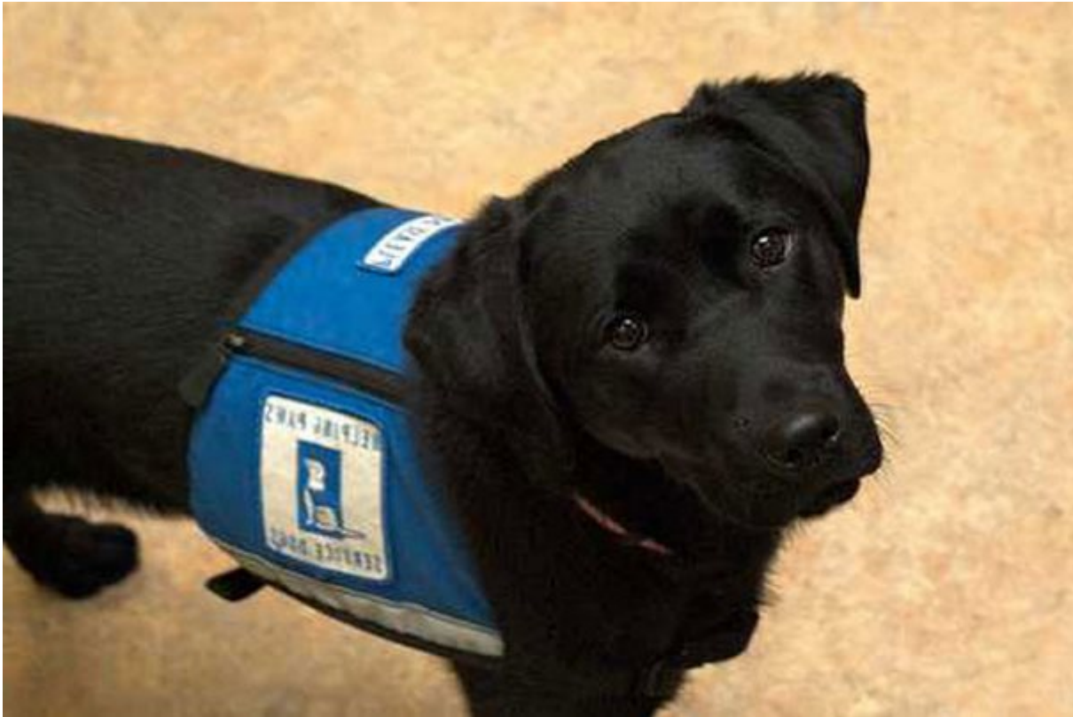
Διαισθάνονται την κρίση επιληψίας πριν αυτή συμβεί

ανακάλυψε ότι οι εργαζόμενοι που παίρνουν το σκυλί μαζί τους στην δουλειά, έχουν λιγότερο άγχος και είναι πιο ευτυχισμένοι στο εργασιακό τους περιβάλλον.