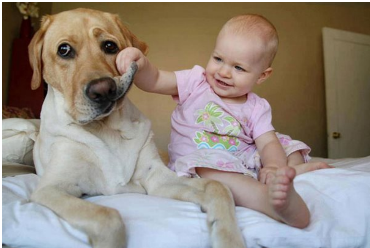
Βοηθούν τα μωρά να έχουν υγεία

Μια πρόσφατη μελέτη έχει δείξει ότι τα μωρά που ζουν με σκυλιά είναι υγιέστερα από εκείνα που δεν έχουν καμία επαφή με τα χαριτωμένα τετράποδα. Στα παιδιά της δεύτερης κατηγορίας έχουν παρατηρηθεί ξαφνικά και φαινομενικά χωρίς λόγο συμπτώματα όπως βήχας, ρινική καταρροή και λοιμώξεις του αυτιού. Οι ερευνητές πιστεύουν ότι αυτό οφείλεται στο γεγονός ότι τα σκυλιά μεταφέρουν χώμα, λάσπη και άλλα μικρόβια ενισχύοντας έτσι το ανοσοποιητικό σύστημα του παιδιού .