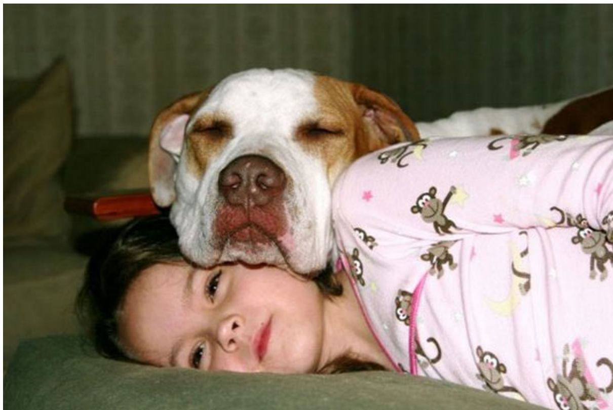
Βοηθούν στην πρόληψη εκζέματος στα παιδιά

Θα μπορούσε να είναι ευεργετικό να πάρετε ένα σκυλί για το μωρό σας, ακόμα κι αν αυτό είναι αλλεργικό. Μελέτες έχουν δείξει ότι τα παιδιά ηλικίας κάτω του ενός που ζουν με ένα σκύλο, είναι πολύ λιγότερο πιθανό να αναπτύξουν έκζεμα.