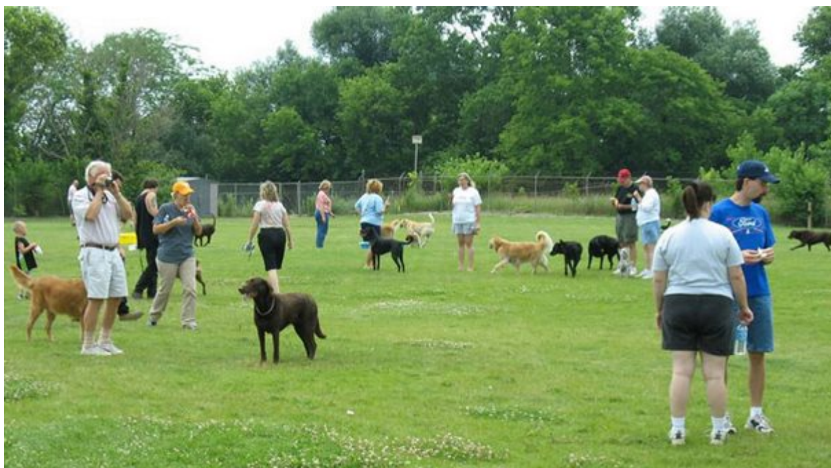
Θα σας βοηθήσουν να γίνεται πιο κοινωνικοί

Τα σκυλιά έχουν δείξει ότι μπορούν να εκπαιδευθούν για να εντοπίζουν ορισμένα αλλεργιογόνα . Έτσι, εάν είστε αλλεργικοί, για παράδειγμα στο φυστικοβούτυρο, ο σκύλος σας θα σας ειδοποιήσει εάν εντοπίσει κάτι που μυρίζει ως φιστίκι στο δωμάτιο .