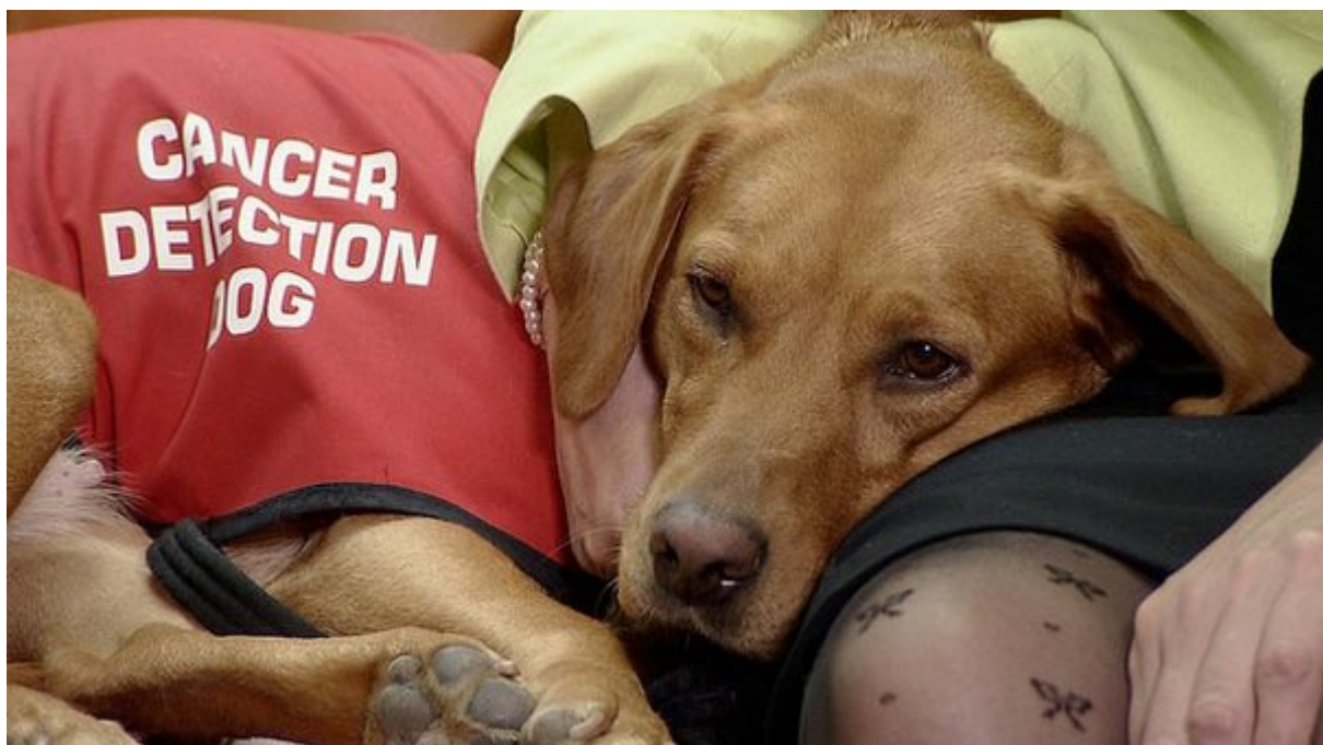
Μπορούν να ανιχνεύσουν τον καρκίνο

Λόγω της απίστευτης αίσθησης της όσφρησης, τα σκυλιά μπορούν με 70% έως 99 % ακρίβεια ( ανάλογα με τη μελέτη ) να ανιχνεύσουν τον καρκίνο του πνεύμονα σε ασθενή που βρίσκεται κοντά τους.