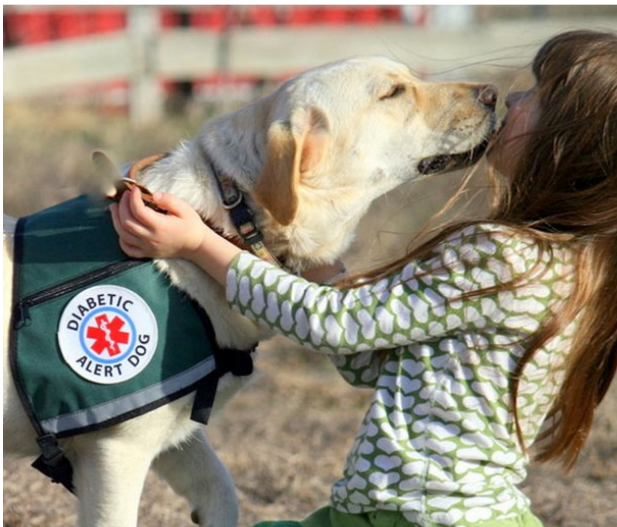
Εντοπίζουν το χαμηλό σάκχαρο στο αίμα

Η ανεπτυγμένη αίσθηση της όσφρησης που διαθέτουν οι πιστοί μας φίλοι μπορεί να κάνει ακόμη περισσότερα.. Τα σκυλιά μπορούν να ανιχνεύσουν τα χαμηλά επίπεδα σακχάρου στο αίμα του ιδιοκτήτη τους. Έτσι, ένα σκυλί θα καταφέρει να προειδοποιήσει τον διαβητικό ή κάποιο κοντινό του, σώζοντας την ζωή του.