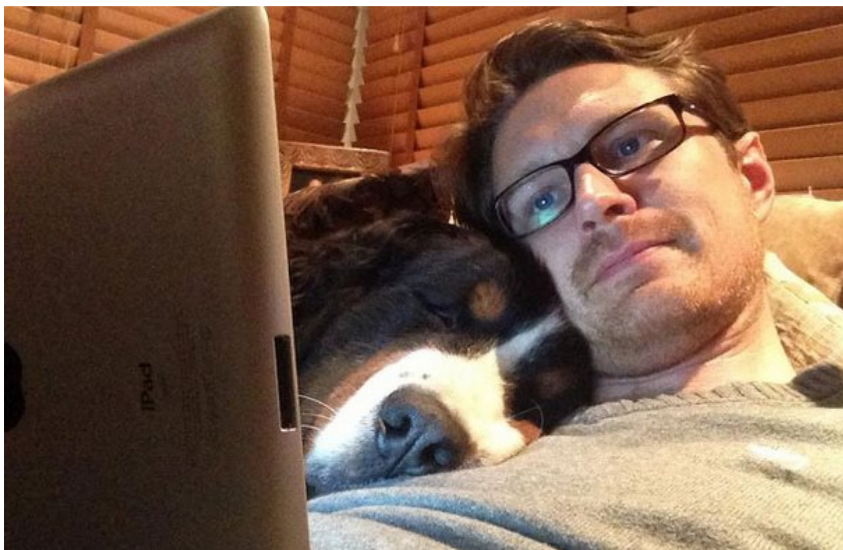
Κρατούν τα άτομα με ινομυαλγία ζεστά

συχνό φαινόμενο της εποχής μας, που προκαλεί μεγάλο άγχος, και στα ίδια τα παιδιά-θύματα όπως και στους γονείς τους, που αντιμετωπίζουν συχνά το φόβο και την άρνηση του παιδιού τους να πάει στο σχολείο. Για την πρόληψη του μπούλινγκ στα σχολεία της Αμερικής, έχουν δημιουργηθεί πειραματικά προγράμματα που φέρνουν τα σκυλιά στα σχολεία. Ο σκοπός είναι να μάθουν τα παιδιά να αντιμετωπίζουν τους συμμαθητές τους όπως ακριβώς έναν σκύλο: με αγάπη και συμπάθεια! Μέχρι στιγμής το πείραμα πηγαίνει καλά, τα παιδιά κάνουν τη σύνδεση. Ας ελπίσουμε ότι αυτό θα συνεχίσει να συμβαίνει και στο μέλλον.