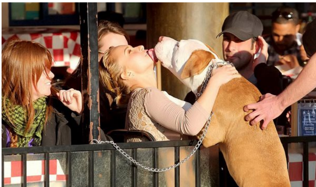
Επουλώνουν τις πληγές μόνο με ένα φιλί

Αν σας φιλήσει ένας σκύλος προφανώς και θα αισθανθείτε όμορφα. Δεν θα είναι όμως μόνο αυτό το ευχάριστο συναίσθημα το όφελος. Μελέτες έχουν δείξει ότι το σάλιο του σκύλου, διεγείρει τα νεύρα και τους μυς και κάνει το οξυγόνο να κινείται και πάλι, το οποίο είναι το μυστικό συστατικό που βοηθά στην επούλωση των πληγών. Κάπως έτσι η φράση «γλείφει τις πληγές» μοιάζει να αποκτά νόημα.