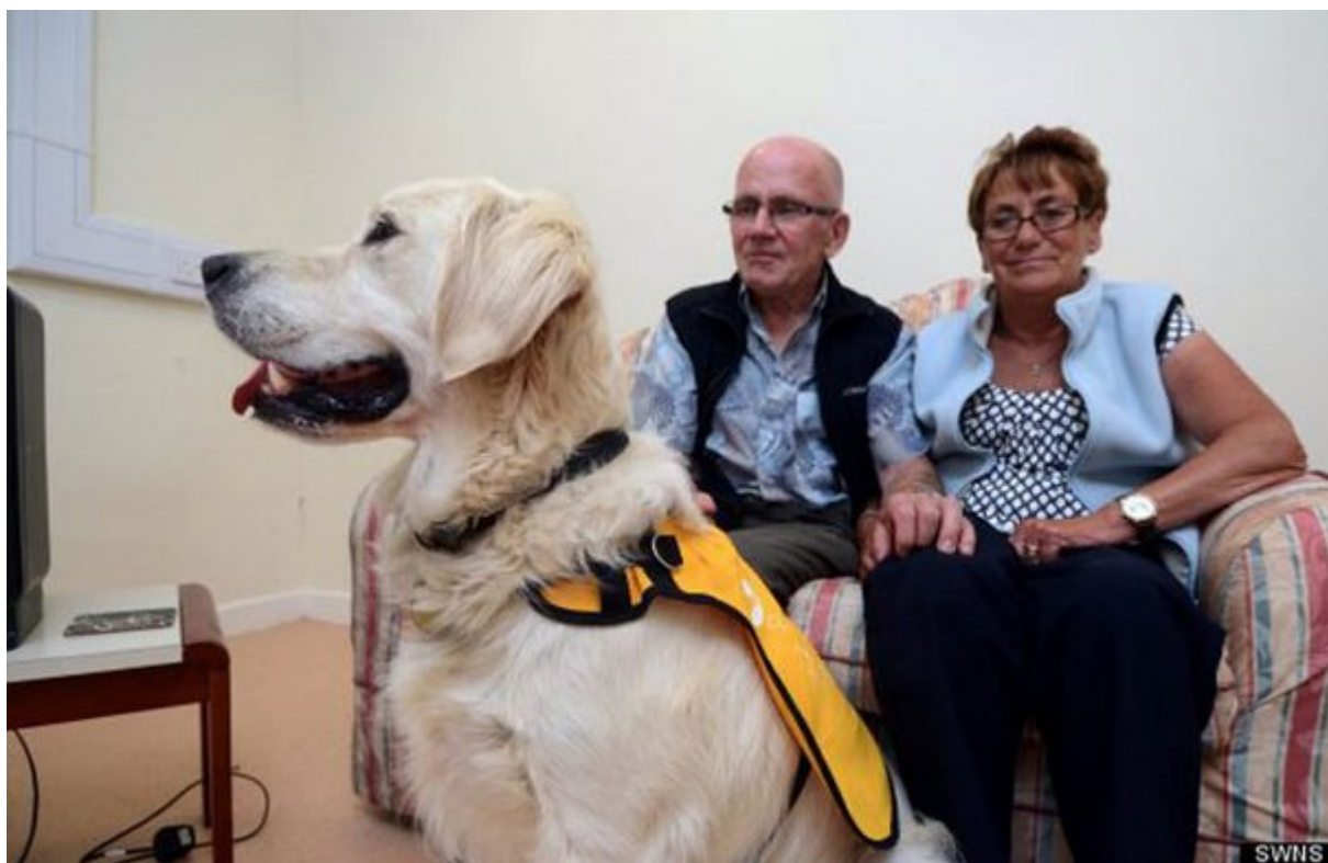
Βοηθούν τα άτομα με άνοια να ζήσουν μια καλύτερη ζωή

Τα σκυλιά έχουν δείξει ότι μπορούν να βοηθήσουν άτομα με άνοια να διατηρήσουν με επιτυχία το χρονοδιάγραμμά τους. Όταν έρθει η ώρα θα τους υπενθυμίσουν να πάρουν τα φάρμακά τους ή να επισκεφτούν τον γιατρό. Επιπλέον όταν ο ιδιοκτήτης βιώνει την απογοήτευσή για την κατάσταση του μυαλού του το σκυλί θα είναι δίπλα του για να του υπενθυμίσει ότι δεν είναι μόνος. Ότι πάντα κάποιος θα είναι εκεί για αυτόν.