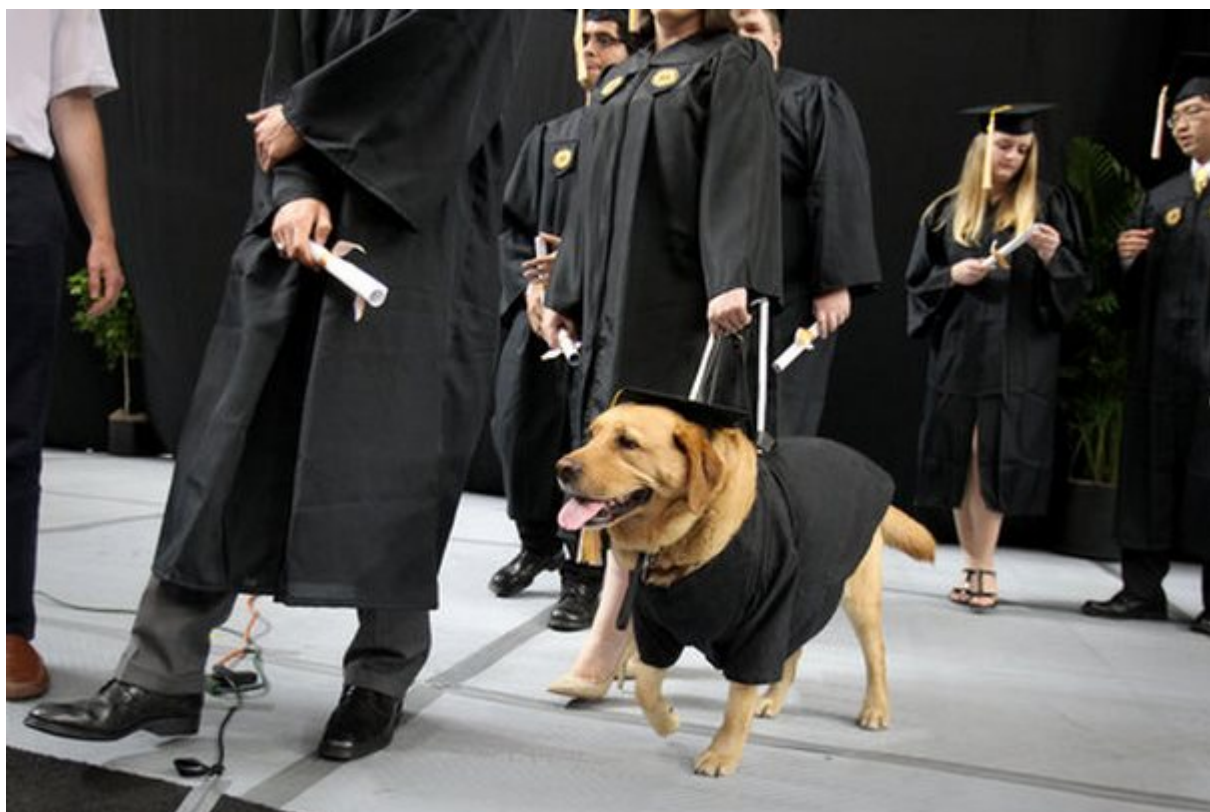
Βοηθούν τα παιδιά που δίνουν εξετάσεις να αποδώσουν καλύτερα

Πολλά πανεπιστήμια στο εξωτερικό έχουν βρει τον τρόπο να βοηθήσουν τους φοιτητές τους να αποβάλουν το άγχος την περίοδο των εξετάσεων. Πήραν σκυλιά που στην συνέχεια έφεραν σε επαφή με τους καταπονημένους φοιτητές. Το παιχνίδι ή απλά μια αγκαλιά με ένα κατοικίδιο ζώο έχουν αποδειχθεί ότι προσφέρουν ηρεμία αλλά και βελτιώνουν την απόδοση ενός μαθητή.