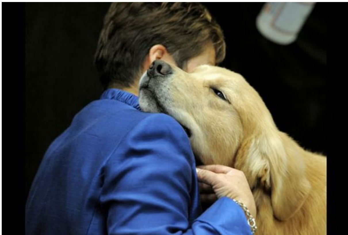
Βοηθούν στην αντιμετώπιση της κατάθλιψης

Οι μελέτες υποστηρίζουν ότι ακόμα και το πιο σοβαρό περιστατικό χρόνιας κατάθλιψης είναι πιο εύκολο να αντιμετωπιστεί με την αγάπη ενός σκύλου. Οι άνθρωποι που πάσχουν θα νιώσουν πολύ καλύτερα όταν συνειδητοποιήσουν ότι κάποιος βρίσκεται πάντα εκεί προσφέροντας την αγάπη του άνευ όρων. Είναι πραγματικά ένας λόγος να σηκωθούν, να πατήσουν γερά στα πόδια τους και να συνεχίσουν τον αγώνα τους για ζωή.