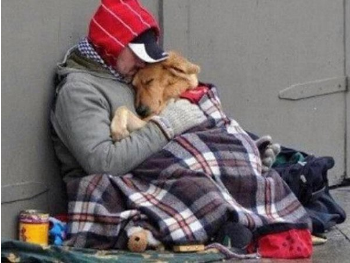
Συμπάσχουν με τον ανθρώπινο πόνο

Είναι όμορφα, πιστά, και παιχνιδιάρικα. Δεν είναι όμως μόνο αυτοί οι λόγοι που μας επιβάλλουν να υιοθετήσουμε έναν σκύλο..