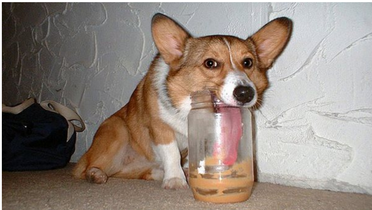
Σας βοηθούν να αποφύγετε τα αλλεργιογόνα

Τα σκυλιά έχουν δείξει ότι μπορούν να εκπαιδευθούν για να εντοπίζουν ορισμένα αλλεργιογόνα . Έτσι, εάν είστε αλλεργικοί, για παράδειγμα στο φυστικοβούτυρο, ο σκύλος σας θα σας ειδοποιήσει εάν εντοπίσει κάτι που μυρίζει ως φιστίκι στο δωμάτιο .