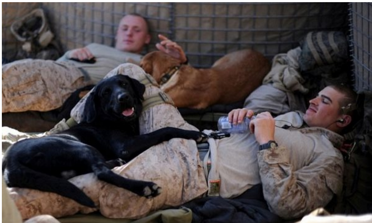
Βοηθούν τους βετεράνους πολέμου να ξεπεράσουν το PTSD

Αν και είναι πολύ σημαντική η συντροφικότητα που παρέχουν τα σκυλιά, δεν παύει η ανθρώπινη κοινωνική υποστήριξη να είναι πιο ευεργετική για την υγεία του ανθρώπου.