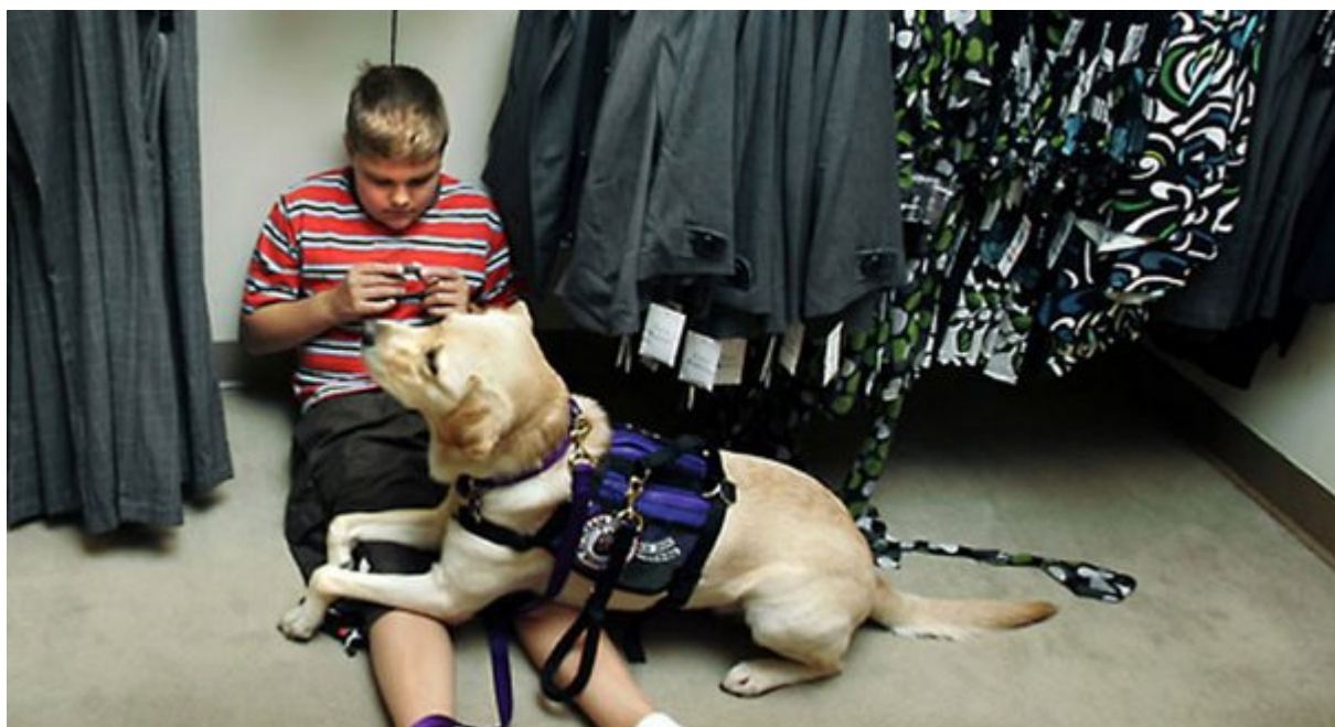
Προσφέρουν ηρεμία στα παιδιά με αυτισμό

Τα αυτιστικά παιδιά βλέπουν το κόσμο ιδιαίτερα αγχωτικό, με τρόπους που οι μη αυτιστικοί, δύσκολα μπορούν να καταλάβουν . Ευτυχώς όμως ένας σκύλος μπορεί. Οι μελέτες δείχνουν ότι η επαφή με ένα σκύλο βοηθά στη μείωση του ποσού της κορτιζόλης (η ορμόνη του στρες ) στο σώμα ενός αυτιστικού παιδιού.