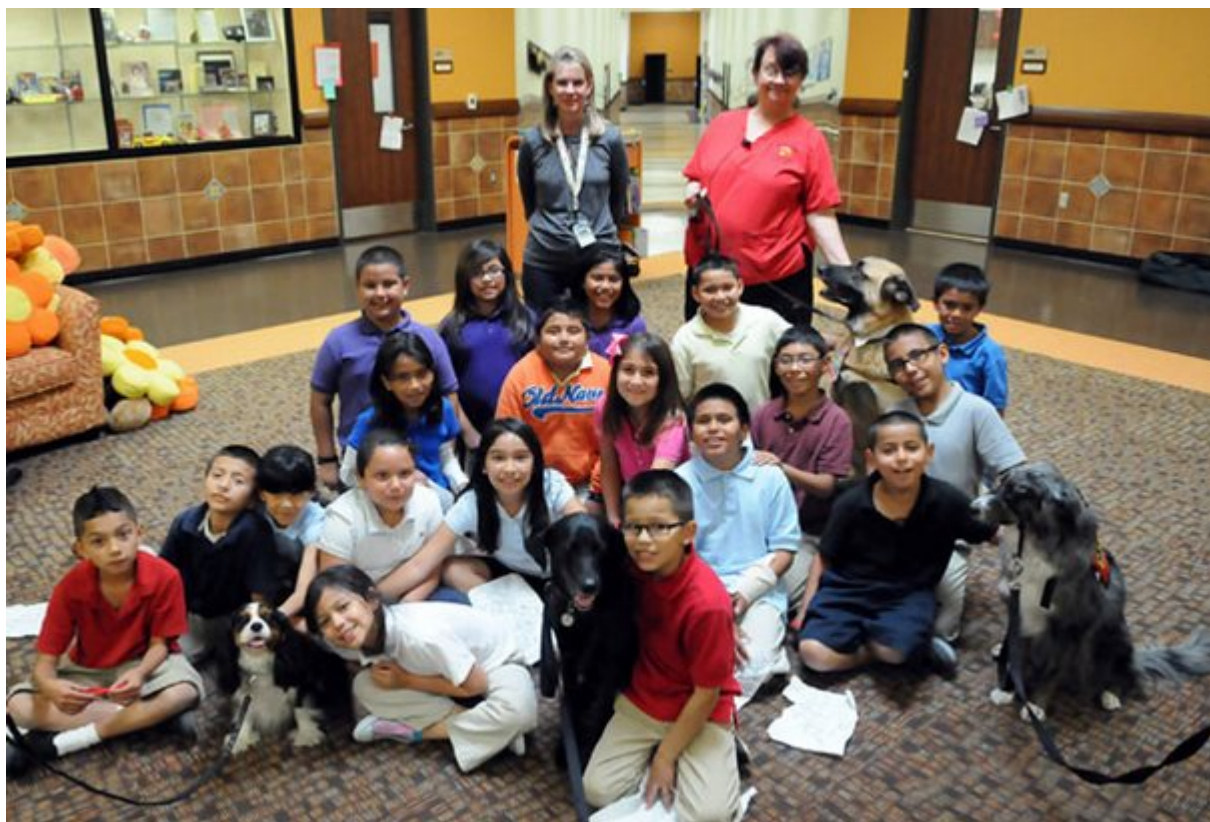
Βοηθούν στην πρόληψη του Bullying

Τα αυτιστικά παιδιά βλέπουν το κόσμο ιδιαίτερα αγχωτικό, με τρόπους που οι μη αυτιστικοί, δύσκολα μπορούν να καταλάβουν . Ευτυχώς όμως ένας σκύλος μπορεί. Οι μελέτες δείχνουν ότι η επαφή με ένα σκύλο βοηθά στη μείωση του ποσού της κορτιζόλης (η ορμόνη του στρες ) στο σώμα ενός αυτιστικού παιδιού.