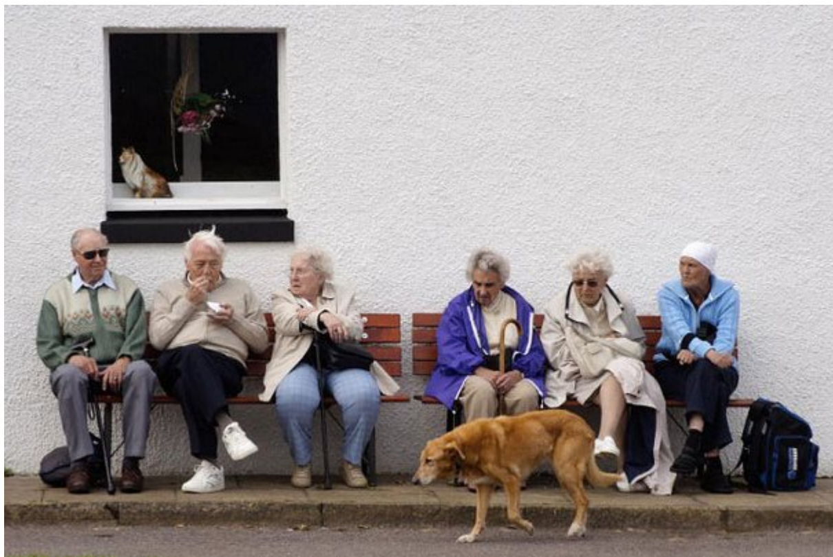
Βοηθούν τους ηλικιωμένους ιδιοκτήτες να επισκέπτονται λιγότερο τον γιατρό τους

Λόγω των θετικών νίβες που μεταφέρουν τα σκυλιά έχει αποδειχθεί ότι οι ηλικιωμένοι άνθρωποι που έχουν σκυλιά επισκέπτονται κατά μια φορά τον χρόνο λιγότερο τον γιατρό τους από εκείνους που δεν έχουν.