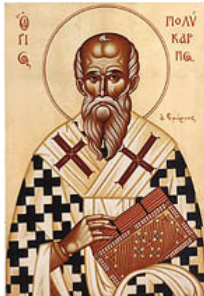
ΑΓ. ΠΟΛΥΚΑΡΠΟΣ 23 Φεβρουαρίου