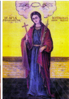
ΑΓ. ΚΥΡΑΝΝΑ Η ΝΕΟΜΑΡΤΥΣ 28 Φεβρουαρίου

Εκτός από τη μεγάλη δεσποτική γιορτή της Υπαπαντής του Κυρίου (2 Φεβρουαρίου), 40 μέρες μετά τα Χριστούγεννα, η Εκκλησία μας τιμά και αγίους, κυρίως μάρτυρες, οι οποίοι έδωσαν τη ζωή τους για τον Χριστό τον μήνα αυτόν, πριν από πολλά χρόνια. Οι πιο γνωστοί από τους αγίους αυτούς και η ημέρα κατά την οποία τιμούμε τη μνήμη τους φαίνονται στην παραπάνω εικόνα.