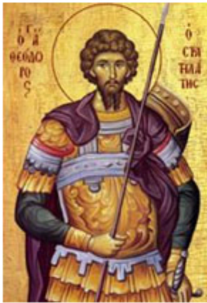
ΑΓ. ΘΕΟΔΩΡΟΣ Ο ΣΤΡΑΤΗΛΑΤΗΣ 8 Φεβρουαρίου