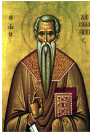
ΑΓ. ΧΑΡΑΛΑΜΠΟΣ 10 Φεβρουαρίου