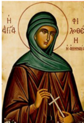
ΑΓ. ΦΙΛΟΘΗΗ Η ΑΘΗΝΑΙΑ 19 Φεβρουαρίου