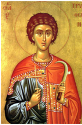
ΑΓ. ΤΡΥΦΩΝ 1 Φεβρουαρίου