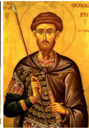
ΑΓ. ΘΕΟΔΩΡΟΣ Ο ΤΗΡΩΝ 17 Φεβρουαρίου