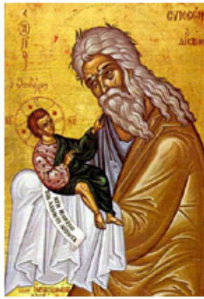
ΑΓ. ΣΥΜΕΩΝ Ο ΘΕΟΔΟΧΟΣ 3 Φεβρουαρίου