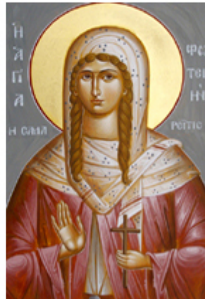
ΑΓ. ΦΩΤΕΙΝΗ Η ΣΑΜΑΡΕΙΤΙΣ 26 Φεβρουαρίου