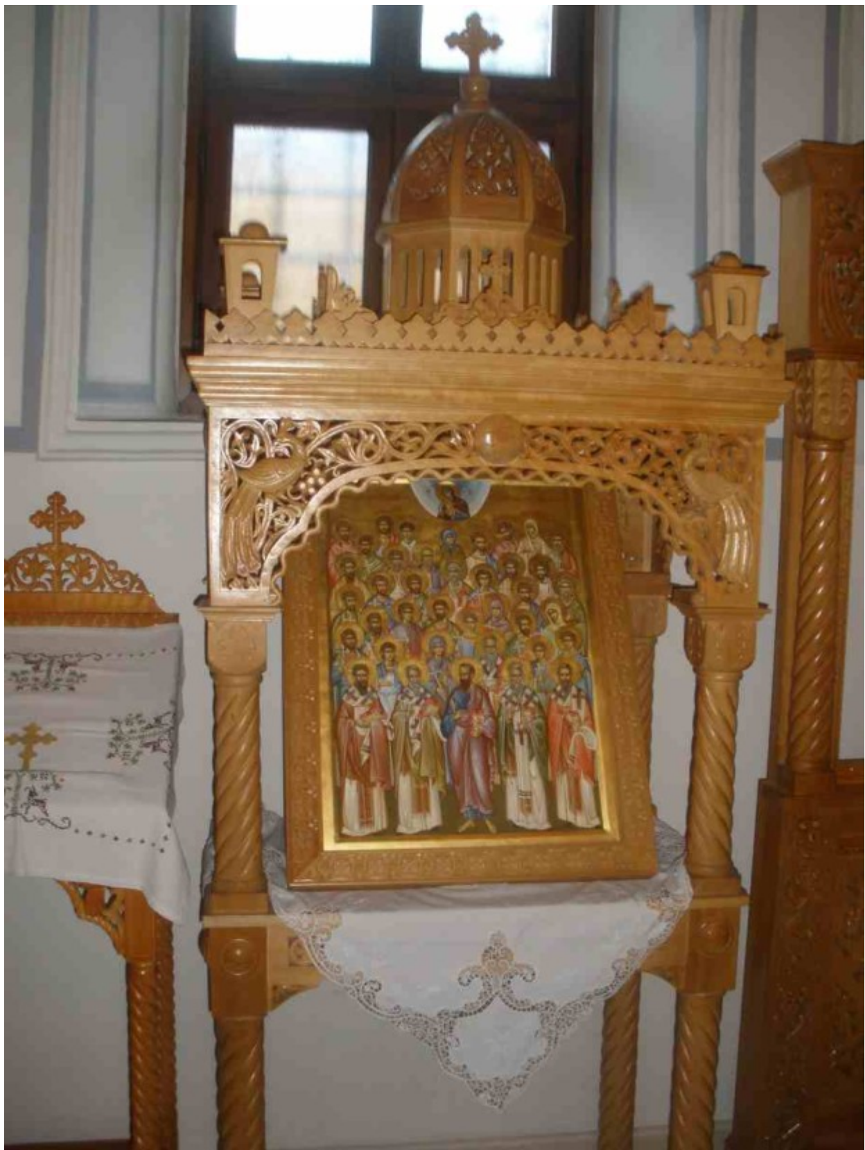
Τρίτη 25/3 (Αττάλεια-Τερμησός-Αττάλεια)