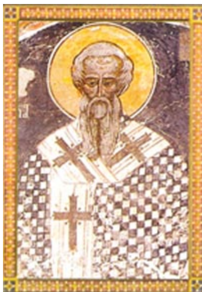
Άγιος Βλάσιος επίσκοπος Σεβαστείας