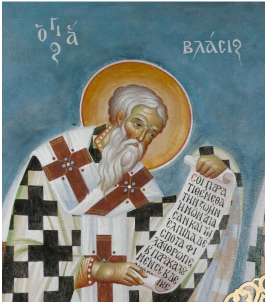
Άγιος Βλάσιος επίσκοπος Σεβαστείας