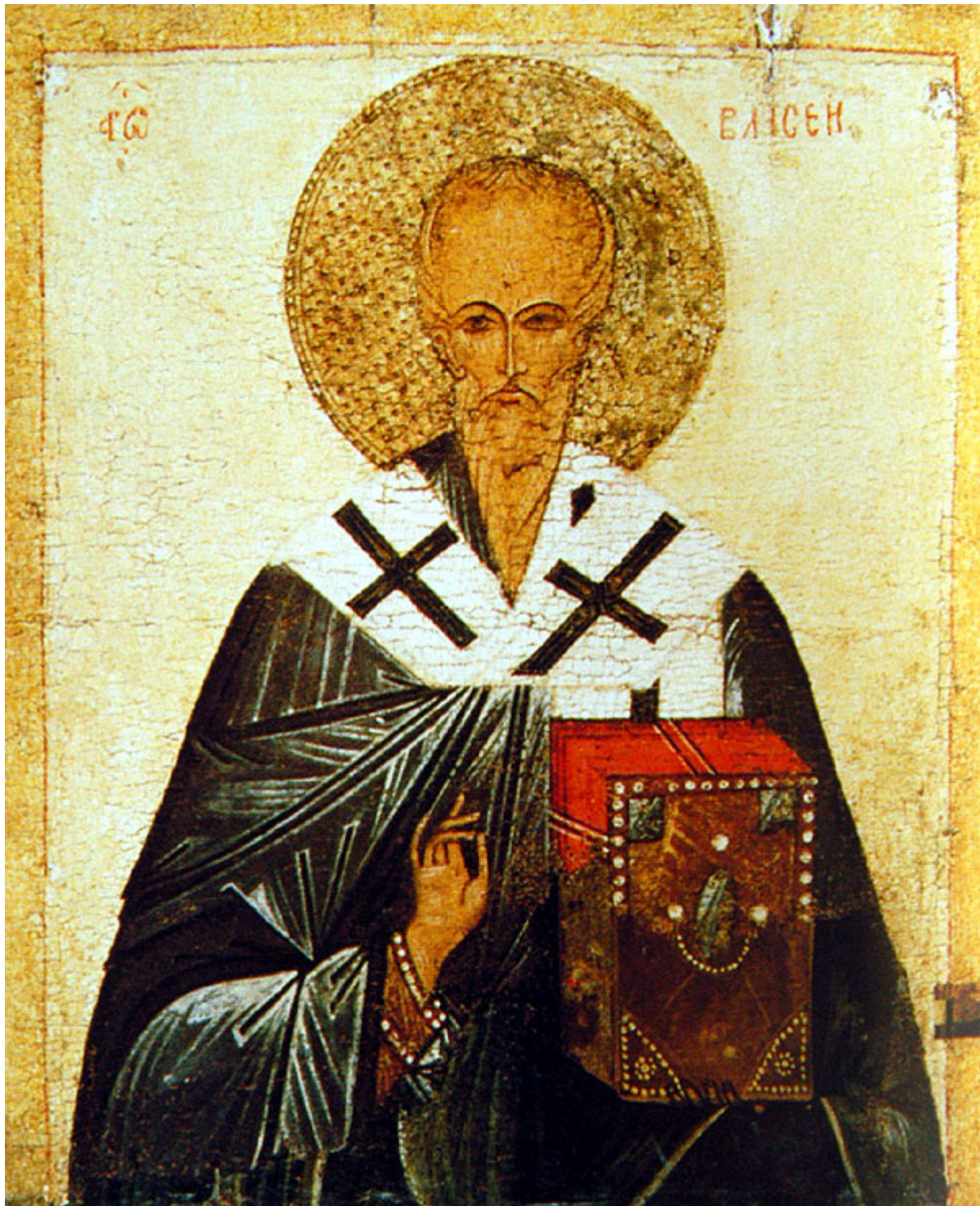
Άγιος Βλάσιος επίσκοπος Σεβαστείας