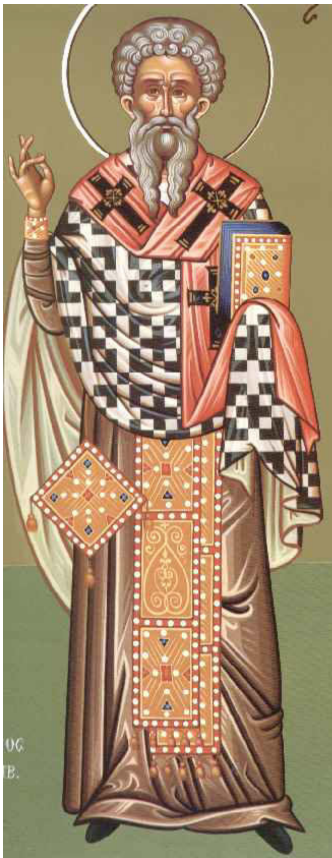
Άγιος Βλάσιος επίσκοπος Σεβαστείας