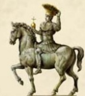
COLONNE HONORIFIQUE DE JUSTINIEN IRIGEE EN L AN 543