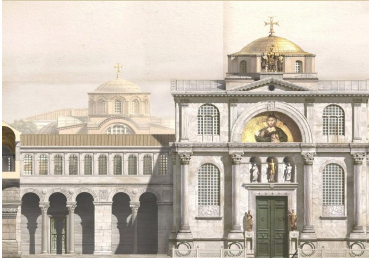
CHAPELLE DV CHRIST & COVPE LATÉRALE DV PASSAGE AERIEN CONDVISANT À LA BASILIQVE SAINTE SOPHIE