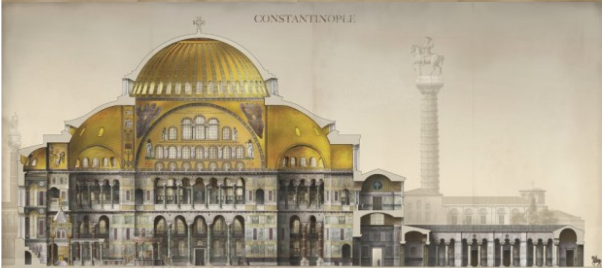
SAINTE SOPHIE coupe est ouest