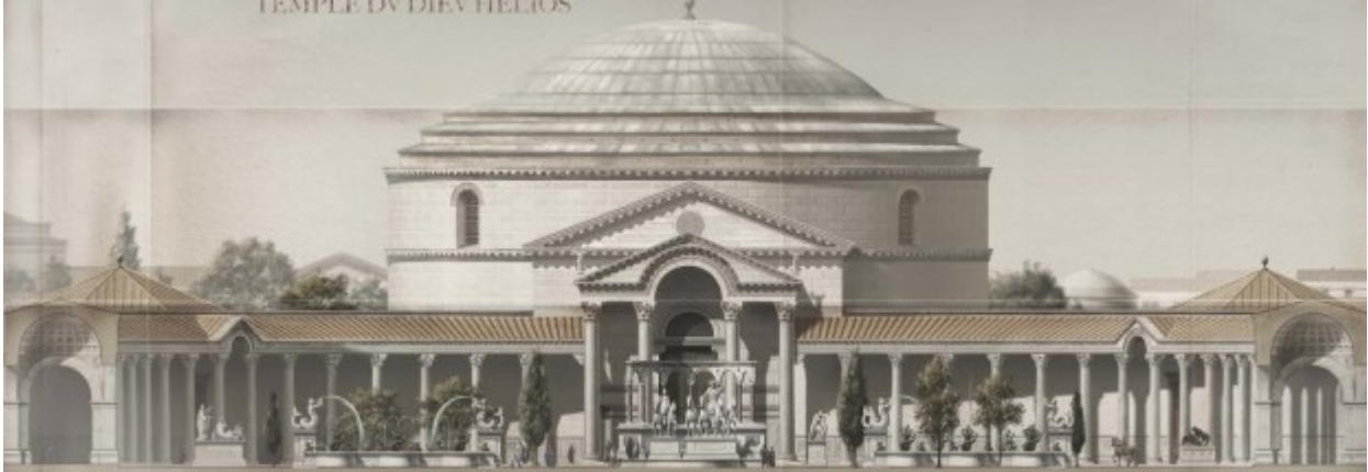
COUPE LONGITUDINALE DE L'ATRIUM EN SIGMA