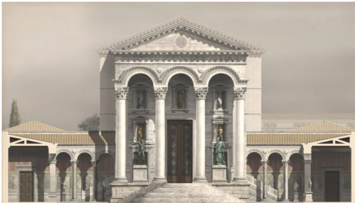
PREMIER SÉNAT AVANT LA SÉDITION DE NIKA CONSTANTINOPLÉ