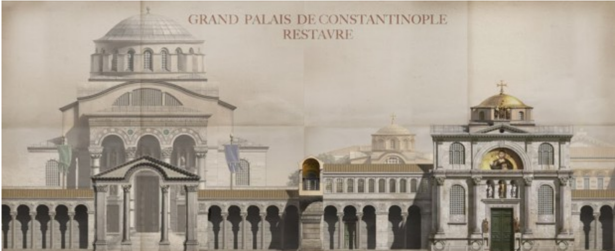
PALATIUM MAGNAURA SENAT