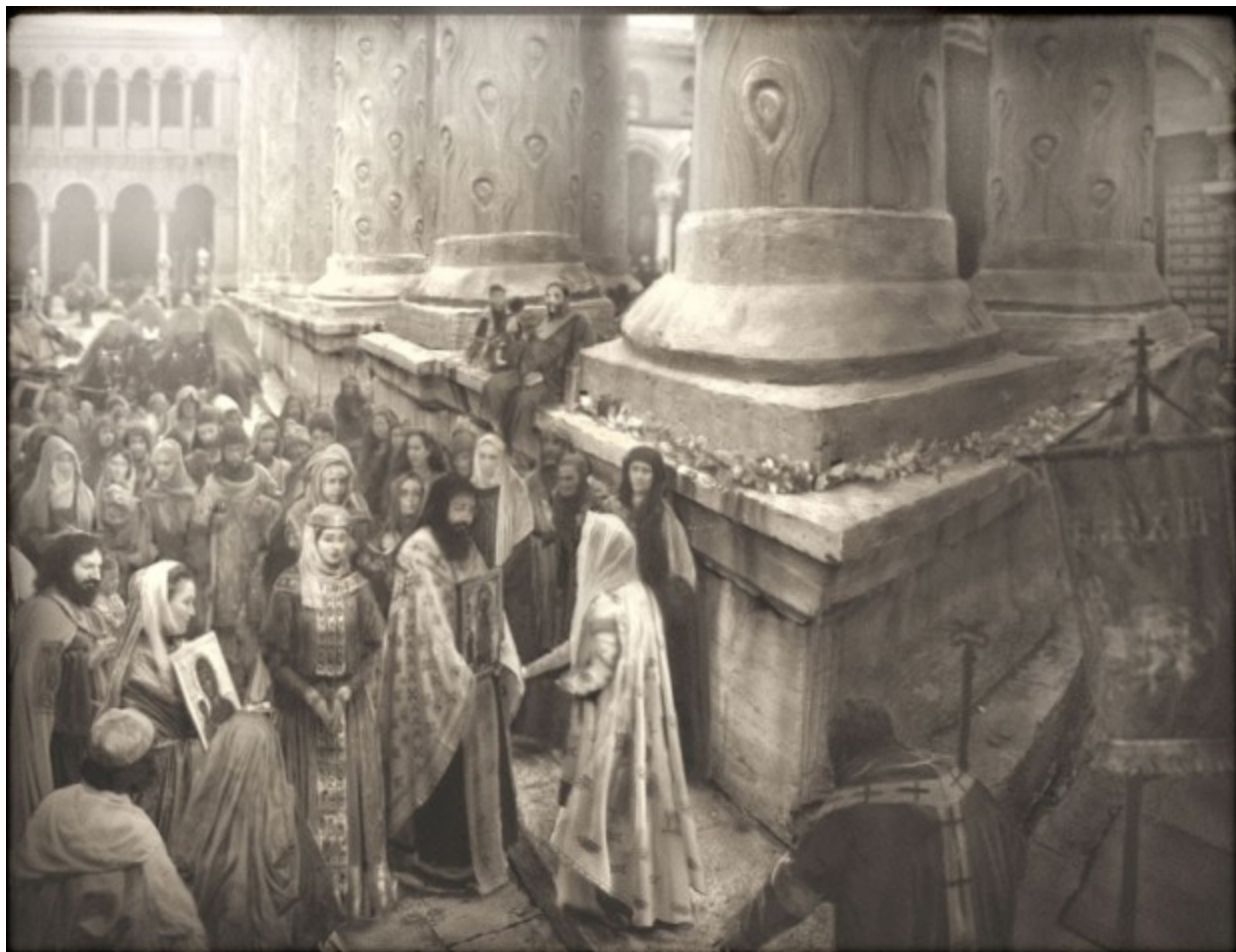
Procession religieuse, autour de l'arc de triomphe de l'empereur Théodose le grand.