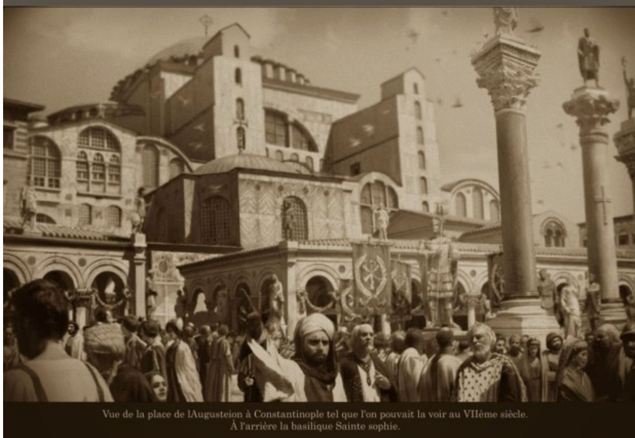
Vue de la place de l'Augusteion à Constantinople tel que l'on pouvait la voir au VII ème siècle. À l'arrière la basilique Sainte sophie.