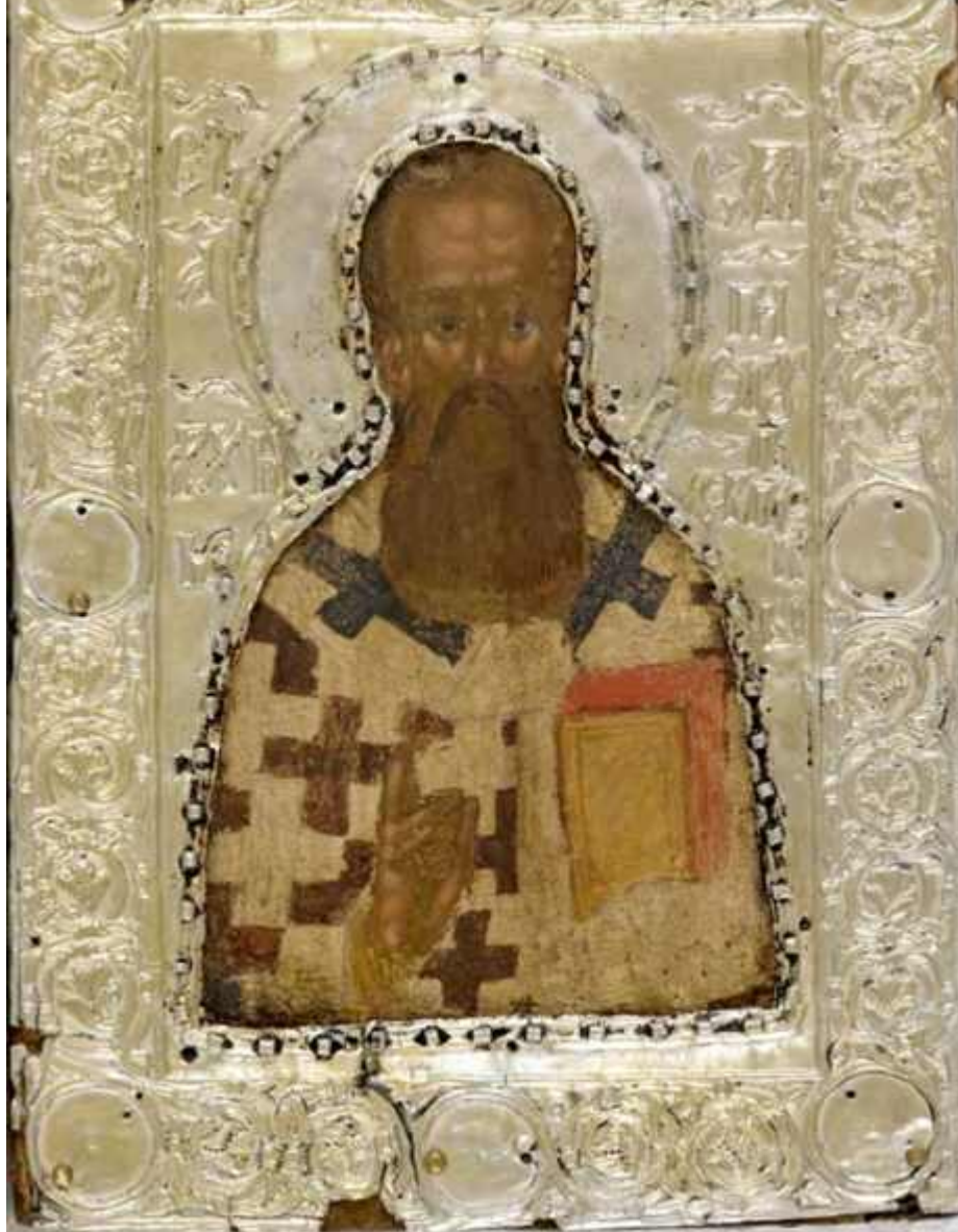
Περίοδευσε όλο το Άγιον

Όρος, αναζητώντας ενάρετους Γέροντες και προσφέροντας στις μονές πλούσια δώρα από αυτά που του έστειλε ο πατέρας του. Το μεγαλύτερο μέρος ασφαλώς πρόσφερε στην αγαπητή μονή που κατοικούσε. Ο νεώτερος βιογράφος του επίσκοπος Νικόλαος, βασισμένος στους πρώτους βιογράφους του αγίου Σάββα, τον σύγχρονο του Δομετιανό και τον κατοπινό Θεοδόσιο, αναφέρει πως κράτησε τα βασιλικά χρήματα για την ανοικοδόμηση της μονής Βατοπαιδίου: