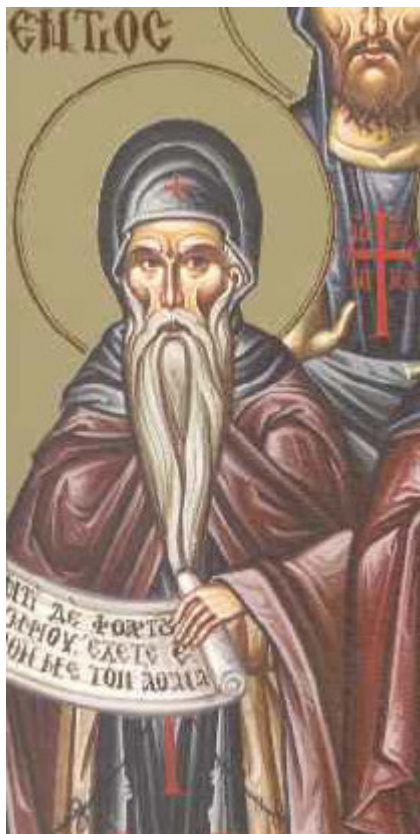
Όσιος Αυξέντιος ο εν τω Όρει

Εορτάζει στις 14 Φεβρουαρίου εκάστου έτους.