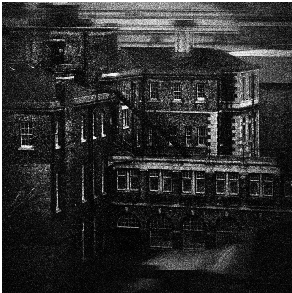
Megalopolis, London, ΜΑΡΚΟΣ ΔΟΛΟΠΙΚΟΣ