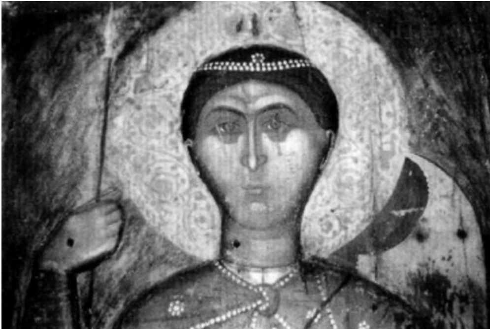
Το πρόσωπο της γλυπτής εικόνας του Αγίου Δημητρίου, κάποτε στον βυζαντινό ναό του Αγίου Γεωργίου στην Ομορφοκκλησιά Καστοριάς.

Σήμερα πιστεύεται ότι η γλυπτή εικόνα του Αγίου Γεωργίου είναι βυζαντινή και ότι κατασκευάστηκε τον 13ο αιώνα στην Κωνσταντινούπολη.