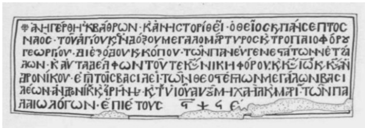
Η κτητορική επιγραφή του βυζαντινού ναού του Αγίου Γεωργίου στην Ομορφοκκλησιά Καστοριάς (σκαρίφημα).

ΑΝΗΓΕΡΘΗ ΕΚ ΒΑΘΡΩΝ Κ(ΑΙ) ΑΝΗΣΤΟΡΙΘΕΙ Ο ΘΕΙΟΣ Κ(ΑΙ) ΠΑΝΣΕΠΤΟΣ ΝΑΟΣ ΤΟΥ ΑΓΙΟΥ Κ(ΑΙ) ΕΝΔΟΞΟΥ ΜΕΓΑΛΟΜΑΡΤΥΡΟΣ Κ(ΑΙ) ΤΡΟΠΑΙΟΦΟΡΟΥ ΓΕΩΡΓΙΟΥ ΔΙ ΕΞΟΔΟΥ Κ(ΑΙ) ΚΟΠΟΥ ΤΩΝ ΠΑΝΕΥΓΕΝΕΣΤΑΤΩΝ ΝΕΤΖΑ- ΛΩΝ Κ(ΑΙ) ΑΥΤΑΔΕΛΦΩΝ ΤΟΥ ΤΕ ΚΥΡ ΝΙΚΗΦΟΡΟΥ Κ(ΑΙ) ΚΥΡ ΙΩ(Α)ΝΝΟΥ Κ(ΑΙ) ΚΥΡ ΑΝ- ΔΡΟΝΙΚΟΥ ΕΠΙ ΤΟΙΣ ΒΑΣΙΛΕΙ(ΑΣ) ΤΩΝ ΘΕΟΣΤΕΠΤΩΝ ΜΕΓΑΛΩΝ ΒΑΣΙ- ΛΕΩΝ ΑΝΔΡΟΝΙΚΟΥ Κ(ΑΙ) ΕΙΡΗΝΗΣ Κ(ΑΙ) ΤΟΥ ΥΙΟΥ ΑΥΤΟΥ ΜΙΧΑΗΛ Κ(ΑΙ) ΜΑΡΙ(ΑΣ) ΤΩΝ ΠΑ- ΛΑΙΩΛΟΓΩΝ ΕΠΙ ΕΤΟΥΣ ΑΨΗΕ (=1287).