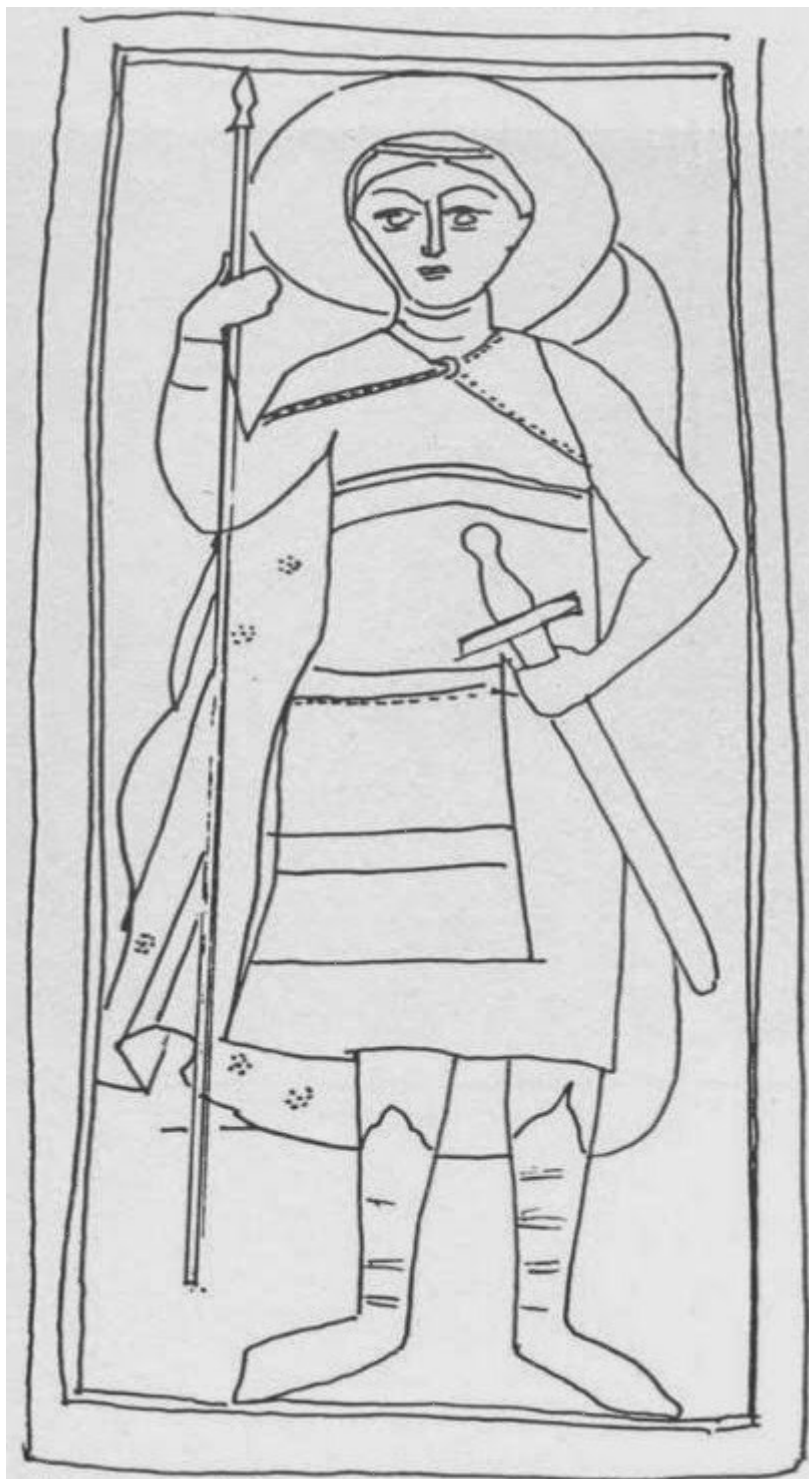
Το σκαρίφημα της γλυπτής εικόνας του Αγίου Δημητρίου.

Οι μελετητές της εικόνας - αγάλματος του Αγίου Γεωργίου της Ομορφοκκλησιάς την συγκρίνουν με μία άλλη ξυλόγλυπτη, επιπεδόγλυφη, με χαμηλό ανάγλυφο, εικόνα του Αγίου Γεωργίου, που φυλάσσεται στο Βυζαντινό Μουσείο Αθηνών και προέρχεται από το ναό της Αγίας Παρασκευής της Καστοριάς της συνοικίας του Οικονόμου.