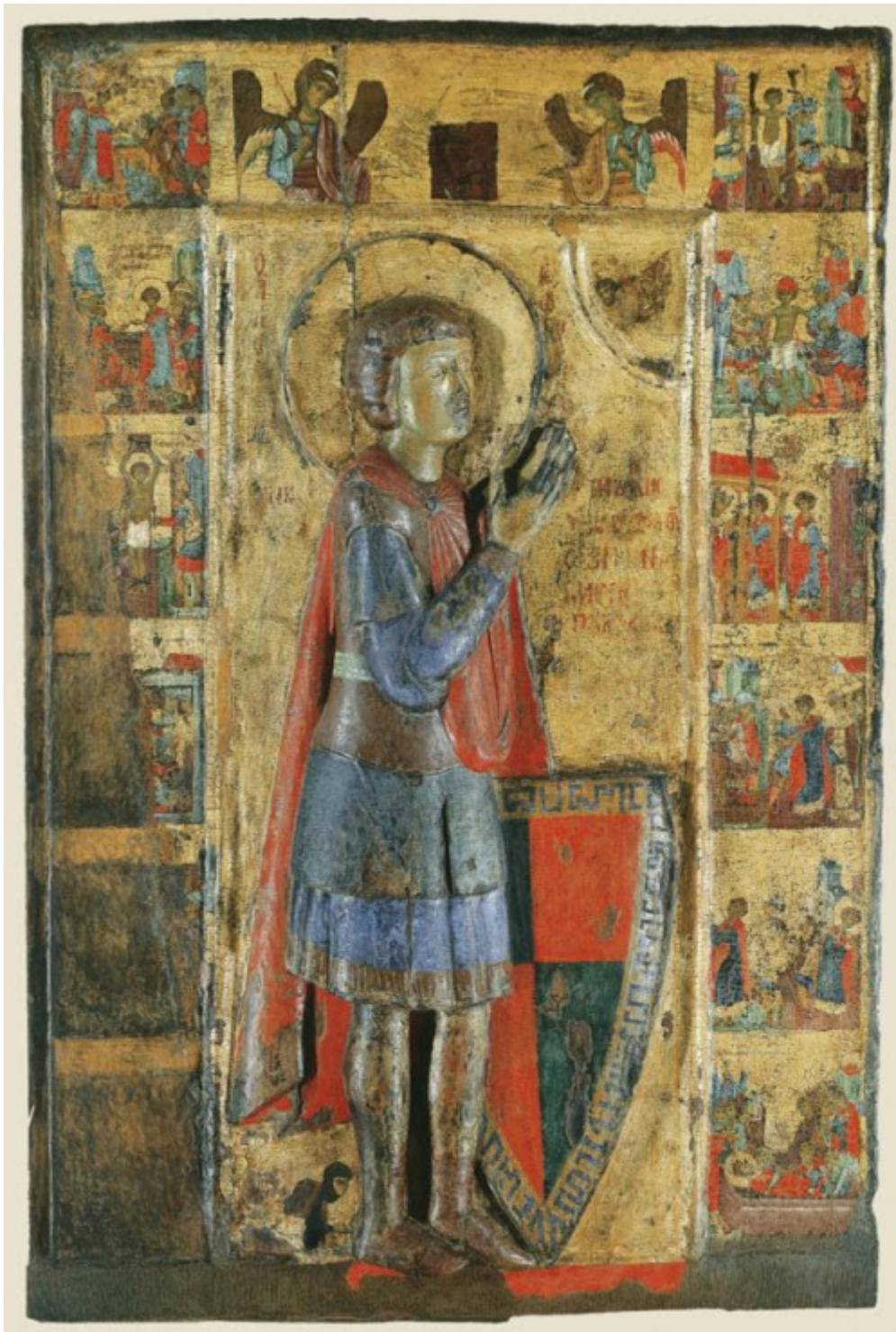
Ξυλόγλυπτη εικόνα του Αγίου Γεωργίου. Βυζαντινό Μουσείο Αθηνών.