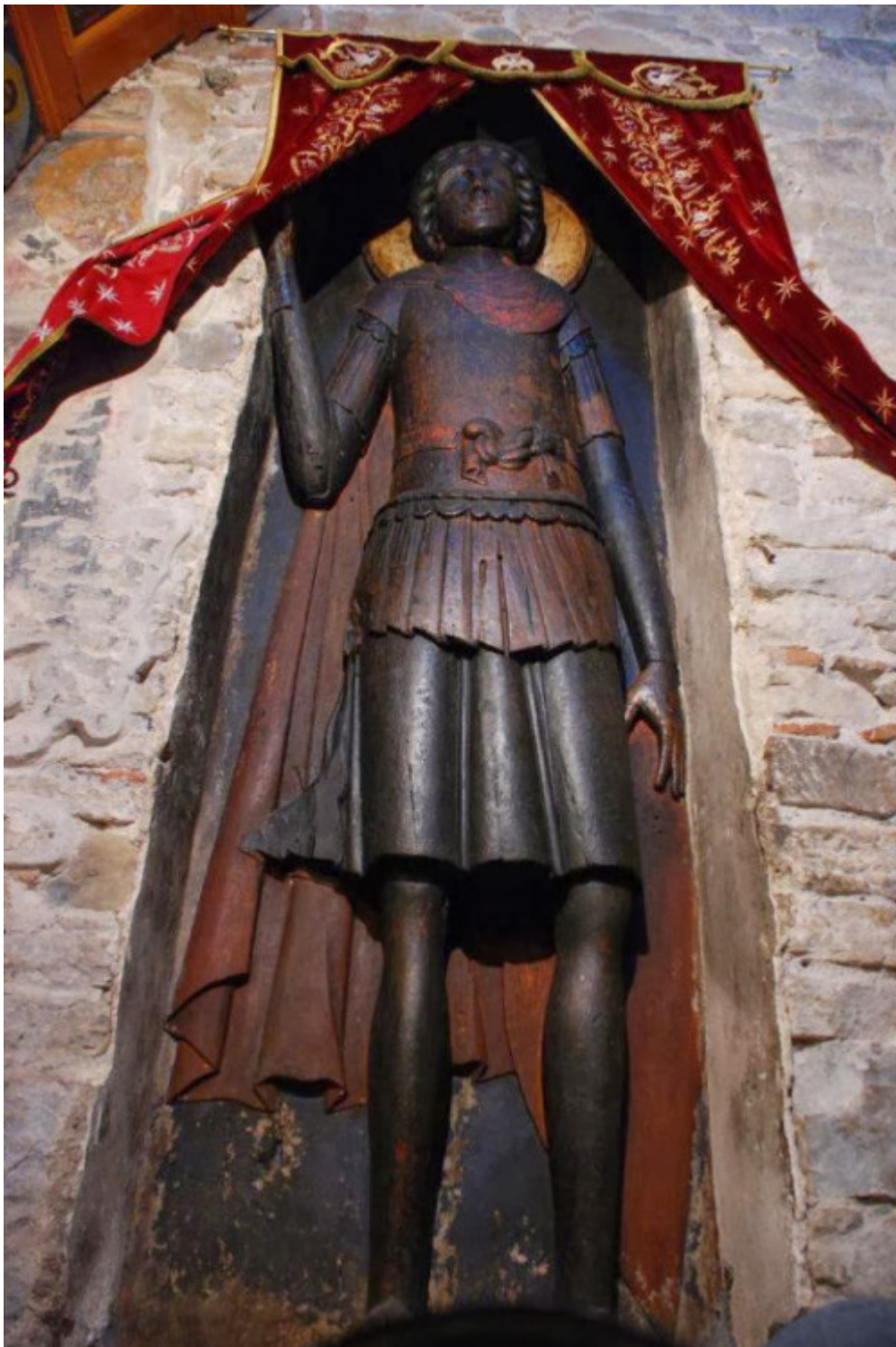
Η υπερμεγέθης ανάγλυφη εικόνα του Αγίου Γεωργίου στην Ομορφοκκλησιά Καστοριάς.

χαρακτηριστικά του προσώπου είναι αυστηρά. σε διάφορα σημεία του ξυλόγλυπτου διατηρούνται ίχνη χρωμάτων, όπως ένα ανοιχτό κιννάβαρι στο χιτώνα, κυανού, στα μανίκια και τις κάλτσες. Ο θώρακας έχει καφέ χρώμα και διακρίνονται ίχνη επιχρυσώσεως.