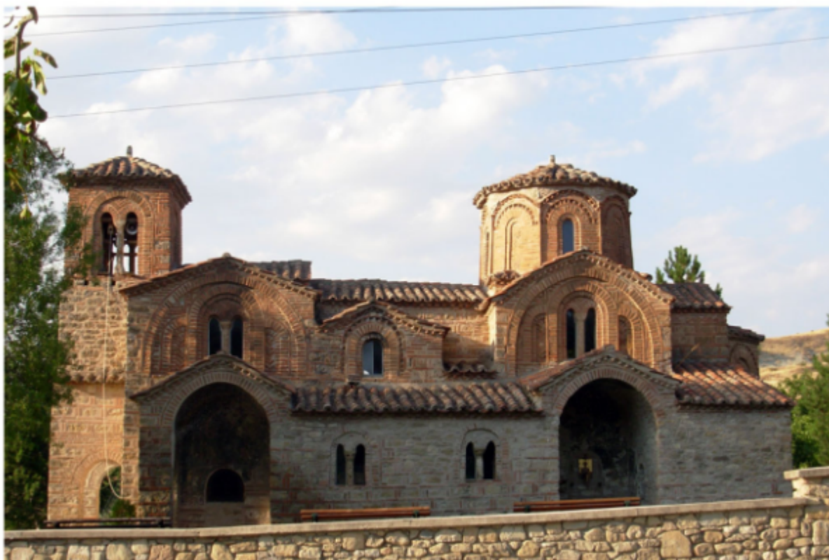
Ο Άγιος Γεώργιος στην Ομορφοκκλησιά Καστοριάς.

Ο αρχικός πυρήνας του καθολικού της μονής είναι ένας τετράστηλος εγγεγραμμένος σταυροειδής ναός με νάρθηκα. Ο πυρήνας αυτός, κρίνοντας από τις τοιχογραφίες που έχουν διασωθεί, πρέπει να κατασκευάστηκε τον 11ο ή 12ο αιώνα.