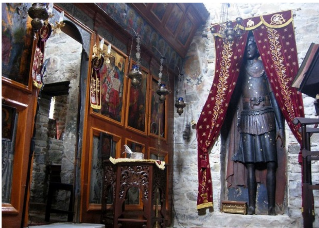
Η υπερμεγέθης ανάγλυφη εικόνα του Αγίου Γεωργίου στην Ομορφοκκλησιά Καστοριάς.

Η φήμη του ναού βασίζεται στη μοναδική στο είδος της ξύλινη, με βαθύ ανάγλυφο, γλυπτή εικόνα του Αγίου Γεωργίου. Το ξύλινο εικόνα - άγαλμα του Αγίου είναι τοποθετημένο στη μεσημβρινή κόγχη που σχηματίστηκε μετά το φράξιμο της μεσημβρινής θύρας επικοινωνίας άλλοτε του ναού με το ύπαιθρο.