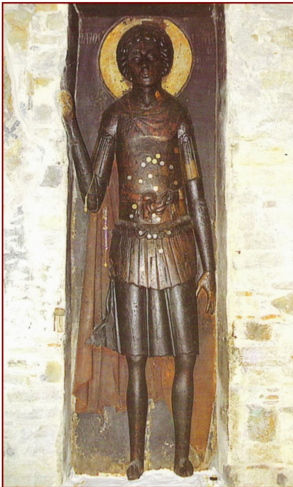
Η υπερμεγέθης ανάγλυφη εικόνα του Αγίου Γεωργίου στην Ομορφοκκλησιά Καστοριάς.