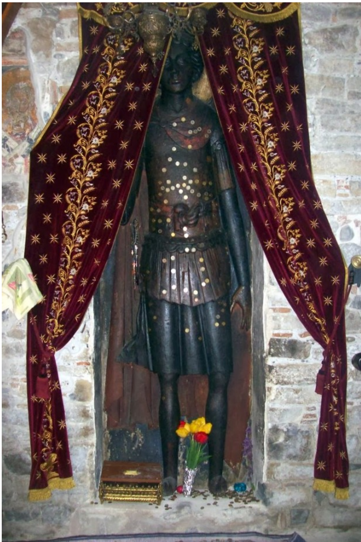
Η υπερμεγέθης ανάγλυφη εικόνα του Αγίου Γεωργίου στην Ομορφοκκλησιά Καστοριάς.