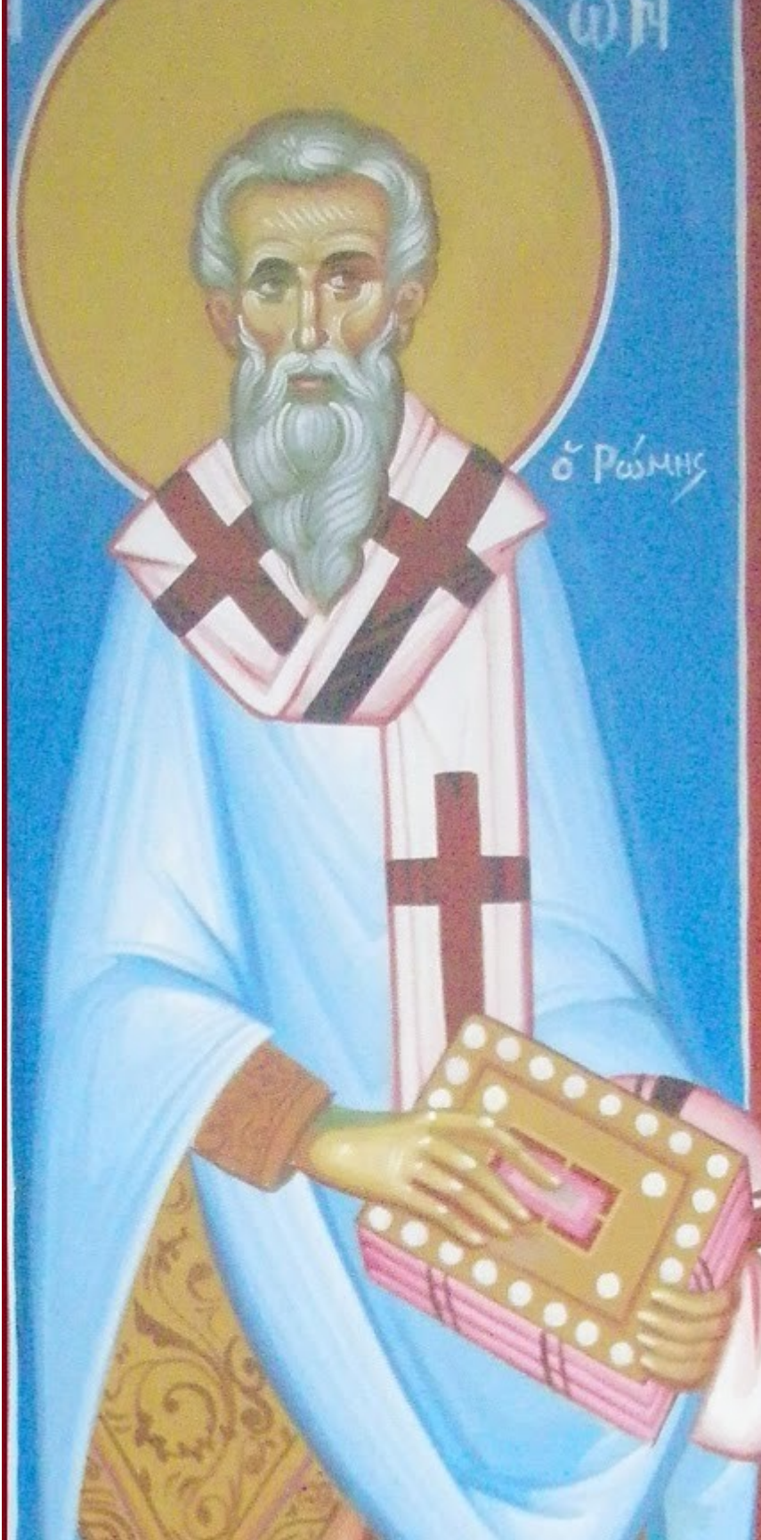
Εορτάζει στις 18 Φεβρουαρίου