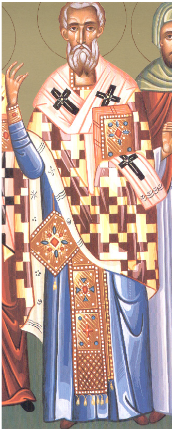
Άγιος Λέων Πάπας Ρώμης