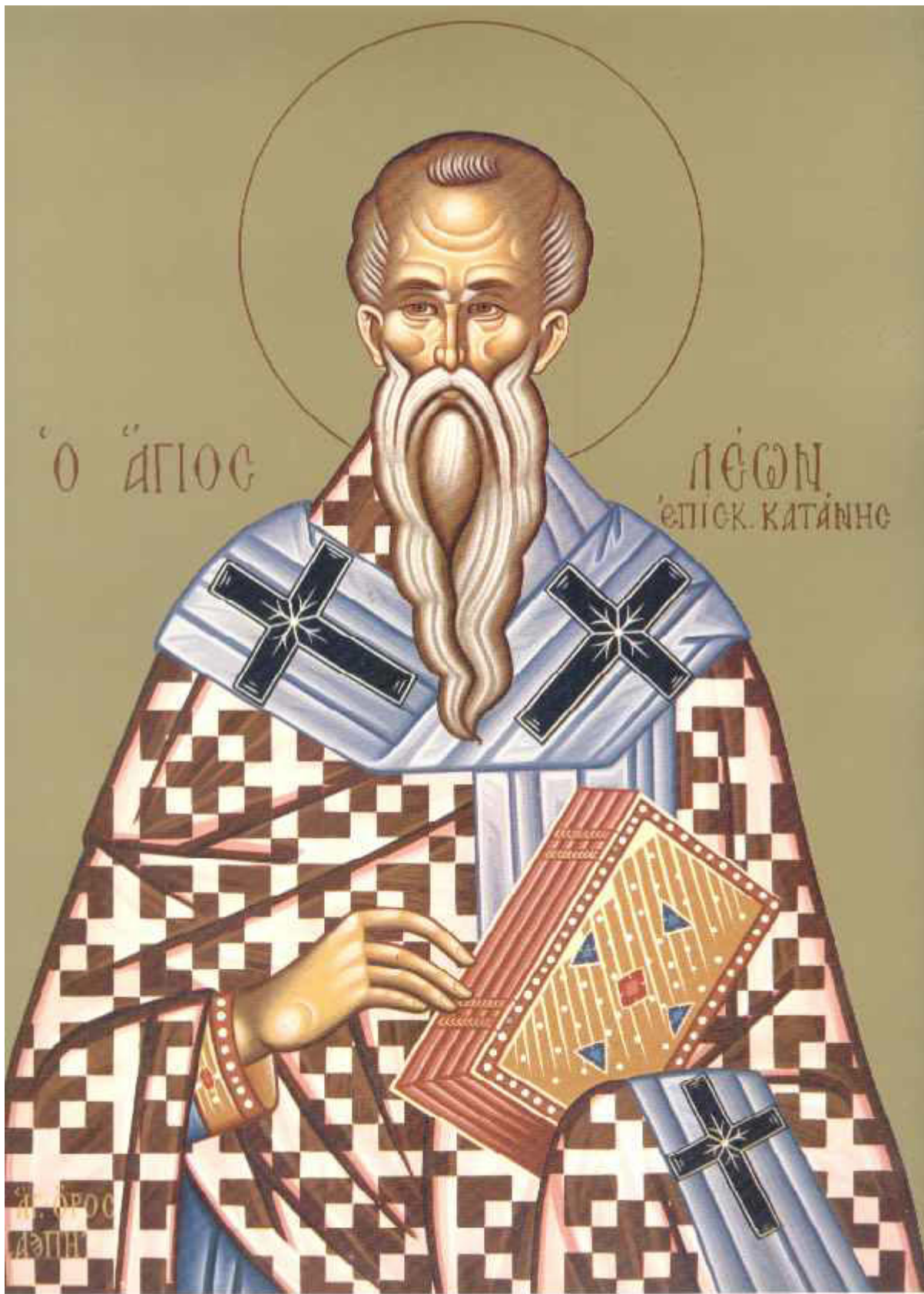
Άγιος Λέων ο Θαυματουργός Επίσκοπος Κατάνης