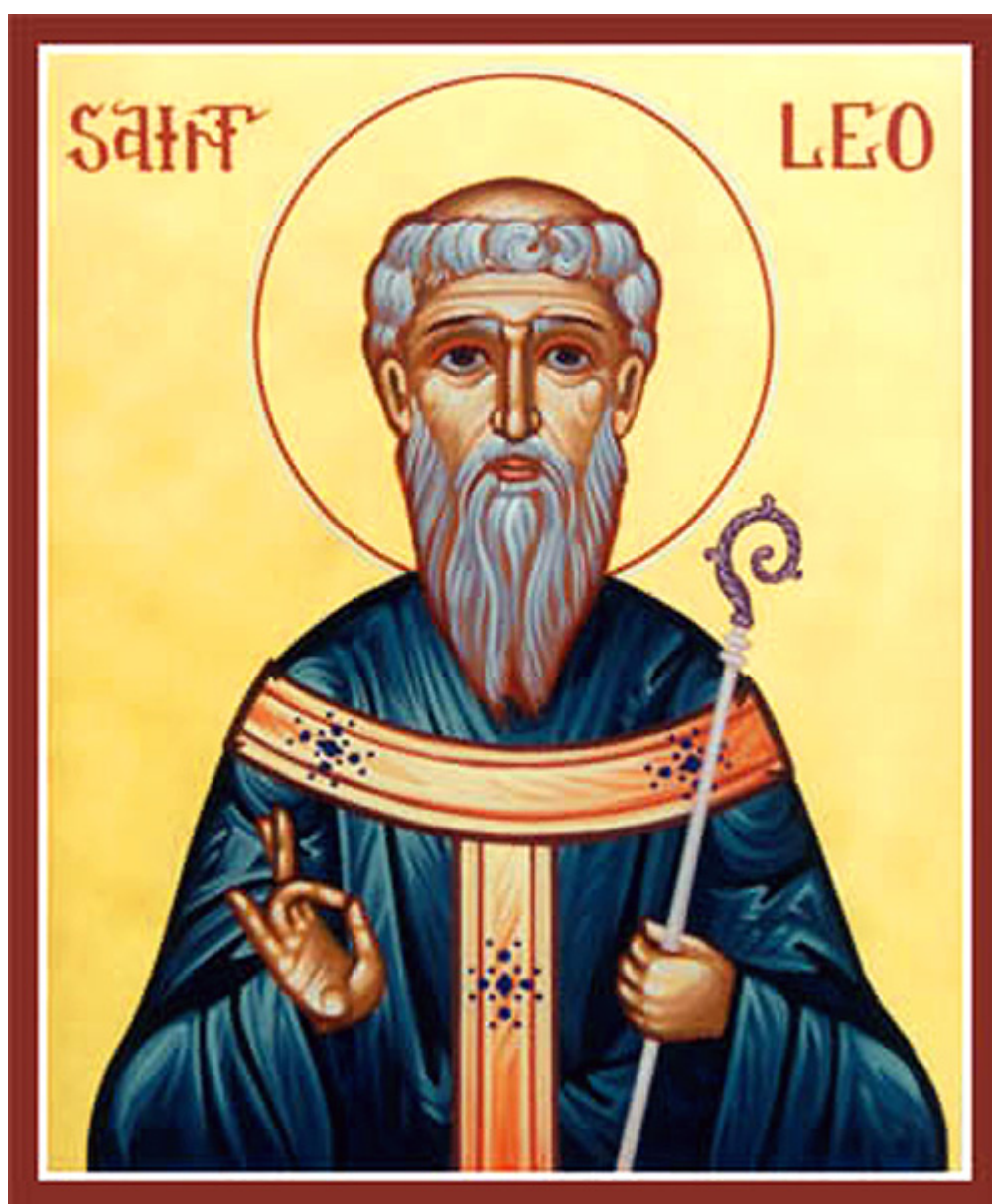
Άγιος Λέων ο Θαυματουργός Επίσκοπος Κατάνης