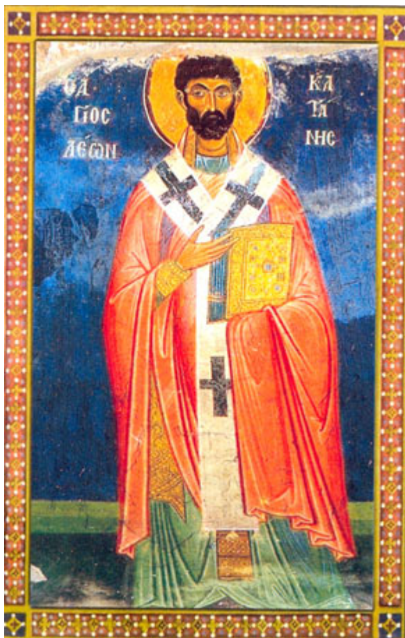
Άγιος Λέων ο Θαυματουργός Επίσκοπος Κατάνης